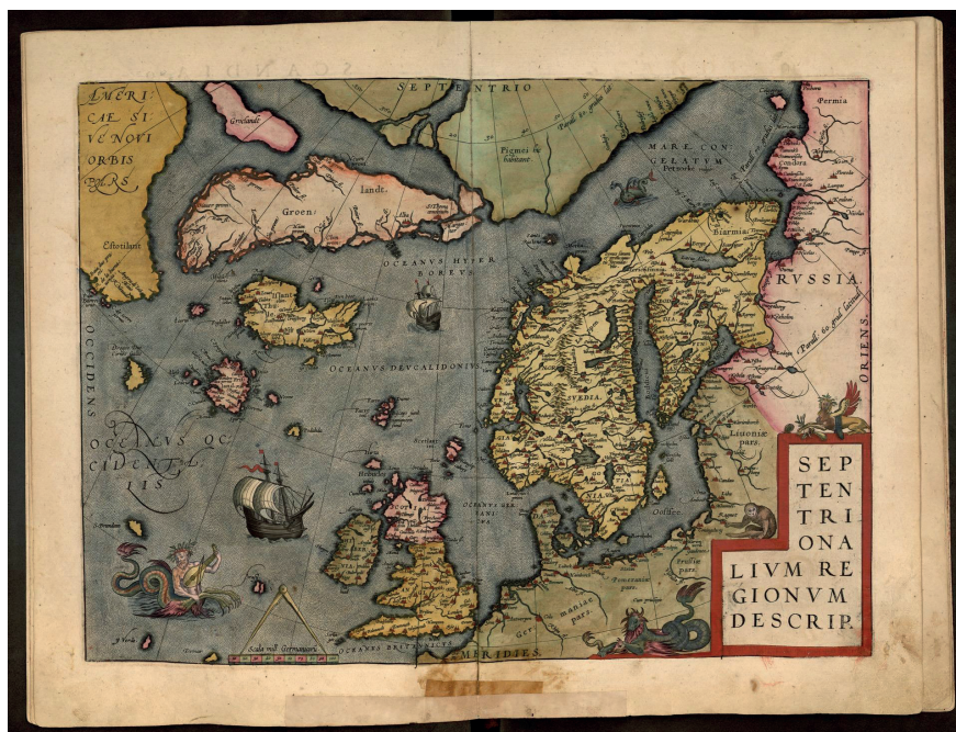
Figura 2. Septentrionalium regionum , 1602.

Para algunos autores, el relato del rapto de Europa «no es más que una leyenda de carácter etiológico, elaborada desde el siglo VIII a. C., para justificar la colonización o expansión hacia Occidente de gentes de origen oriental» 15 . Así, varias hipótesis aluden al origen del nombre de la princesa fenicia: para algunos procede del griego εὐποός (de curso fácil, abundante), mientras que otros afirman que se habría originado en el término εὐρυς (extenso, espacioso). Ambas harían referencia a la riqueza de este territorio, así como a su extensión, ya que «los propios griegos desconocían los límites de la tierra que habitaban» 16 . Sin embargo, una tercera teoría la asocia al acádico, donde la raíz del vocablo significaría occidente, allí donde muere el sol, pues la otra parte del mundo sería oriente, donde nace.