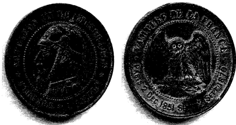
Figura 5. Medalla monetiforme, a imitación de la pieza de 10 céntimos de franco, acuñada tras el Desastre de Sedán.

encuentra en sus ancestros galos cuyas máximas virtudes personifica Vercingetórix. Efectivamente, la figura del jefe galo reviste gran importancia pues durante su breve mandato es capaz –mediante tratados y coaliciones– de extender sus territorios hasta el Rin, y, también, de luchar en defensa de la independencia de sus territorios, como se demuestra en el sitio de Gergovia o de la propia Alesia 335 . Este dato es fundamental ya que fue utilizado como argumento para emprender la guerra con Prusia.