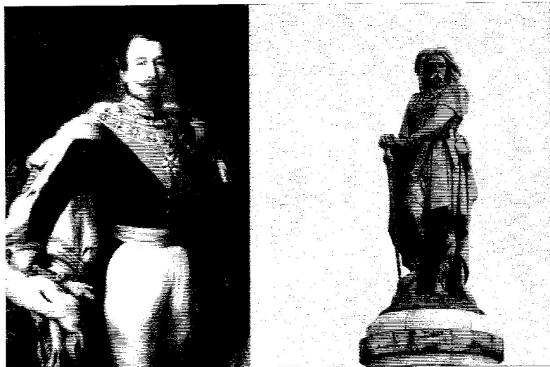
Figura 4. Retrato de Retrato de Napoleón III, Emperador de los Franceses, por Winterhalter (1852) y escultura de Vercingetorix de A. Millet, ubicada en el yacimiento de Alesia

La inauguración de la estatua en honor a Vercingetorix jamás se realizó a pesar de que estaba colocada sobre su pedestal desde finales de agosto de 1865. La inauguración debería haberse realizado en los días posteriores a la finalización del monumento, como se había previsto, y habría sido presidida por el Mariscal Vaillant. Si bien, por orden del emperador Napoleón III, la ceremonia fue aplazada sine die ; se desconocen las razones que motivaron esta decisión 333 .