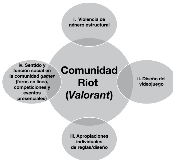
FIGURA 1. Niveles de funcionamiento integrado de las affordances : el ejemplo de Valorant

Aunque, por motivos didácticos, proponemos tres tipos distintos de affordances , en realidad, si atendemos a su lógica, bien podríamos plantear que son niveles distintos de un funcionamiento convergente, integrado. Este funcionamiento establece un continuo entre: i) tendencias estructurales/culturales (como la violencia de género); ii) el diseño de los entornos digitales (como los videojuegos); iii) las apropiaciones e interpretaciones (y actuaciones) por parte de los/as jugadores/as; y iv) el modo que estos diseños e interacciones en los videojuegos encuentran un cierto sentido y función social en las comunidades gamers (sus códigos, valores y percepciones), a través de sus distintos medios y resonancias (Twitter, Twitch, Tik-Tok, foros de Valorant , eventos presenciales, etc.), siendo las firmas editoras y desarrolladoras parte activa de estas comunidades (véase figura 1).