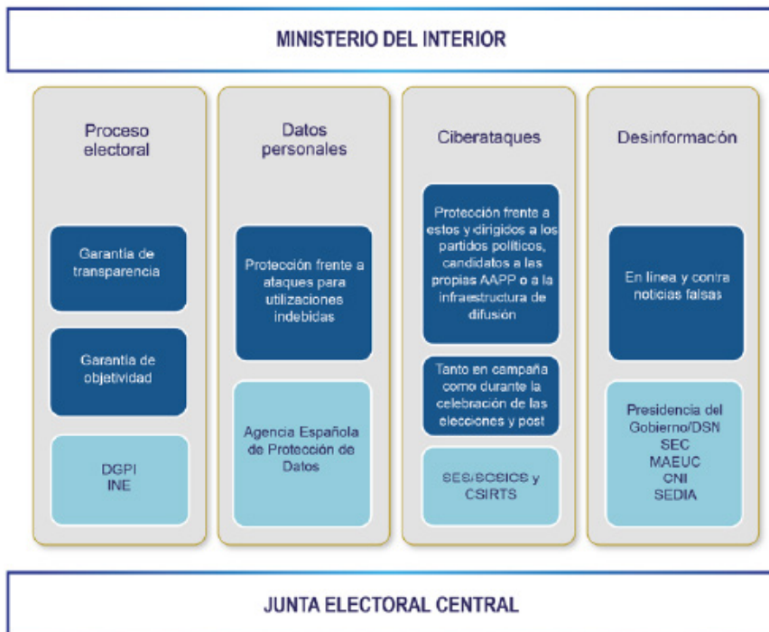
Imagen 2: Instituciones de la Red de Coordinación para la Seguridad en Procesos Electorales.

Lo que requiere coordinación entre las distintas autoridades con competencias que mostramos en la Imagen 2.