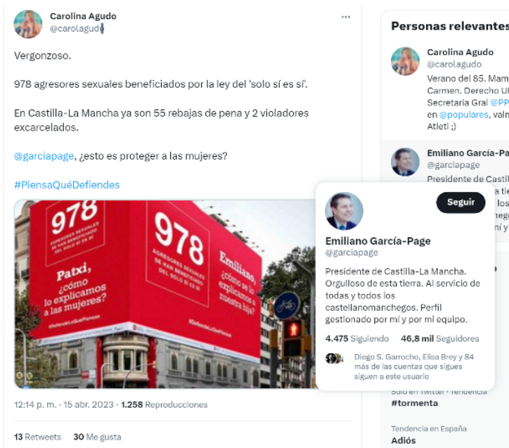
Imagen 3. Ejemplo de uso del #hashtag

Sobre publicidad política en Facebook recogemos dos casos. Uno por la campaña del PP denunciada por el PSOE de Extremadura 40 por contratar y difundir en Facebook inserciones publicitarias antes del inicio de la campaña electoral (artículo 53 de la LOREG) sin que se haya invocado ni aplicado el art. 58 bis.3.