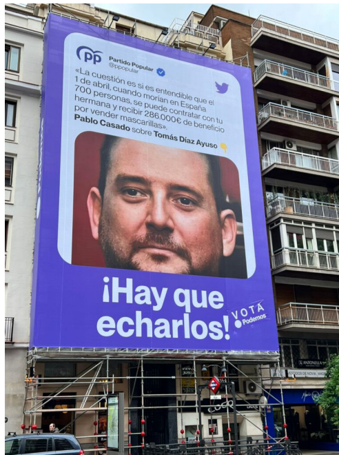
Imagen 4: Lona de Podemos, ahora con su logotipo.

Por otro lado, la Junta Electoral de Zona de Madrid dio por bueno el cartel colgado por Podemos en la calle Goya de Madrid con un supuesto «tuit» del PP con foto del hermano de la presidenta de Madrid, Isabel Ayuso —acuerdo no publicado por la Junta, tan sólo conocida por los medios—. La Junta autorizó ese cartel, pero pidió a Podemos que apareciese su logo en el propio cartel y no solo en los laterales como se comprueba que hizo (Imagen 4).