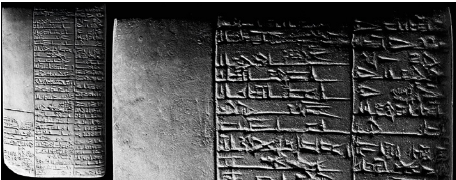
Figura 6. Tabla médica con escritura cuneiforme.

Los escribas pasaron de la figuración concreta del pictograma a las nociones de ideograma y de valor silábico, además, adaptaron el antiguo silabario sumerio a las exigencias de los distintos pueblos con las variaciones propias de las diversas épocas. En lo que llamamos ciencias de la naturaleza (correspondientes al conocimiento de plantas, animales y la materia inerte), se confeccionaron grandes listas más o menos clasificadoras 57 . Las listas de animales los agrupaban por su semejanza lingüística; por ejemplo, derivado del ideograma del asno tenían grafía común el caballo, mulo, onagro, dromedario y camello. Otro ejemplo era el de un mismo ideograma que servía como signo distintivo para los nombres de todos los roedores emparentados con la rata 58 .