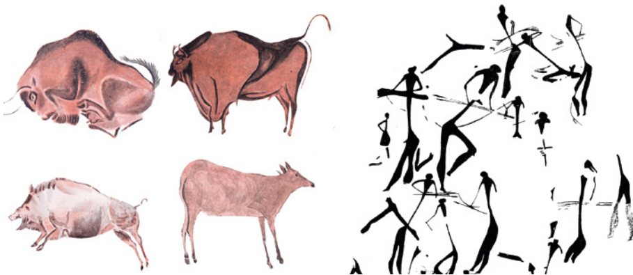
Figura 4. A la izquierda, un detalle de la fauna representada en la Cueva de Altamira 51 . A la derecha, composición de pintura levantina representando una batalla de arqueros en la cueva de Valltorta 52 .

Un elemento que propició el progreso del ser humano fue otra técnica precientífica: la producción y la conservación del fuego. Su dominio constituyó un hecho diferencial frente al resto de especies. Por un lado, abrió la posibilidad de colonización de regiones frías e inhóspitas al proporcionar calor; además, el fuego habría de servir para suministrar luz, dirigir la caza, hacer señales, trabajar el sílex o mejorar la alimentación con los alimentos cocinados. En torno al fuego se vienen reuniendo los seres humanos desde el Paleolítico superior hace 400.000 años 50 .