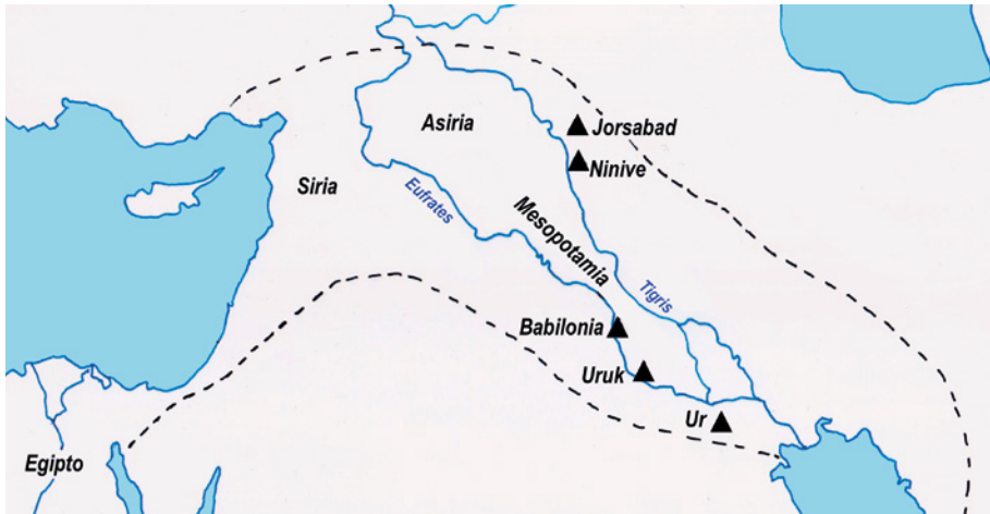
Figura 5. Mapa de las principales áreas donde se desarrollan las culturas del Creciente Fértil, en torno al Nilo (Egipto), y entre los ríos Éufrates y Tigris (Mesopotamia).

a. C. Esta región, junto con una Mesopotamia definida al este del Creciente, entre los ríos Tigris y Éufrates, aglomeró una compleja realidad de culturas a partir de la Edad de Bronce, por lo que la zona ha recibido el nombre de «cuna de la civilización» (figura 5).