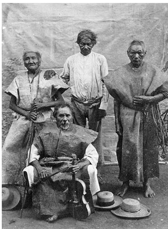
Indios Baures, autor desconocido, c. fines de siglo XIX. Fuente: Fondo fotográfico “Álbum de Bolivia”. Ibero-Amerikanisches Institut, Berlín.

“Sin indios o hay industria del caucho”: los indígenas amazónicos frente a la colonización gomera