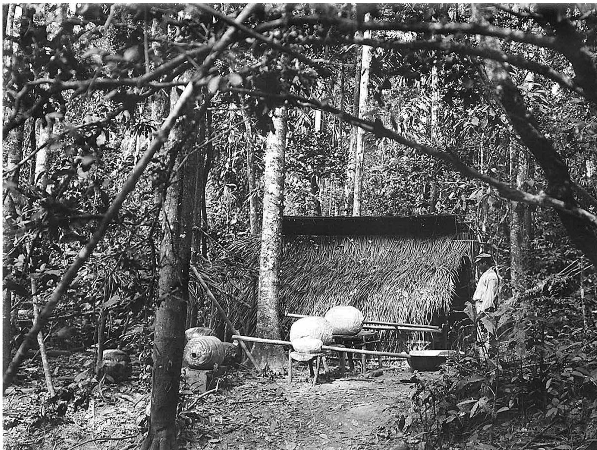
Choza para ahumar goma de seringueiros en Barraca San Francisco, 1911, Eduard Seler.

Por este motivo, primero se dictaron medidas para “corregir [los] abusos que se cometen en el enganche de mozos y criados” a nivel local y regional. 15 Y posteriormente se promulgó, a nivel estatal, la que sería la principal norma de contratación para el norte amazónico: la ley enganche de peones de 16 de noviembre de 1896. Esta nueva medida sólo se aplicó en la región situada por encima del paralelo 14°, donde se encontraban los árboles de goma elástica. Por otra parte, los peones contratados para trabajar al sur de este paralelo –es decir, en los Llanos de Mojos– seguían sujetos a la ley de 24 de noviembre de 1883. La ley