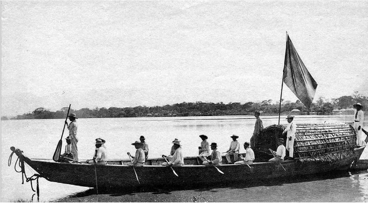
Un batelón, 1908-1911