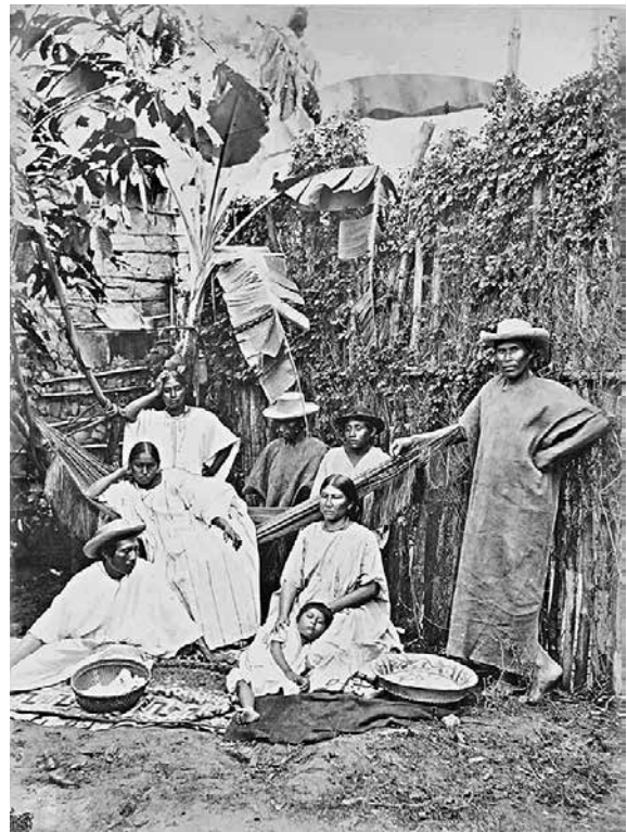
Tripulantes bolivianos con sus familias en el río Madera, c. 1865, Albert Frisch.

Por el contrario, la adopción de hábitos próximos a la economía de mercado y el interés propio por parte de la elite nativa de otros grupos étnicos, como los cayubabas y los baures, permitió consolidar su dirigencia y hacerse un hueco en los entramados de influencia política y poder económico de fines del siglo XIX. Exaltación, hogar de los cayubabas, durante años había servido como astillero, siendo el “pueblo que más frecuentemente comercia[ba] con el vecino Imperio del Brasil”, y último puerto donde los viajeros procedentes del interior de Bolivia podían contratar tripulantes para descender por los ríos brasileños. 48