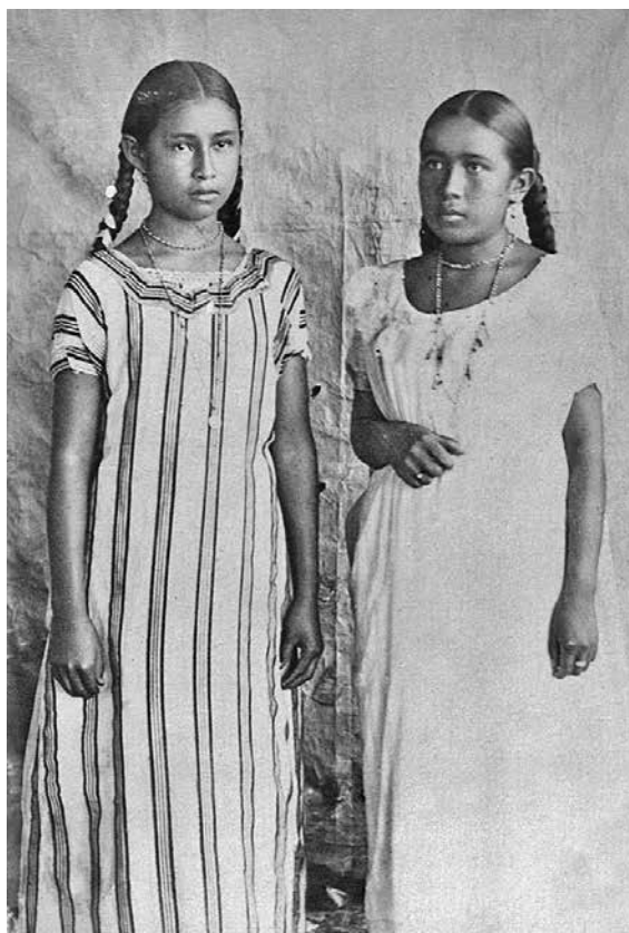
Indias Baures, autor desconocido, c. fines de siglo XIX. Fuente: Fondo fotográfico “Álbum de Bolivia”. Ibero-Amerikanisches Institut, Berlín.