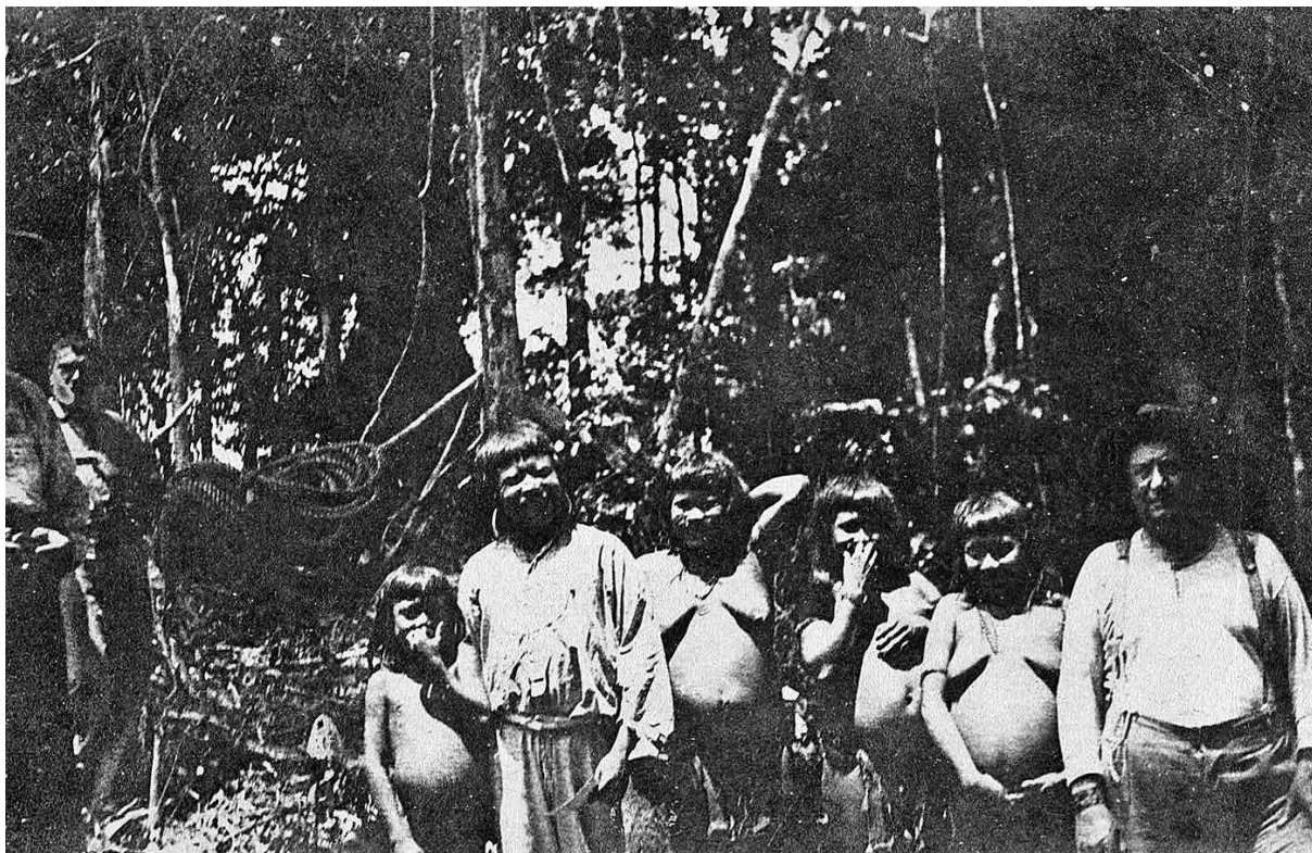
Indígenas Caripunas en Tres Hermanos