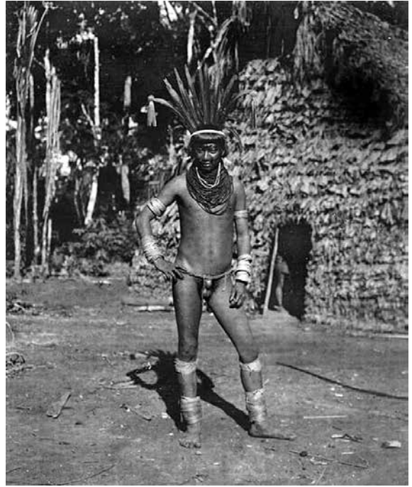
Chacobo, lago Rojo Aguado, Erland Nordenskiöld, 1908-1909.