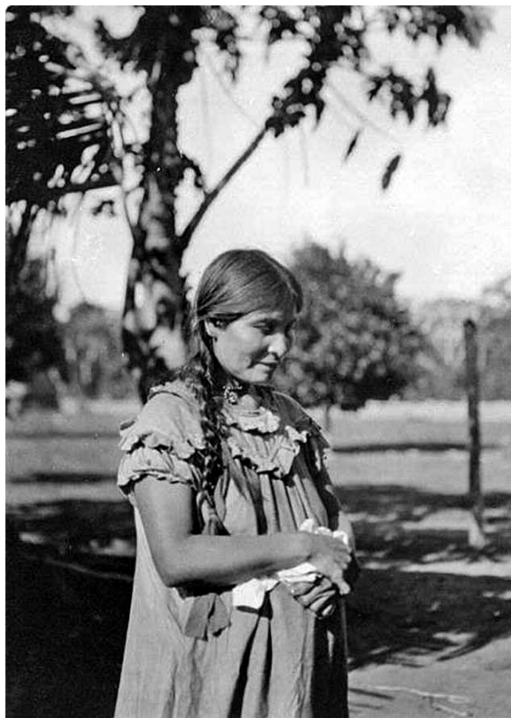
Mujer indígena cavineña, río Beni, Erland Nordenskiöld, 1913-1914.

que mientras que en la central del imperio gomero trabajaban los indios “civilizados”, provenientes mayormente de los Llanos de Mojos y sus regiones adyacentes, en los centros gomeros más alejados se empleaba a los indígenas “menos civilizados”, aunque dóciles o al menos adaptables, como los araonas o los cavineños. 87 Todavía para la década de 1940,