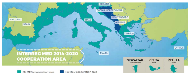
Figura 2. Mapa Interreg Med 2014-2020.

Para ser lo más eficientes posible, los proyectos también trabajan en desencadenar cambios en políticas y estrategias políticas en estos tres ámbitos. En este sentido, el Programa tiene como objetivo construir una nueva comunidad de intereses a través de la implementación de herramientas y políticas estructura, con un presupuesto total de 275 millones de euros para el periodo 2014-2020.