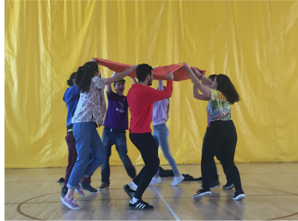
Ilustración 2. Children at Risk of Poverty in Spain