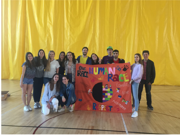
Ilustración 1. “Racism”