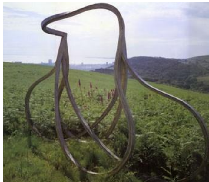
“figura 3. 1983. Madera laminada. 274 x 366 x 153 cm”.