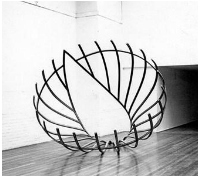
“figura 1. 1980. Madera laminada.300 x 289 x 289 cm.”

Long o Anthony Gormley). La asistencia al acto fue reducida, mientras en las aulas se realizaba el ejercicio de modelado del natural que nos correspondía elaborar en ese momento. A pesar de la falta de nitidez que tengo ahora de estos hechos del pasado, sí puedo decir, que aquella exposición fue significativa y determinante en la concepción de lo que sería para mí la escultura a partir de entonces.