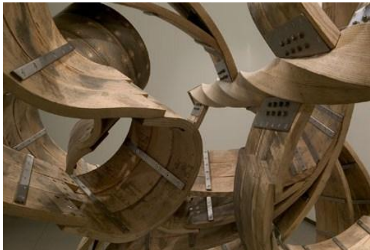
“Figura 5. Detalle constructivo.

refuerza su valor. Ningún elemento resulta accidental para nuestra experiencia. La erótica de estas piezas le debe mucho a la inflexión en su factura, a la efectividad de las manos responsables de la ejecución (fig 5). Extremadamente atento a los acabados, sus texturas remiten al placer de la fabricación exquisita, considerando siempre la escultura como un todo en el que cada parte, por pequeña que sea, posee un valor insustituible, donde los remaches son tan necesarios como las piezas que sujetan, donde el sobrante de cola cumple una función tan importante como la pintura aportada a la superficie. Enmarañado y elíptico algunas veces, sencillo y lineal en otras, sus trabajos se muestran como lances a la inteligencia, como problemas filosóficos, y frente a otras esculturas que nos orientan o exigen una determinada disposición a la hora de contemplarlas, la obra de Deacon liberaliza al máximo la perspectiva del espectador, tolerando las formas de contemplación mas inusuales pudiendo llegar a ser ingenuas o infantiles.