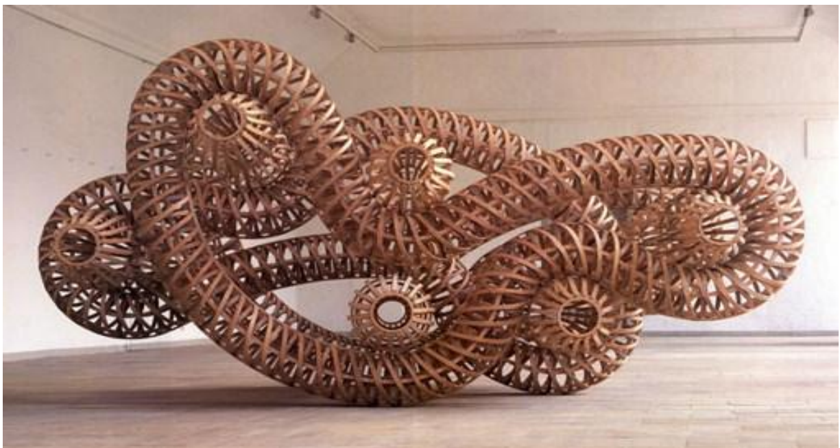
“Figura 3. 1993. Madera curvada con pegamento, tornillos y cables. 286 x 560 x 483 cm.”

Interesado por la obra del norteamericano Don Judd, se aproximará al concepto de objeto específico, asimilando procedimientos de construcción cercanos al montaje, distanciándose en cambio de resoluciones técnicas típicamente británicas como puede ser la unión mediante soldadura fija tan utilizada por Anthony Caro. Estos hábitos técnicos escogidos, le llevarán a poner en práctica toda una extensa relación de operaciones manuales, que en un principio pueden llegar a parecerse alineadas y repetitivas como son: remachar, flexionar, atornillar, laminar, cortar, taladrar, pegar, pintar, barnizar, presionar... y además enlazan con la “obra tridimensional” de escuela trasatlántica. Será la continua referencia práctica y técnica a esta infraestructura cultural de materiales y procesos uno de los motivos más importantes en los que se fundamenta su modernidad.