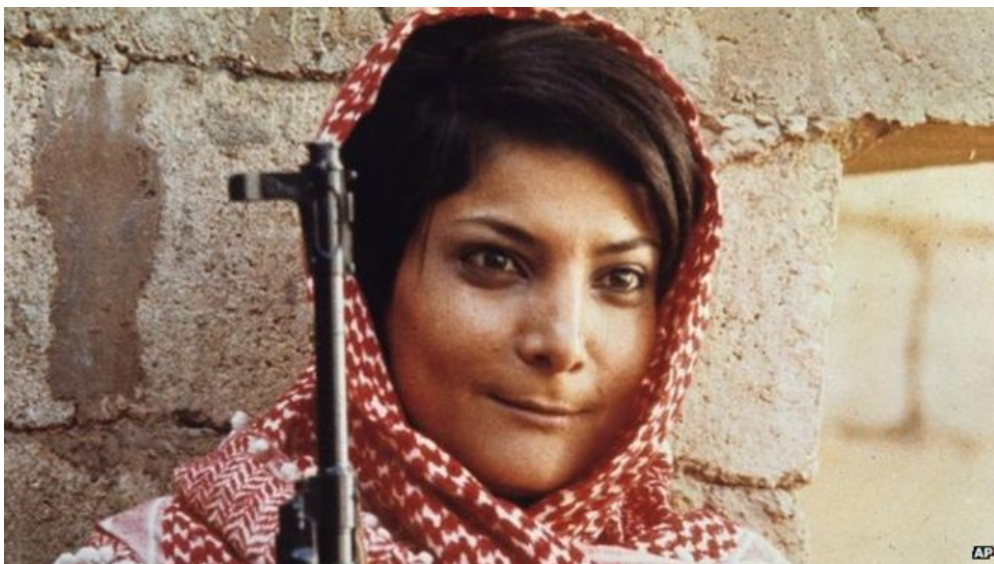
Imagen 1: Leila Khaled, primera mujer en secuestrar un avión (1969).

Frente a estos datos, conviene puntualizar que las organizaciones terroristas islamistas se habían mostrado reticentes a engrosar sus filas con mujeres, sin embargo, la propaganda vertida en diferentes medios de comunicación dirigida exclusivamente a este colectivo confirma un cambio en la tendencia conocida. Esta evolución responde a necesidades tácticas, aunque el fenómeno de las “mujeres bomba” se circunscribe a zonas de conflicto de Oriente Medio y Oriente Próximo tales como Líbano, Palestina, Sri Lanka, Irak, Kurdistán y Chechenia (Baños Bajo, 2009: 1- 4).