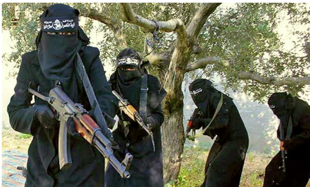
Imagen 2: Brigadistas de Al-Khanssaa.

La formación de la Brigada Al-Khanssaa fue anunciada el 14 de febrero de 2014 por el ISIS y su misión es realizar labores de vigilancia y castigo en la ciudad de Raqqa, lugar dónde se creó (García García: 2015: 9). El portal de noticias Syria Deeply informaba del suceso, recogiendo la declaración de un oficial del ISIS "La yihad no es solo un trabajo de los hombres, las mujeres también deben hacer su parte" 11 .