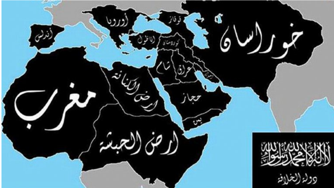
Figura A1: “Utopía de Estado Islámico sobre la formación del neo-califato del ISIS”.