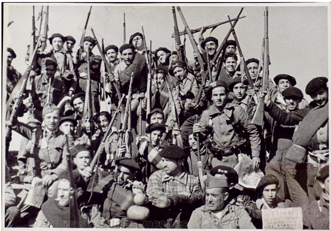
Imagen 1: Milicianos vascos en el frente de Navalcarnero. En la esquina inferior derecha puede apreciarse un ejemplar de El Liberal del 29 de octubre de 1936 141

fotografía de milicianos sosteniendo entusiastamente la edición de El Liberal con el discurso de Largo bajo el titular de ¡Al Ataque! 140 .