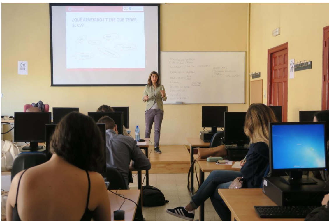
Fig. 2. Taller Curriculum Vitae y carta de presentación (OPE) en la Facultad de Ciencias de la Documentación