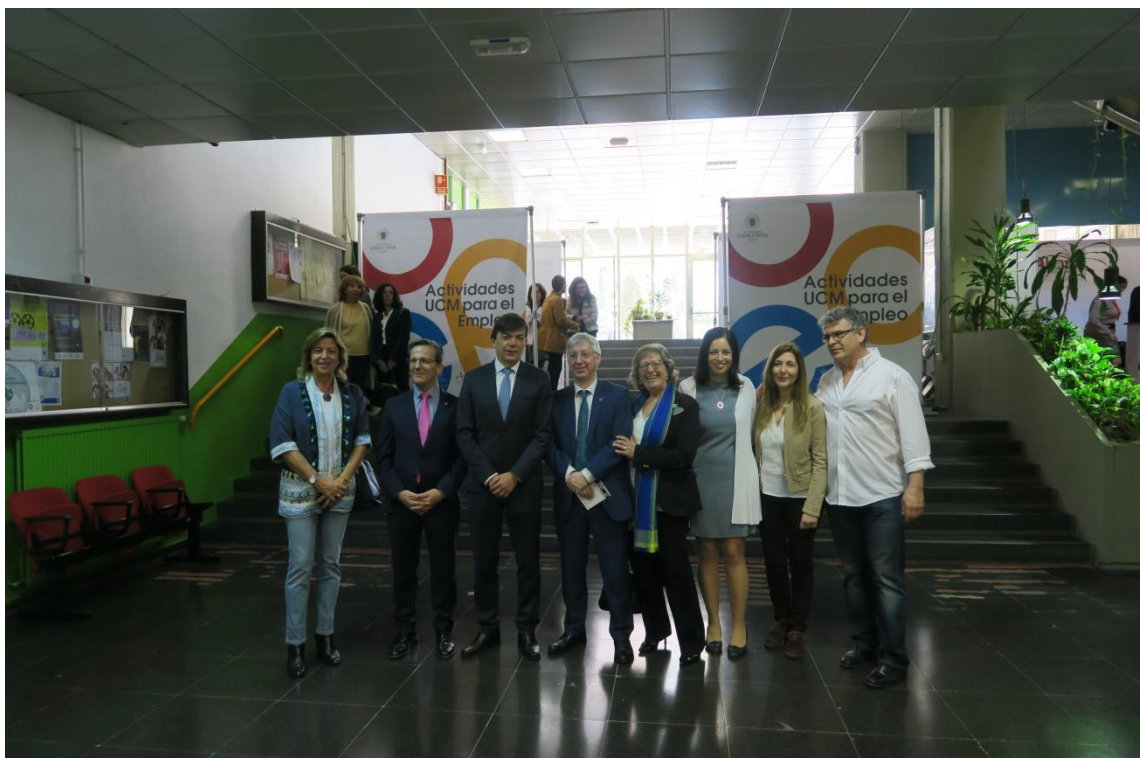
Fig. 4. Inauguración del I Foro UCM para el Empleo "Comunicación y Documentación" en la Facultad de Ciencias de la Información