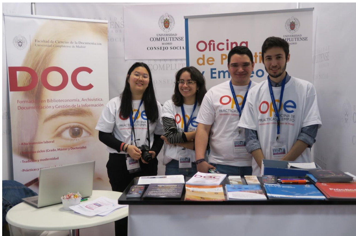
Fig. 6. Equipo de alumnos colaboradores en el stand de la Facultad de Ciencias de la Documentación / OPE