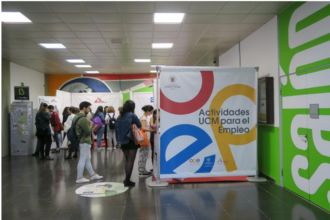
Fig. 5. I Foro UCM para el Empleo "Comunicación y Documentación". Facultad de Ciencias de la Información