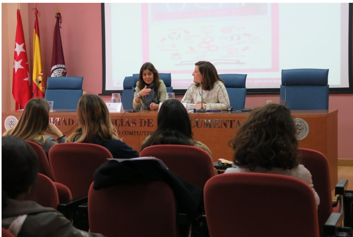
Fig. 1. II Jornada Salidas Profesionales y Emprendimiento en Documentación. Sala de Conferencias de la Facultad de Ciencias de la Documentación