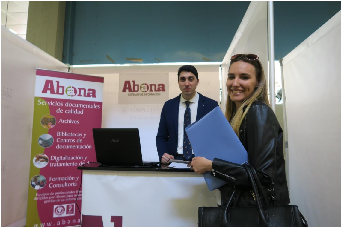
Fig. 9 y 10. Los alumnos solicitando información en los stands de las empresas Abana Servicios Documentales y Radiotelevisión Española