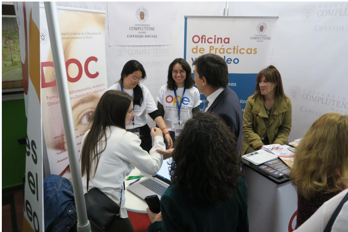
Fig. 7. El Rector de la UCM visitando nuestro stand