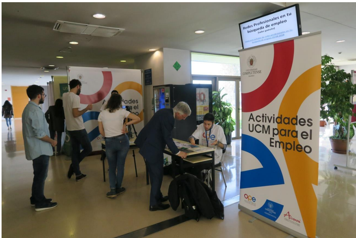
Fig. 8. El Decano de la Facultad de Ciencias de la Documentación visitando la zona de stands en el Aulario de la Facultad de Ciencias de la Información