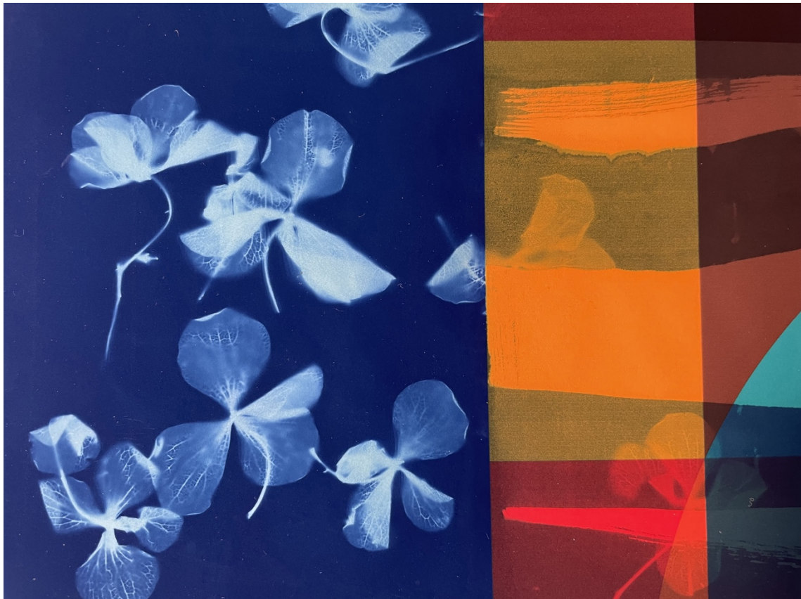
Fig. 1. Fusión de naturaleza y universo, en memoria de Daisaku Ikeda , Isabel Fernández Blanco, Cianotipia sobre impresión digital a color, 15 de noviembre 2023.

Por lo tanto, esta dificultad no solo está relacionada con el cambio climático o con los desastres naturales sino con restablecer de nuevo los límites para el respeto a la vida. Toda dificultad nos obliga hacer algo, sin esa dificultad no lo haríamos, y en este caso, se plantea la necesidad de reconocer que los límites del planeta son inseparables de nuestros propios límites. «Es importante poner freno a nuestros deseos, deseamos mucho, generalmente mal y a destiempo» 3 . Para poner límites es necesario reducir el ritmo y recuperar el tiempo donde el ser humano toma conciencia del mundo que le rodea, de su fragilidad, y, por tanto, de la de uno mismo.