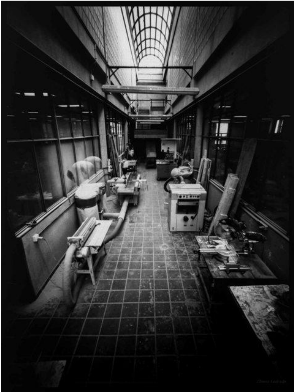
Taller de ebanistería. Facultad de Bellas Artes (100 minutos de exposición)