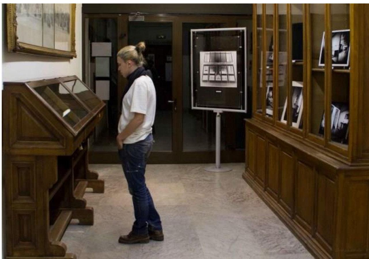
Vista general de la Sala de Exposiciones de la Biblioteca