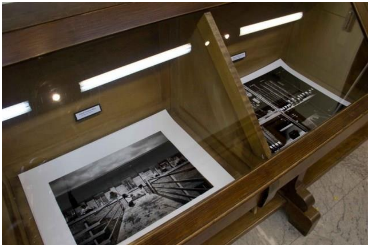
Izda. Pintando el paisaje (2 minutos de exposición) Dcha: Depósito de fondos de la Biblioteca (1620 minutos de exposición)