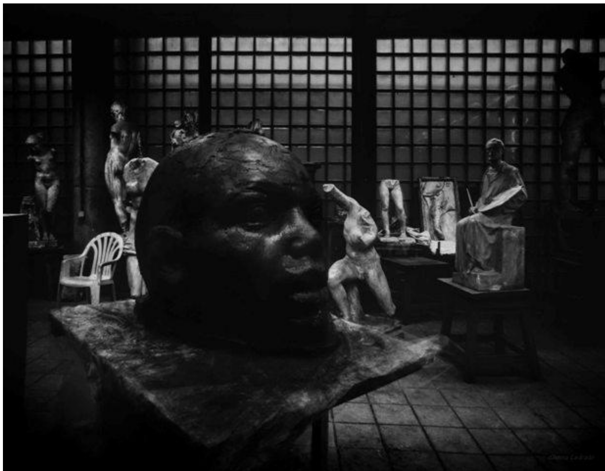
El proceso creativo. De la pella a su conclusión. Facultad de Bellas Artes (300 min. de exposición)