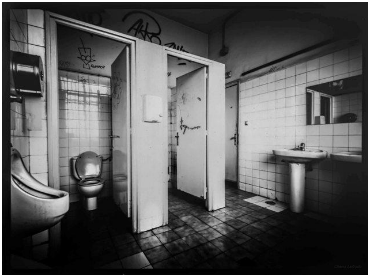
Excusado de la sexta. Facultad de Bellas Artes (12 minutos de exposición)