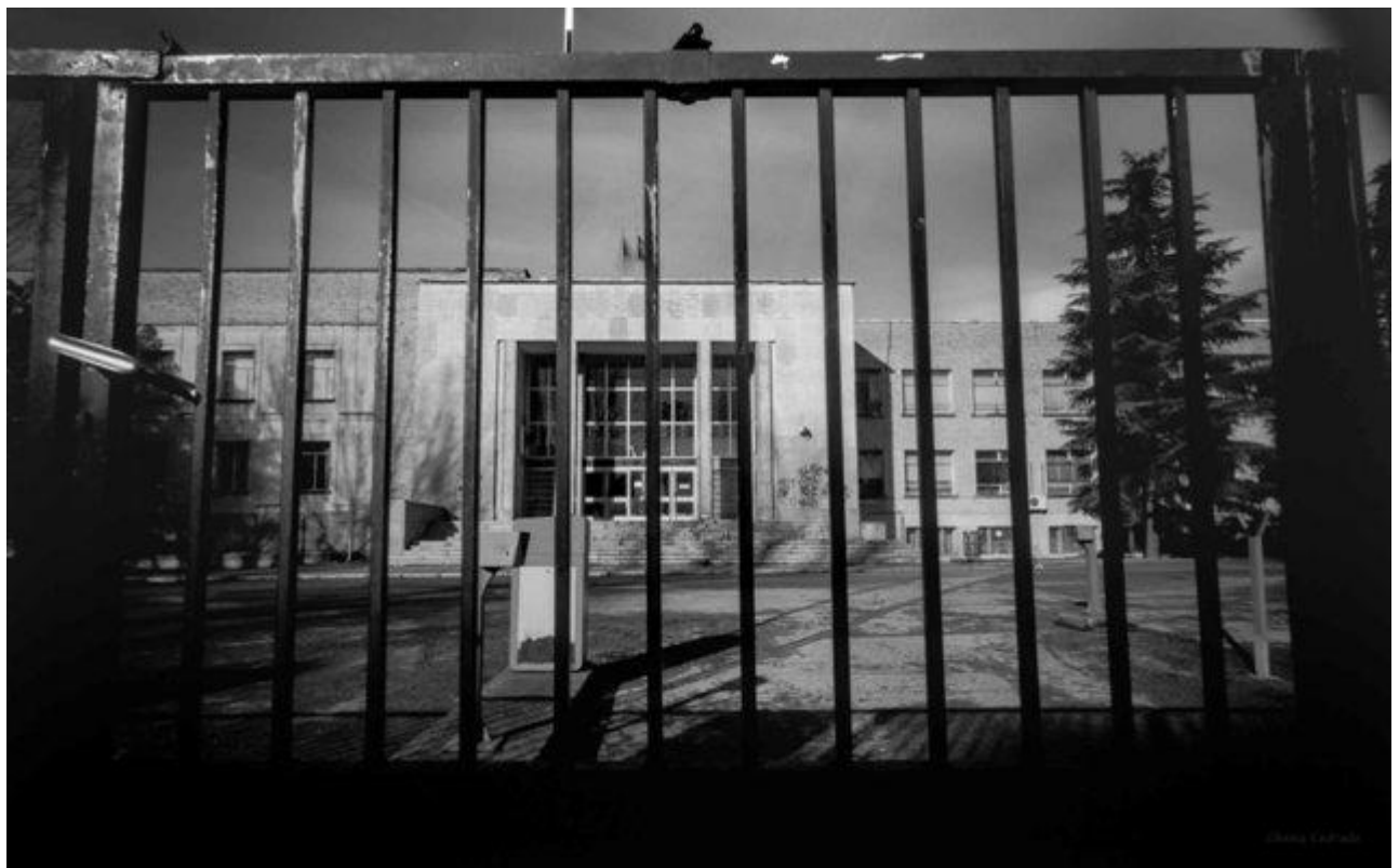
Cancela de la Facultad de Bellas Artes (12 minutos de exposición)