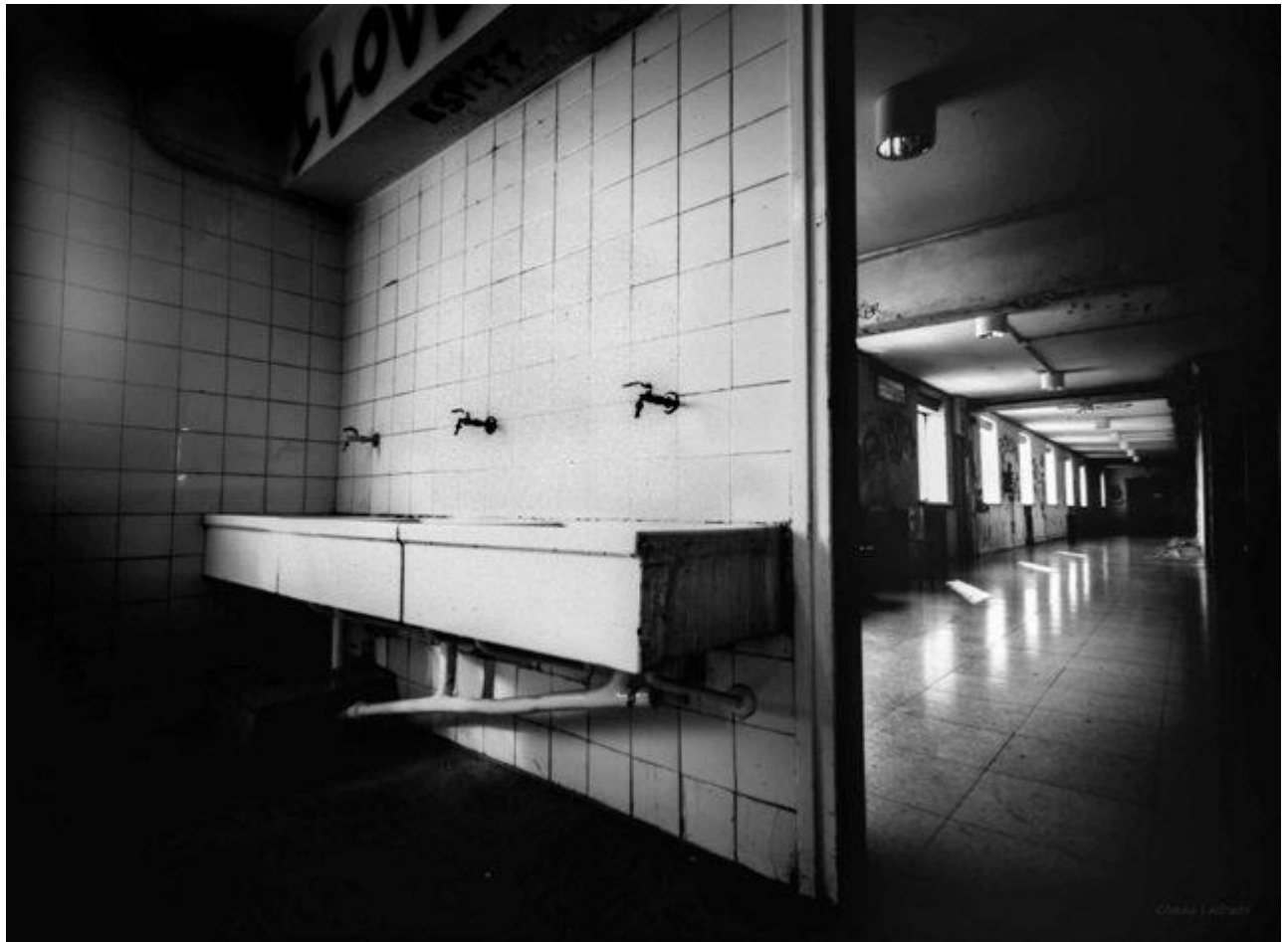
Lavabos y pasillo de la cuarta. Facultad de Bellas Artes (40 minutos de exposición)