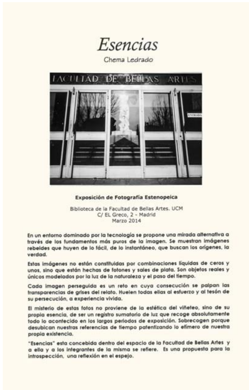
Cartela con texto de Chema Ledrado