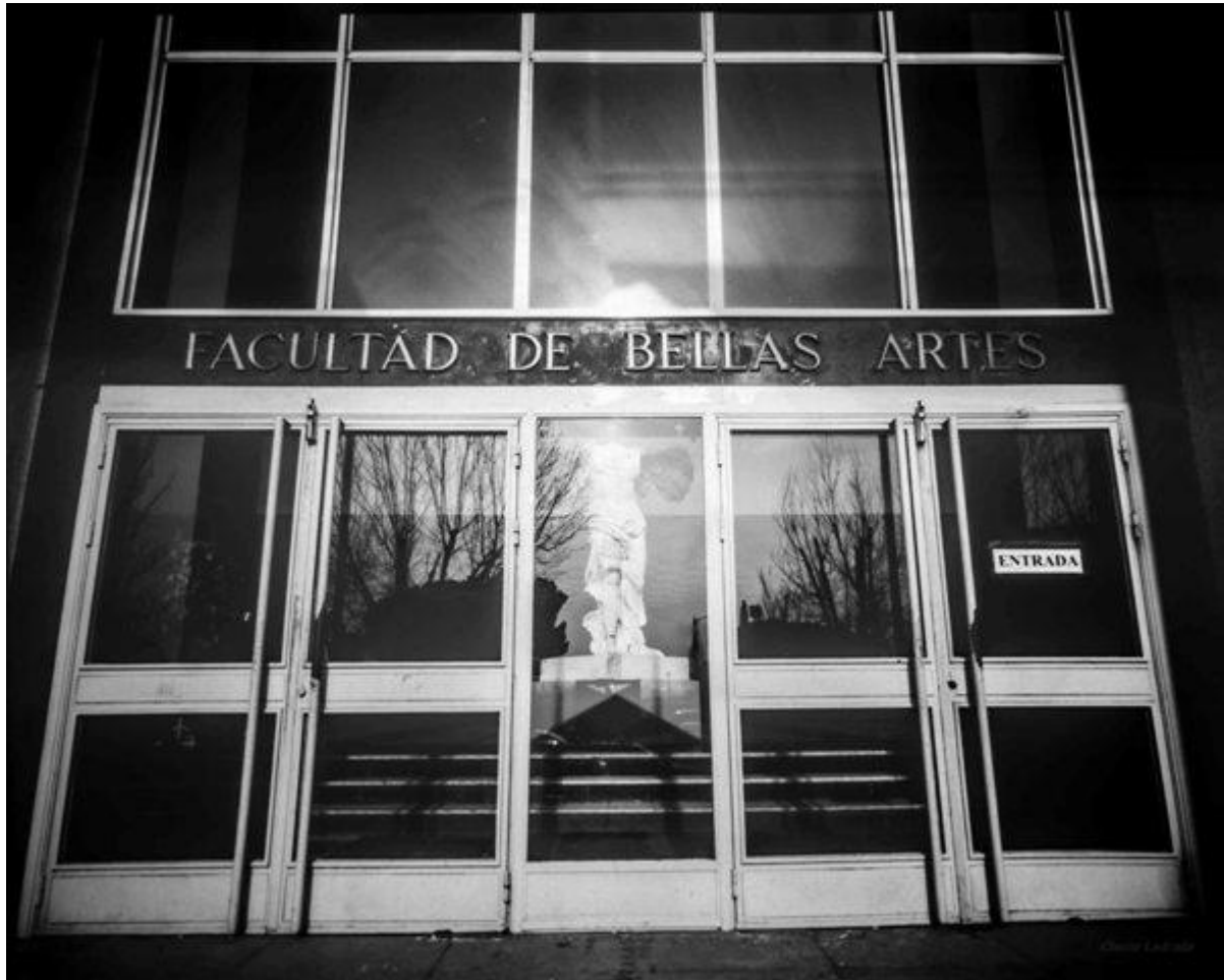
Puerta de la fachada principal de la Facultad de Bellas Artes (UCM) (4,5 minutos de exposición)