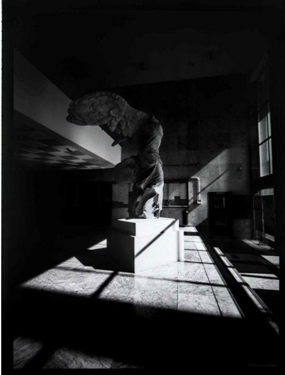
Victoria de Samotracia. Hall de la Facultad de Bellas Artes. 22 minutos de exposición