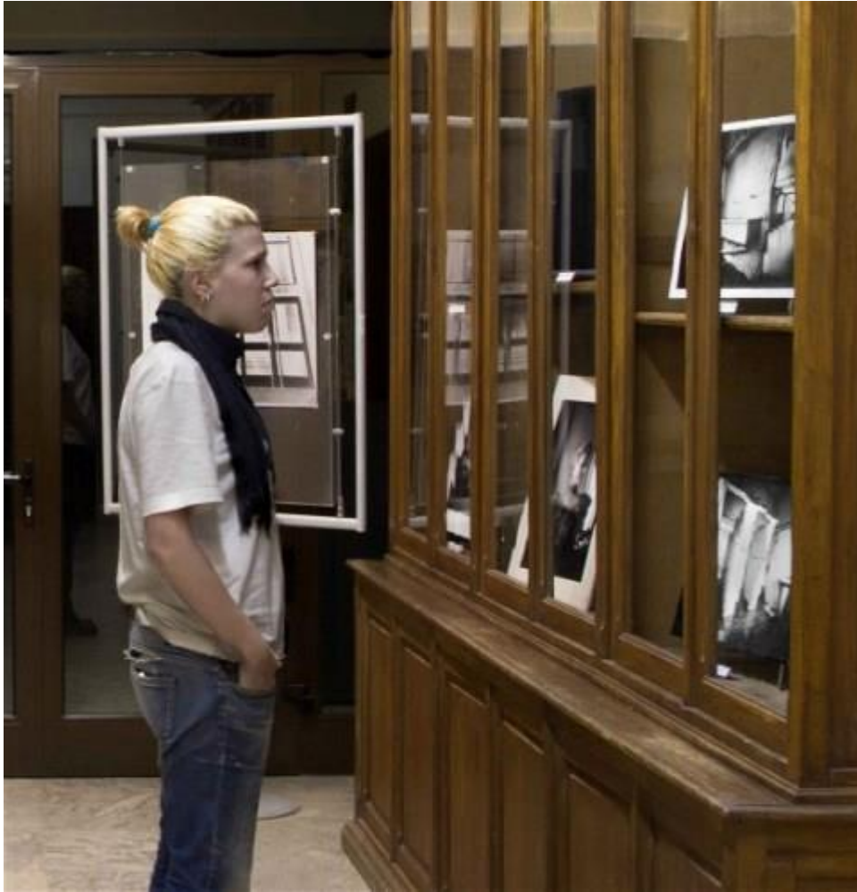
Vista general de la Sala de Exposiciones de la Biblioteca