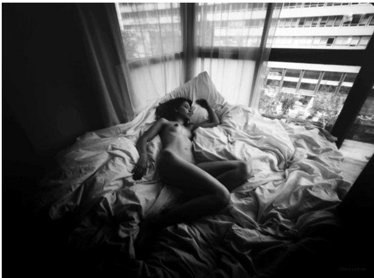
El sueño de Alicia (40 min. de exposición)