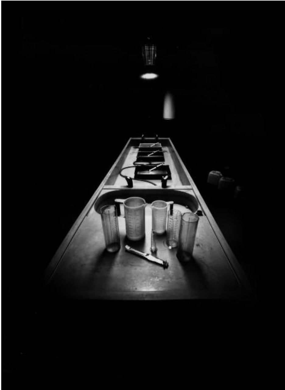
Pila de revelado. Facultad de Bellas Artes (255 minutos de exposición)