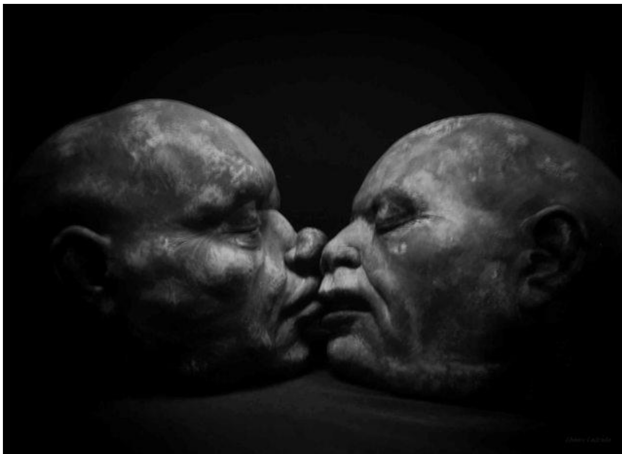
Creaciones de Rigoberto. Aula de Modelado. Facultad de Bellas Artes (1440 min. de exposición)