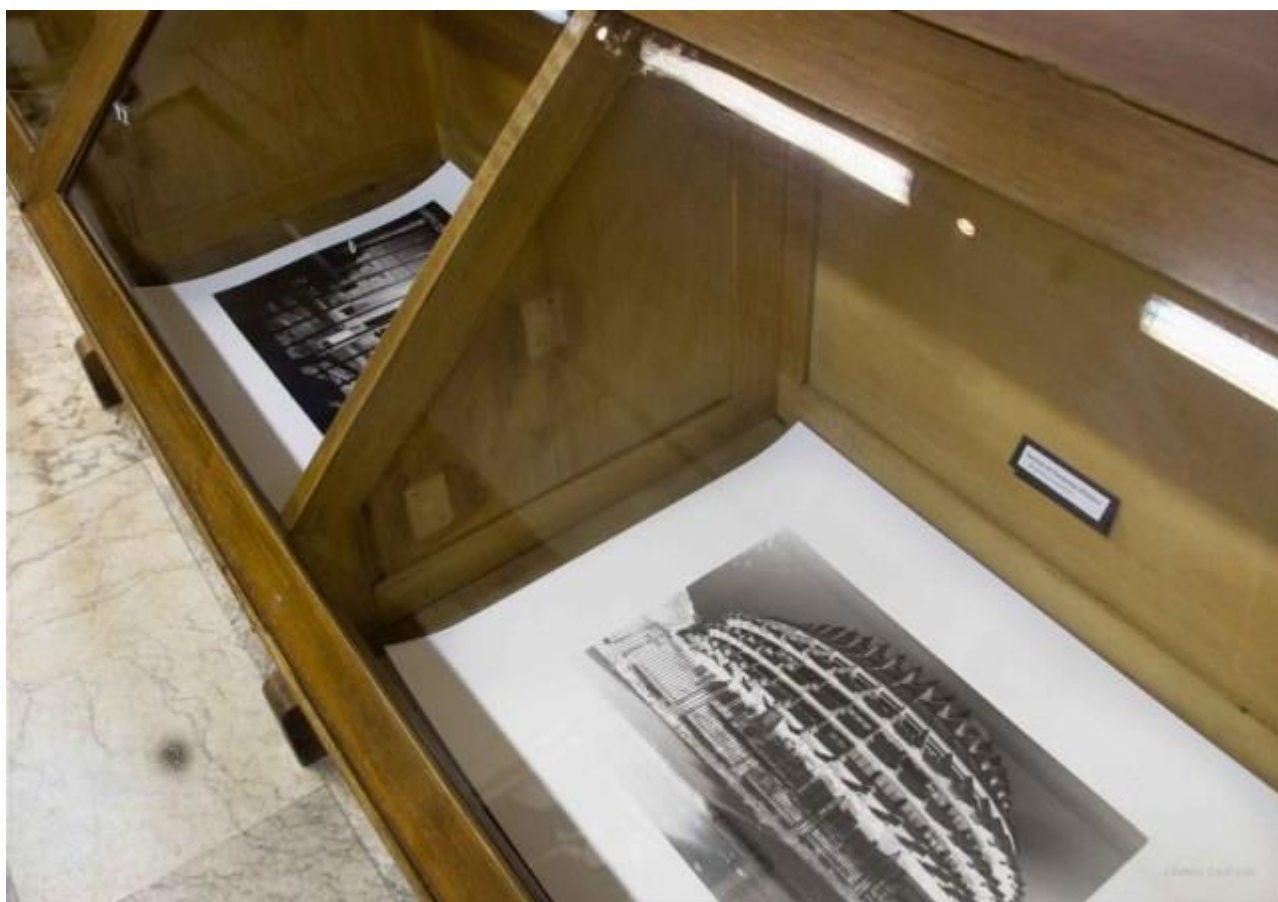
Edificio del Instituto del Patrimonio Histórico (4 minutos de exposición)