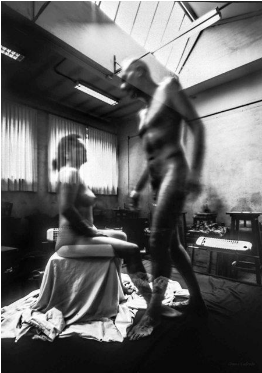
La pose. Aula de Modelado. Facultad de Bellas Artes (30 min. de exposición)