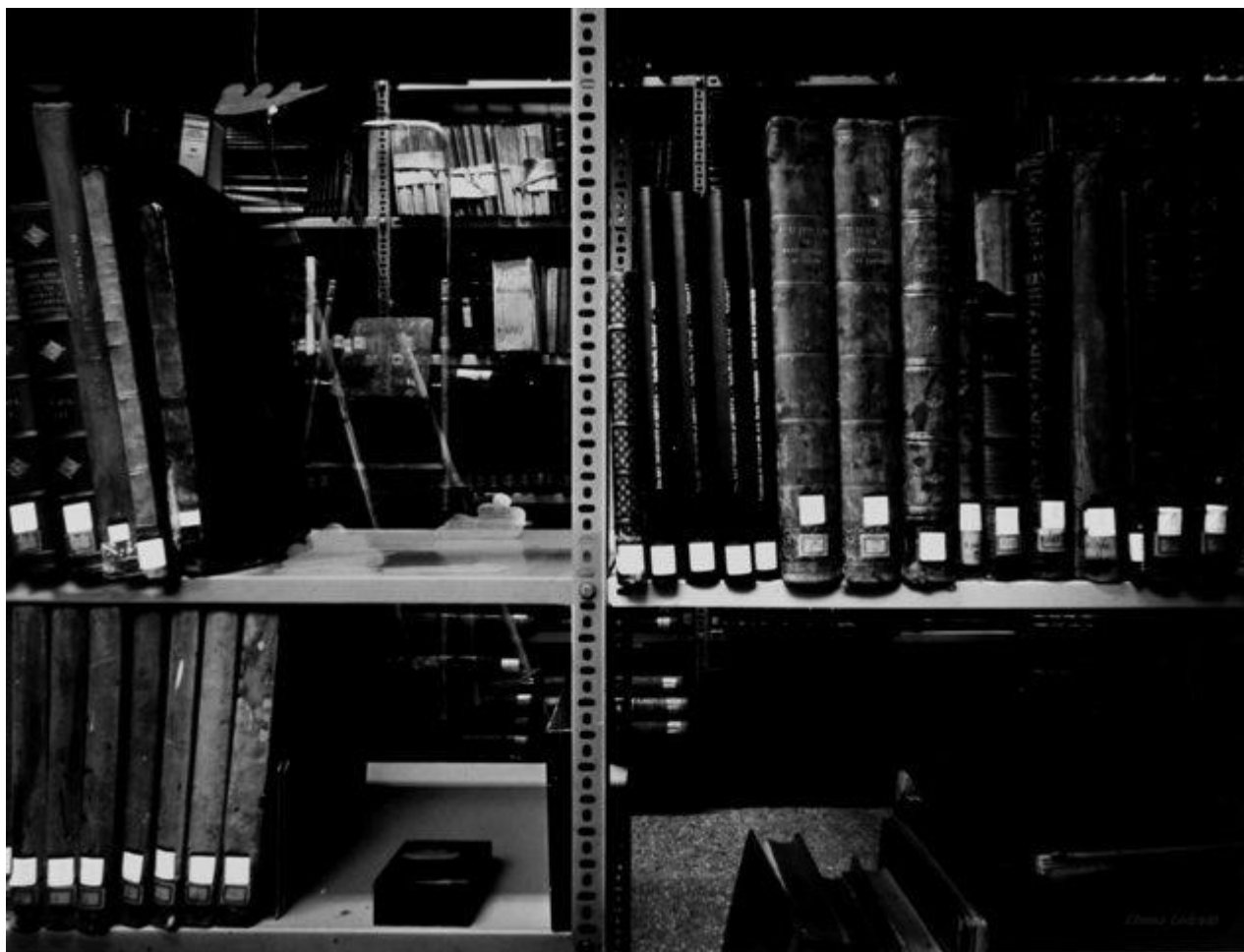
Fondos de la Biblioteca. Facultad de Bellas Artes (1620 min. de exposición)