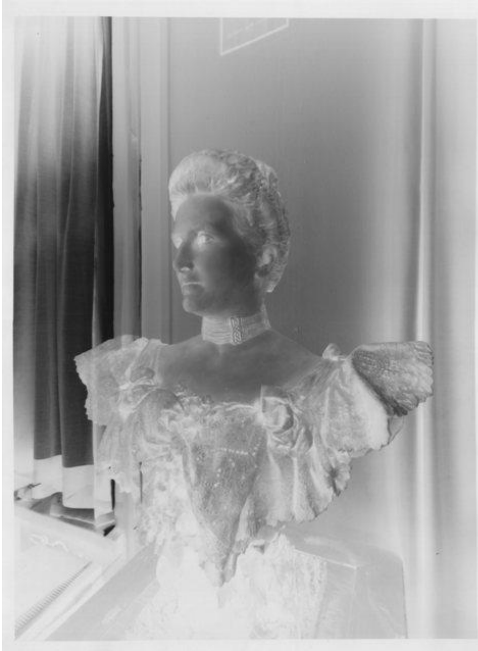
Mariano Benlliure. Dama de Luque (negativo). Biblioteca de la Facultad de Bellas Artes (100 minutos de exposición)