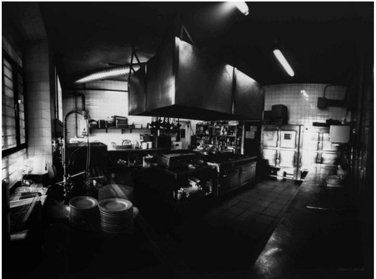
Cocinas de la Facultad de Bellas Artes (220 minutos de exposición)