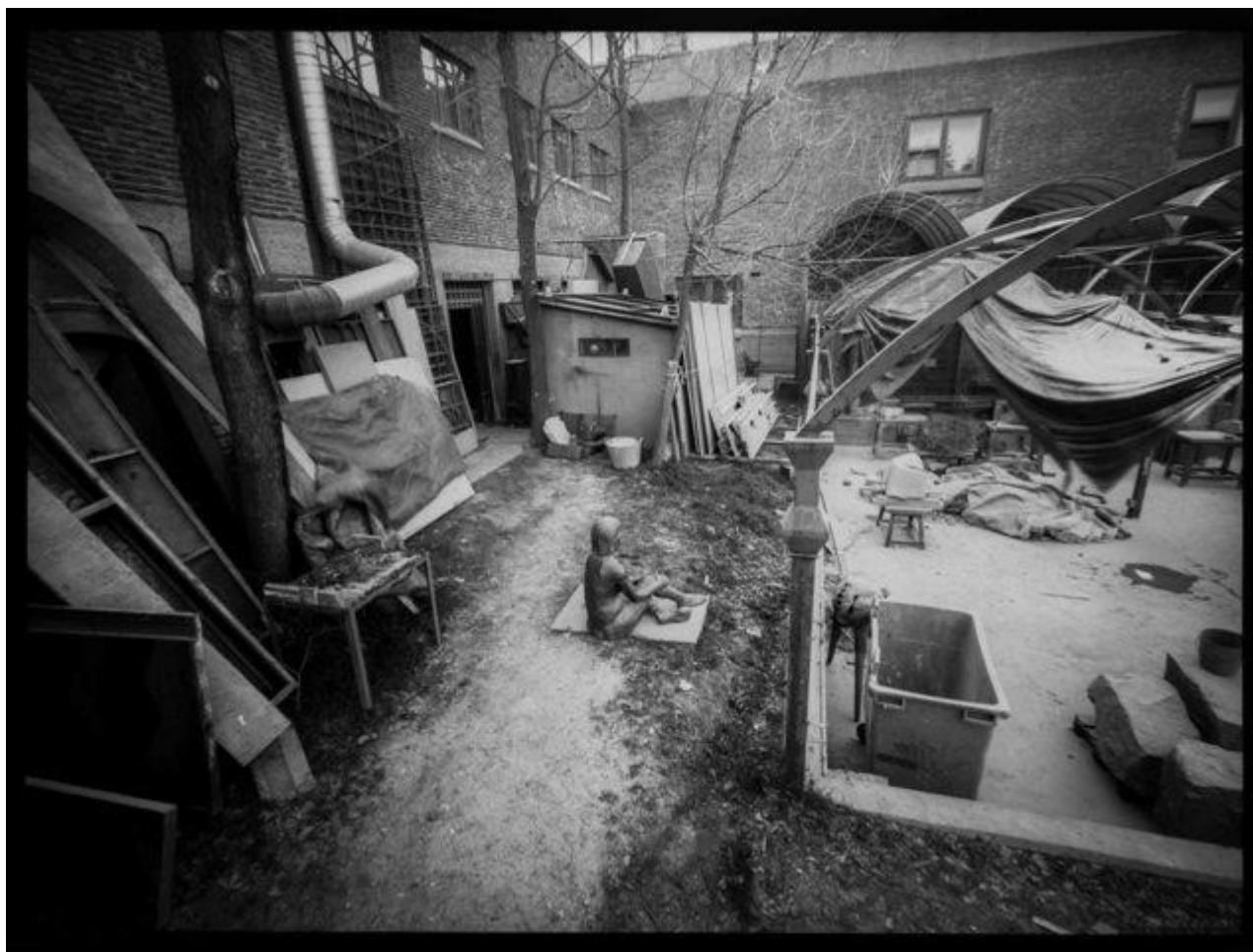
Patio de escultura. Facultad de Bellas Artes (8 minutos de exposición)