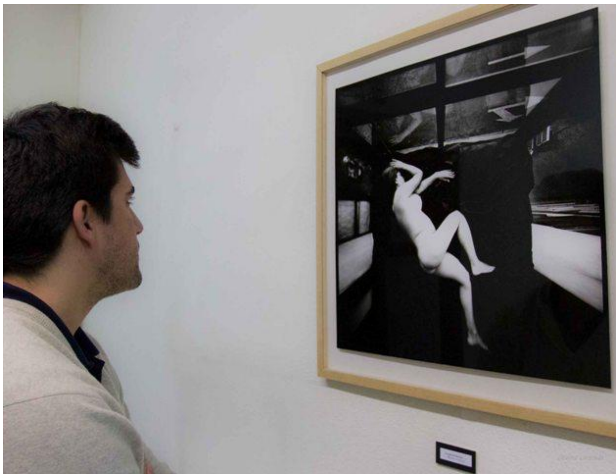
El sueño de Mercedes (40 min. de exposición)