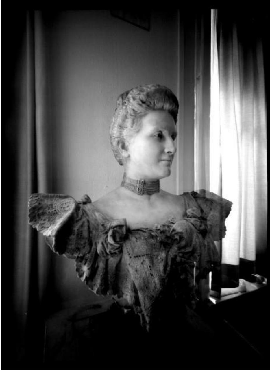
Mariano Benlliure. Dama de Luque . Biblioteca de la Facultad de Bellas Artes (100 minutos de exposición)