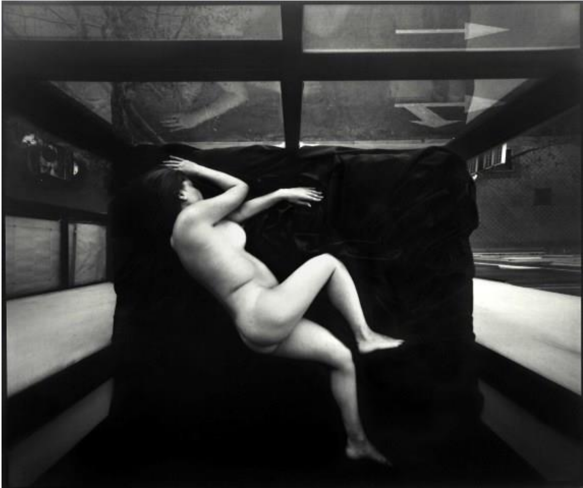
El sueño de Mercedes (40 min. de exposición)