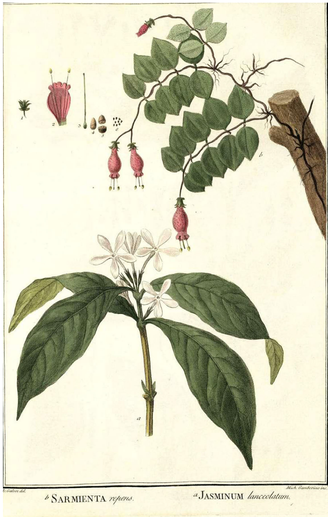
Fig. 2. Lámina de Sarmienta scandens (Molina ex J.D. Brandis) Pers. (b) [iconografía adicional en L. Feuillée, J. Obs. 2, tab. XLIII (1725) sub Urceolaria foliis carnosis scandens ; H. Ruiz & J.A. Pavón, Fl. Peruv. 1, lám. VIII (1798) sub S. repens ].