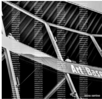
Figuras 1, 2, 3.

De forma que el modo en que somos vistos y observados se convierte en territorio fértil para la recodificación artística del binomio: libertad-espacio vigilado. Este último, un territorio, indefectiblemente urbano, donde la multiplicidad de pantallas y funciones parece haberse vuelto imprescindible: