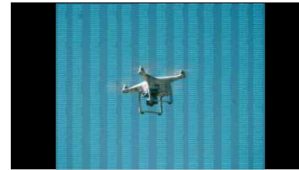
Figuras 4, 5, 6.

Cada código resulta de un programa que interpreta imagen de mapas de bits (imagen de píxeles) en código aritmético. Esta acción de recodificar a partir de un registro fotográfico digital y de un código numérico evidencia el carácter mutable del registro natural —sin manipular— y la variabilidad funcional —manipulación y alteración— del registro fotográfico por el cual las imágenes se vacían de la veracidad de su contenido. En resumen, con este proceso se busca explorar hasta dónde conduce la convivencia de lo analógico con lo digital e invertir, así, el comportamiento hostil de la vigilancia mediante la acción de la asimilación y la transformación, «devolverlo transformado para que ese medio se cambie a sí mismo». Cada una de estas fotografías, cuya apariencia anodina evoca la captura de imágenes por los sistemas de vigilancia