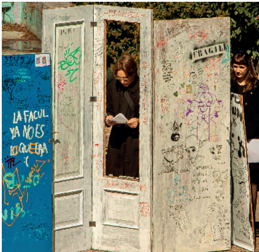
Figura 2. Se vela por la propuesta en el jardín de la facultad de Bellas Artes de la UCM, Madrid. 2022. Fotografía creada por los alumnos participantes de la propuesta artística. el título de la imagen, el medio, el año de creación, la fuente

Paralelamente, se ritualiza el momento del entierro, llevando a cabo diferentes acciones performativas en colectivo que abarquen las distintas etapas del Duelo, teniendo como primer lugar velar el cadáver en el jardín de la facultad, leyendo un manifiesto en relación a lo que supone la acción/performance. Todo ello se registra documentalmente para dotar la propuesta de una conmemoración expositiva a posteriori.