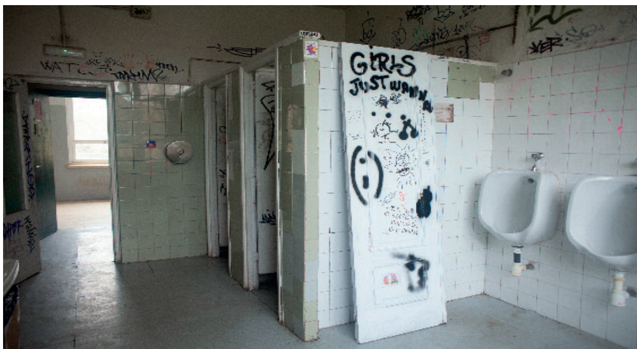
Figura 1. Fotografía de las puertas del baño de la facultad de bellas artes de la UCM, Madrid. 2022. Fotografía creada por los alumnos participantes de la propuesta artística. el título de la imagen, el medio, el año de creación, la fuente

Desde el alumnado de la Facultad de Bellas Artes de la Universidad Complutense, y bajo la coordinación del Departamento de Escultura y Formación Artística, se ha llevado a cabo una propuesta con la que participar en el proyecto artístico “Museo Mausoleo”. Se plantea, a través de la creación colectiva coordinada por estudiantes de la asignatura “Artista, Creatividad y Educación” una intervención que refleja la identidad plural y la idiosincrasia propia del centro. Por ello, atendiendo a esta motivación, se han intentado analizar los elementos más característicos de ello, y se ha concluido que estos aspectos quedaban registrados de forma orgánica en las puertas de los servicios -wc- de la facultad de bellas artes de la Universidad Complutense de Madrid. Se quiere “repensar” el espacio del baño como ese lienzo en blanco, como ese espacio en donde las pintadas -détournements- de los alumnos que se han ido realizando a lo largo de la historia de la facultad; una historiografía que ha ido recogiendo reivindicaciones que aluden a la sociedad, a la propia universidad, a las emociones y los sentimientos, a ese espacio del pensamiento. Reflexiones y escrituras que recogen, desde la crítica, desde el humor y de lo personal lo creativo en su estadio más prístino, sin necesidades conceptuales extravagantes.