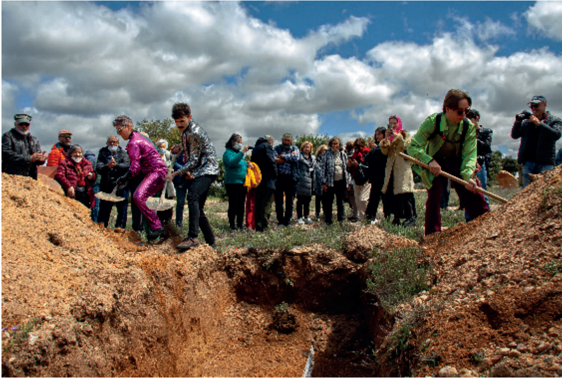
Figura 3. Los performers entierran la obra. 2022. Fotografía creada por los alumnos participantes de la propuesta artística. el título de la imagen, el medio, el año de creación, la fuente