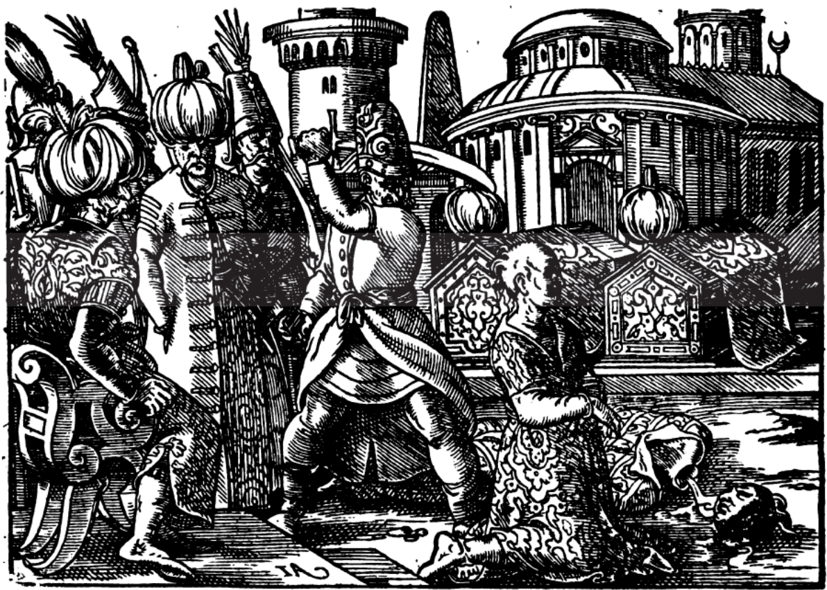
(Figura 11) Chronicorum Turcicorum (1578)