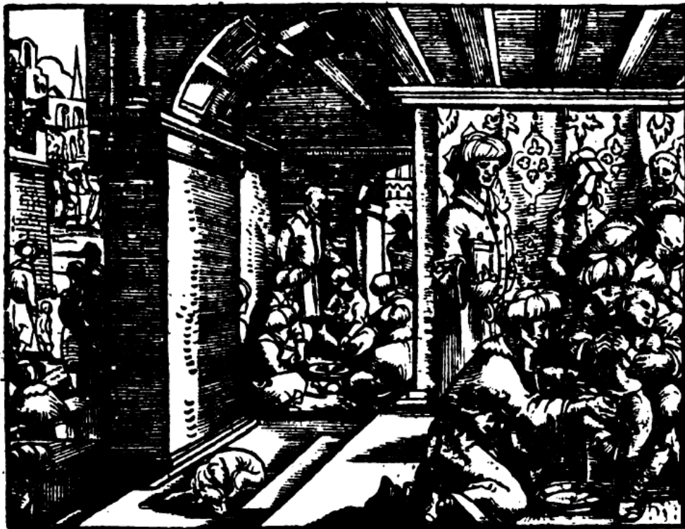
(Figura 3) De Circvmcisione Tvrcarvm, Chronicorum Turcicorum (1578)