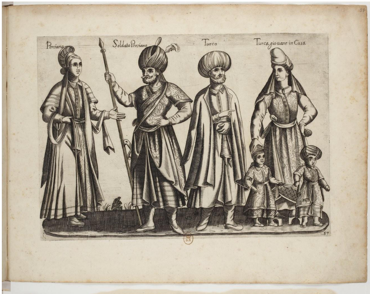
(Figura 10) Persiana, Soldato Persiano, Turco, Turca giouane in Casa, Recueil de costumes étrangers (1581)