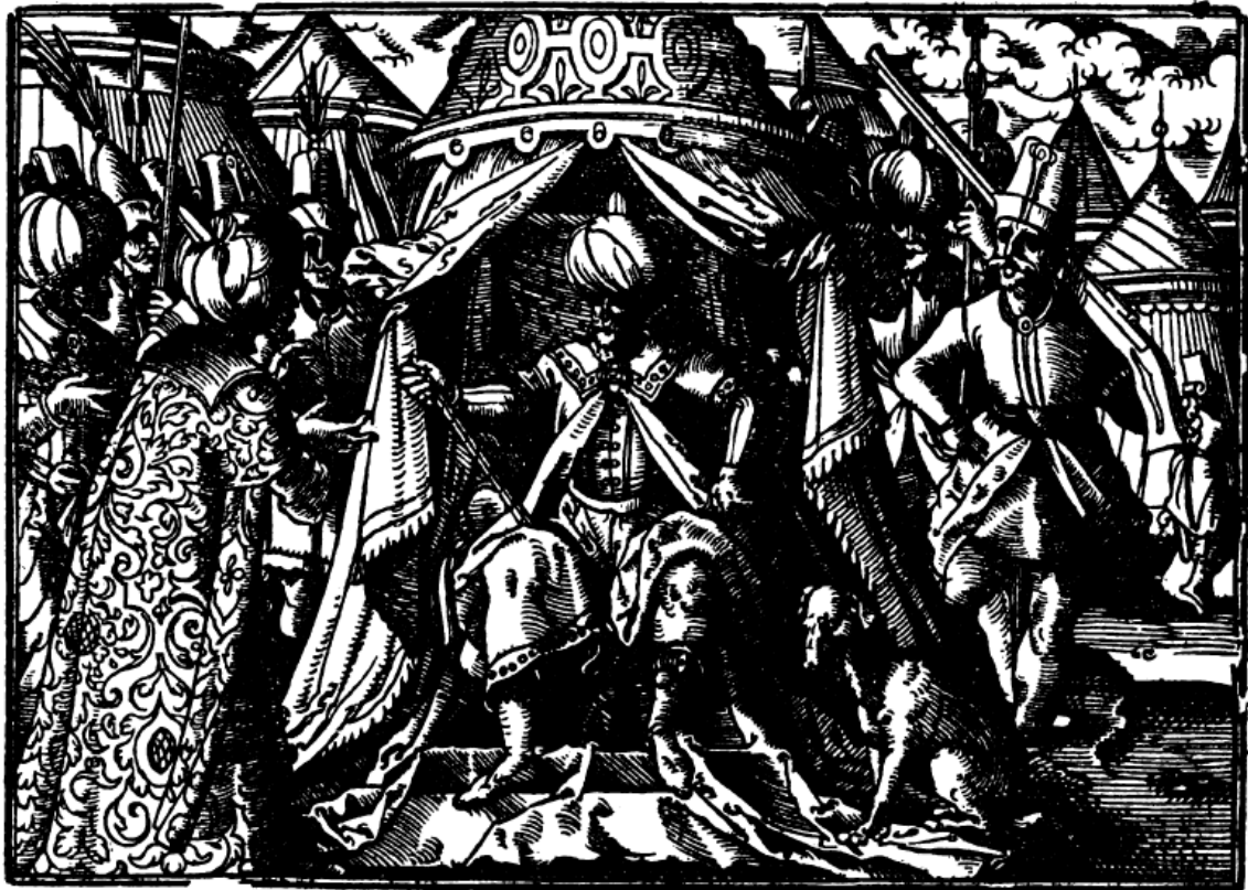
(Figura 5) Chronicorum Turcicorum (1578)