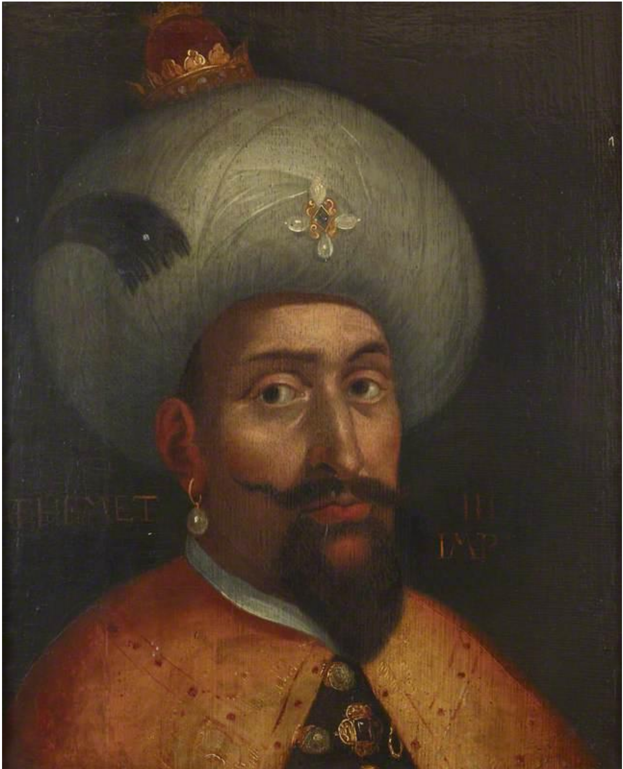
(Figura 12) Mehemet, III. Imp. Colección Anglesey Abbey, Cambridgeshire