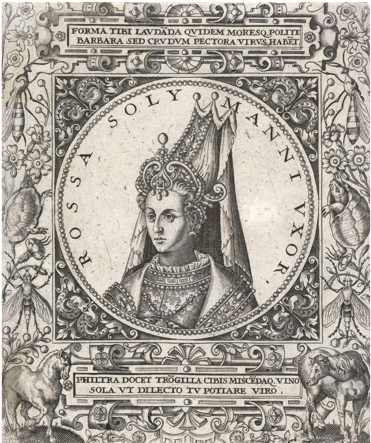
(Figura 9) Rossa Solymanni Vxor , Johann Theodor de Bry (1596). Rijksmuseum, Amsterdam