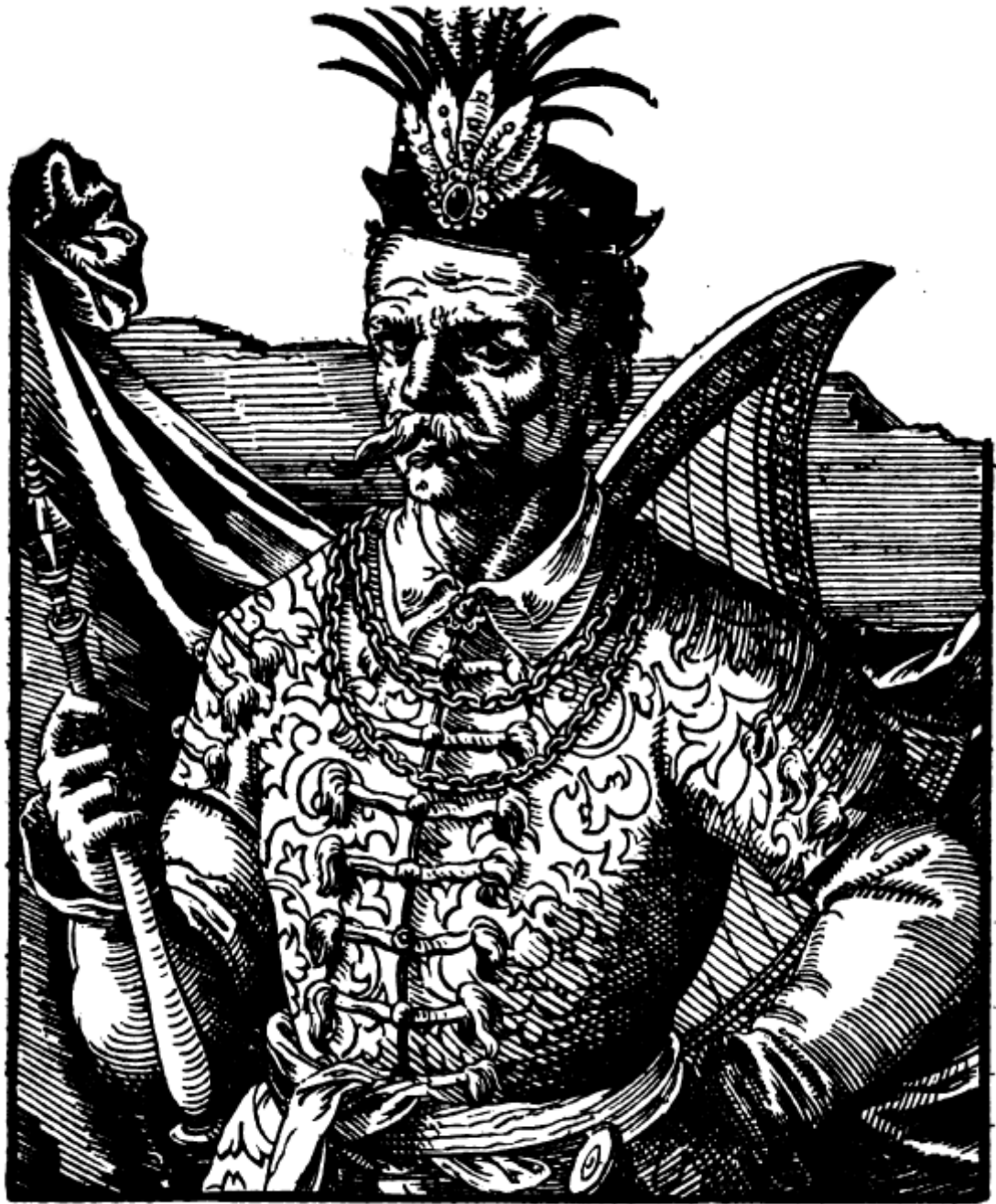
(Figura 14) Scanderbegi, Chronicorum Turcicorum (1578)