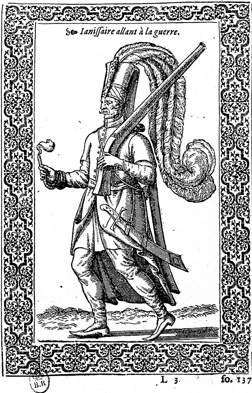
(Figura 16) Janissaire allant à la guerre, Illustrations de Les navigations, pérégrinations et voyages faicts en la Turquie (1576-7)