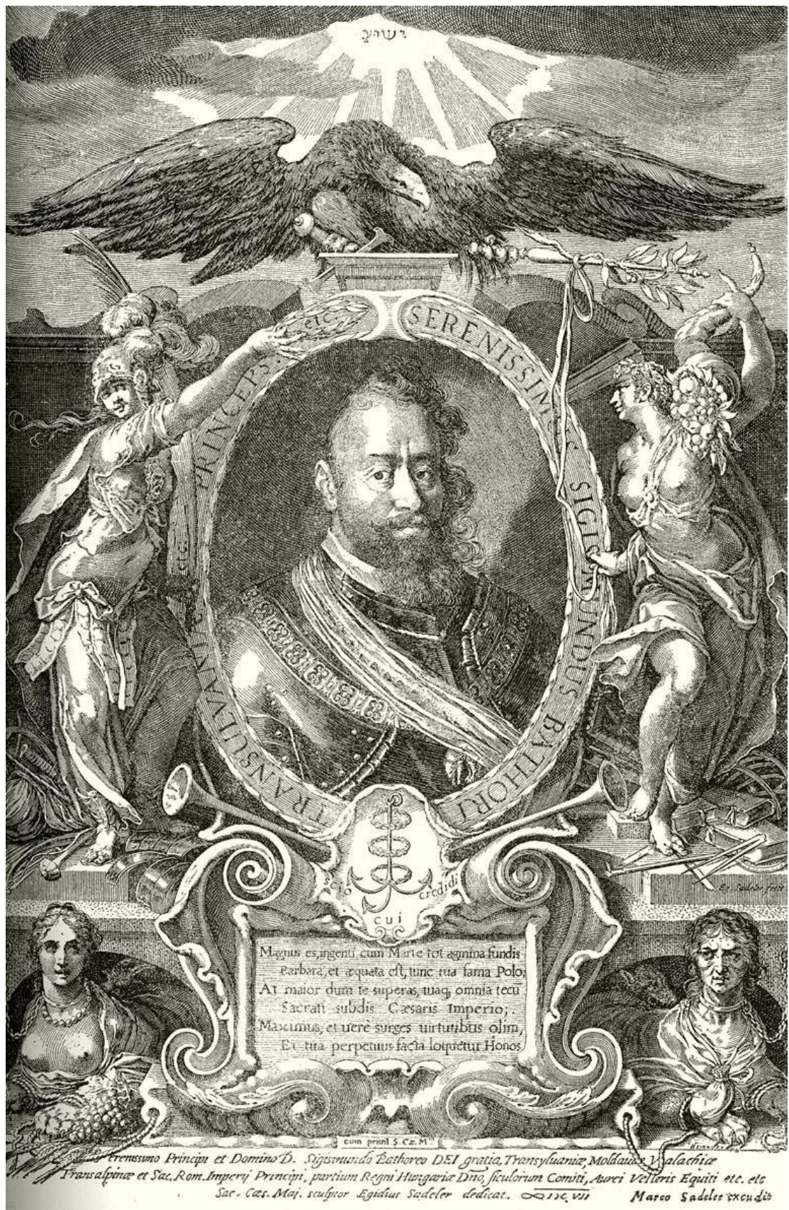
(Figura 13) Serenissimo Principi et Domino D. Sigismundo Bathoreo