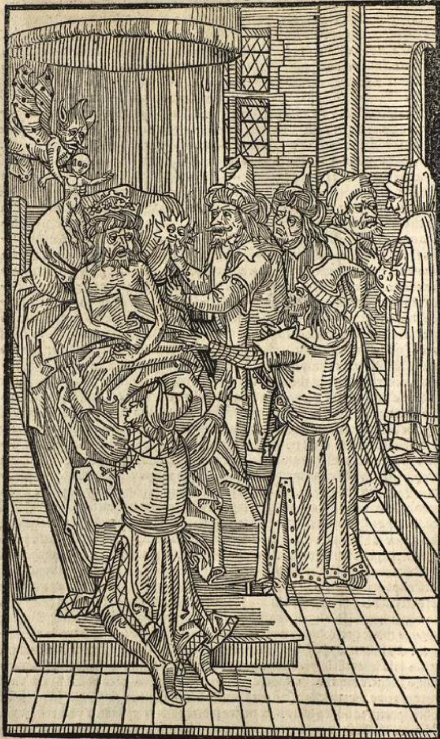
(Figura 4) Guillelmi Caoursin, Obsidionis Rhodiae Urbis Descriptio (1496)