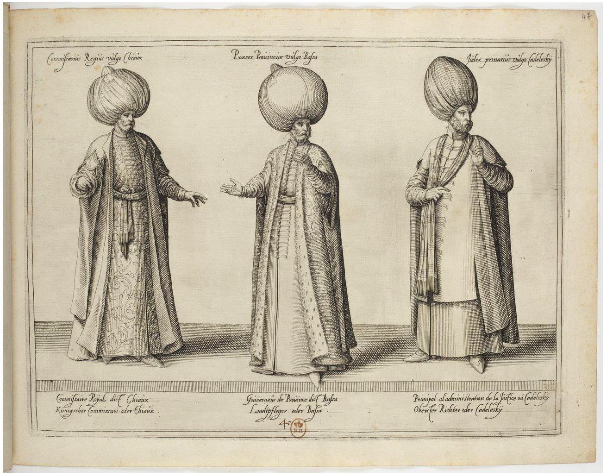
(Figura 7) Chiaux, Bassa, Cadelesky, Habitus variarum orbis gentium (1581)