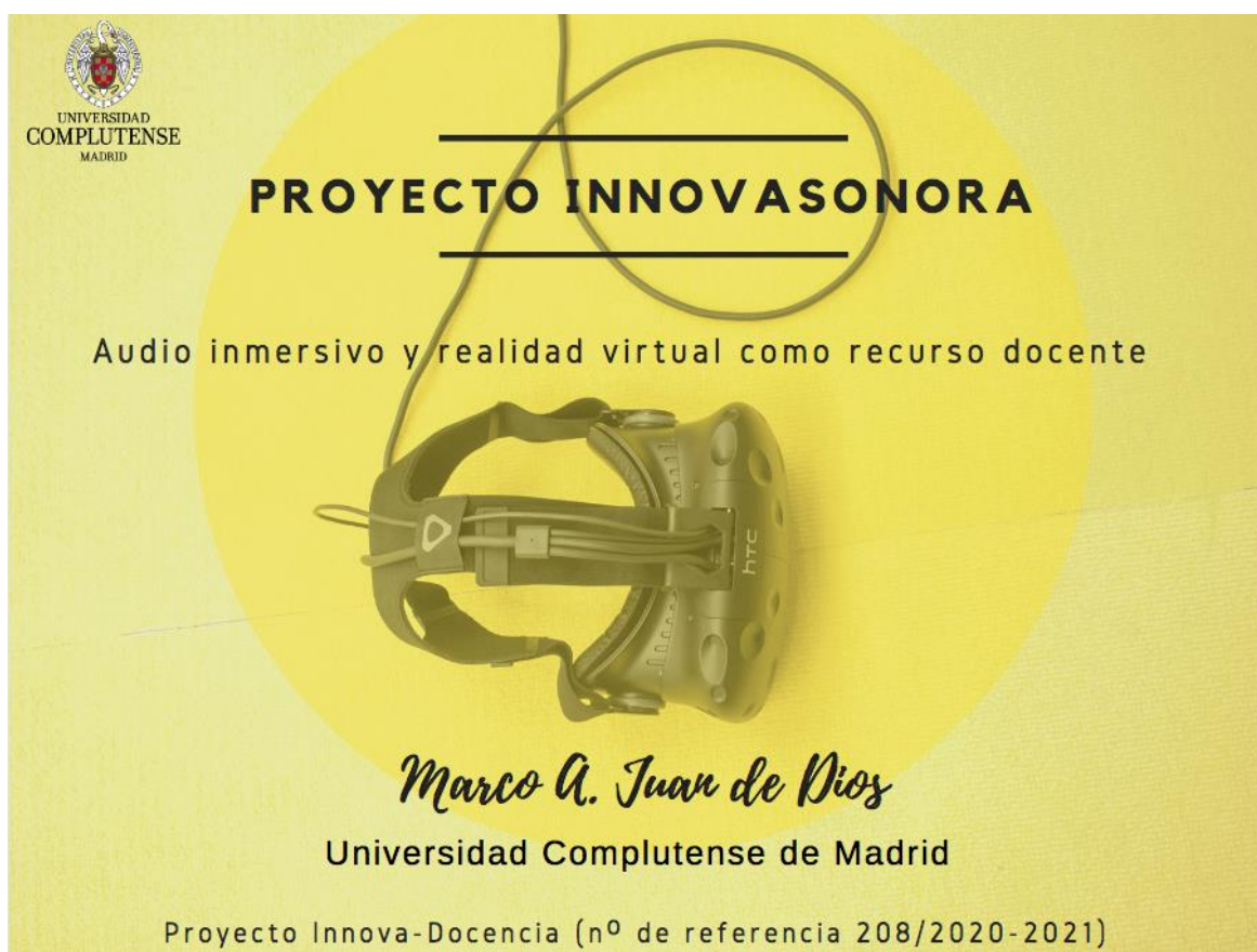
Ilustración 1: Portada del seminario desarrollado en Google Meet sobre audio inmersivo el 15 de diciembre de 2020

Durante el primer cuatrimestre, se desarrolló un primer seminario online relacionado con las actividades del proyecto y la evolución histórica de los sistemas de escucha, desde el mono al sonido inmersivo actual. Esta jornada fue dirigida por el coordinador del proyecto y contó con la participación activa de una amplia mayoría de los miembros del proyecto.