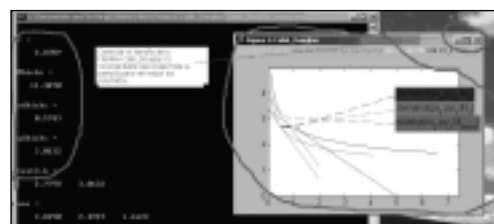
Figura 2. Ejemplo de Ejecución del programa y resultados