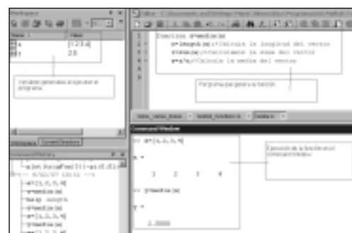
Figura 5. Ejemplo de la programación y su utilidad didáctica