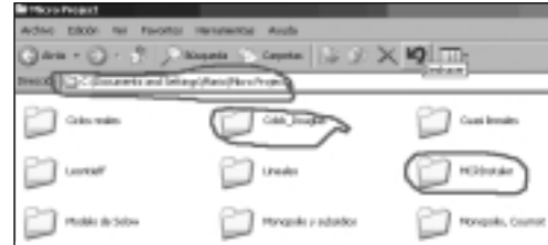
Figura 4. Ejemplo de Instalación de programas ejecutables

El segundo complemento fundamental del proyecto es un manual de uso y un programa formativo de resolución y cálculo de los mo-