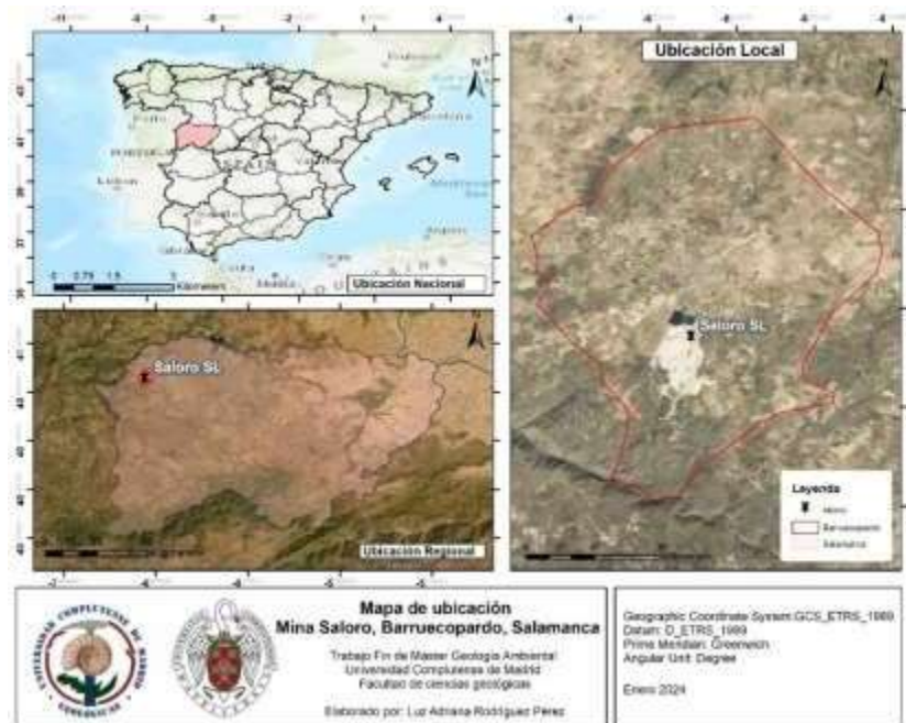
Figura 1 . Mapa de ubicación geográfica de la Mina Saloro

El proyecto minero de SALORO se localiza a 2.5 km del municipio de Barruecopardo, en la provincia de Salamanca (España). Está ubicada al noroeste de la provincia de Salamanca y hace parte del Permiso de Investigación Saldeana y administrativamente, la zona de estudio hace parte del partido judicial del municipio de Vitigudino(Saloro SLU, 2019).