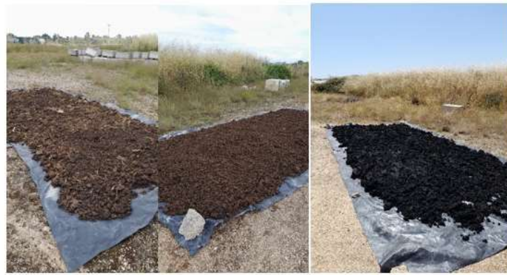
Figura 3 Proceso de secado de los materiales orgánicos con humedad.

Los materiales fueron dispuestos en una zona de acopio. Los estiércoles y lodos de depuradora fueron extendidos sobre una cubierta de plástico para proporcionar el secado del material, se dejaron a la intemperie alrededor de 4 días. Pasados los días fueron recolectado nuevamente y dispuestos en bolsas big bag.