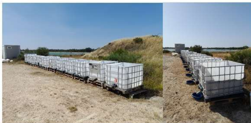
Figura 2 Ubicación espacial de los contenedores (GRG).

Cada uno de los contenedores (GRG) contaba con un sistema de cobertura de salida en la parte inferior, que permitía la captación diaria de los lixiviados. Los GRG's fueron ubicados secuencialmente en línea recta, siguiendo la secuencia numérica del 1 al 12, puestos sobre estivas de madera y aplicando una breve inclinación para facilitar el desagüe y la recolección de los lixiviados.