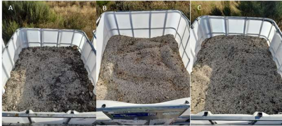
Figura 5. Mezclas realizadas. Imagen A corresponde a la M2, la imagen B corresponde a la M12, la imagen C a la M8.

Logrando la máxima homogenización de todos los materiales, se depositaron las muestras en los GRG's que fueron debidamente rotulados para la correcta identificación y monitoreo de las mezclas.