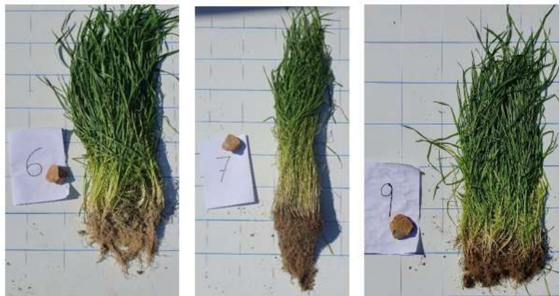
Figura 6 Muestra vegetación

En la semana 10 se tomaron muestras parciales del centeno de la zona central del GRG, considerando que en los bordes al ser traslucido el contenedor puede influir en el desarrollo radicular. La muestra inicial fue pesada en su totalidad, Posteriormente, las plantas fueron limpiadas, retirando parte del suelo adherido a las raíces, esto con el objetivo de pesar y medir el crecimiento aéreo y radicular con mayor precisión.