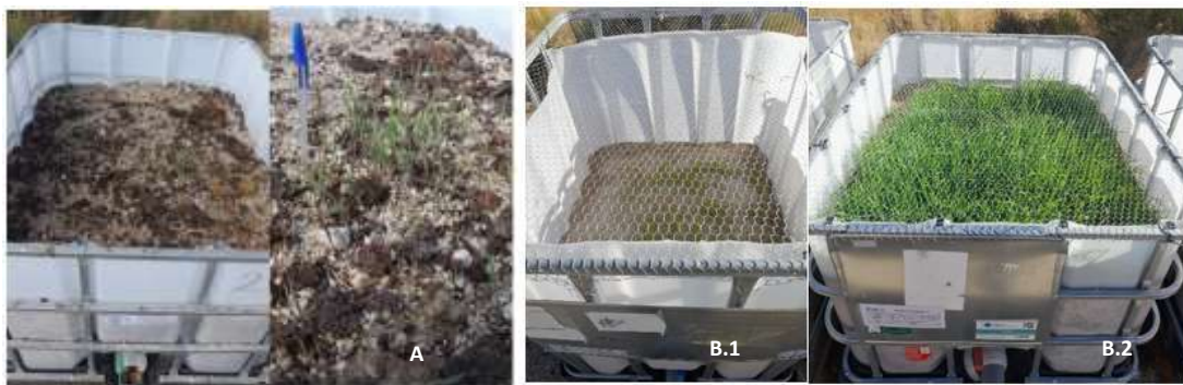
Figura 9 Crecimiento vegetal en las muestras M1 Y M2

La figura 9A ilustra el crecimiento vegetal de la M2 después de la primera semana de la siembra de centeno. En cuanto a las figuras 9B1 y 9B2, representan el desarrollo vegetal después de un mes desde la siembra para las mezclas M1 y M2, respectivamente. Se aprecia claramente que la incorporación de enmiendas ha desempeñado un papel crucial en la mejora del sustrato, facilitando notablemente el desarrollo de la cobertura vegetal en ambas mezclas.