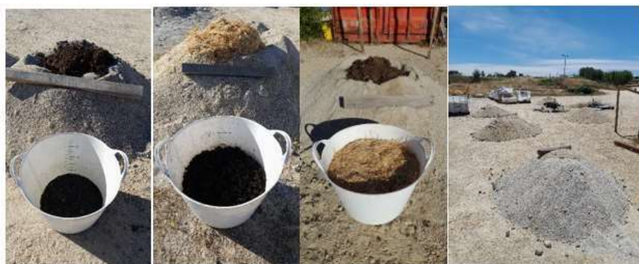
Figura 4 Proceso de elaboración de las mezclas.

Se emplearon cubos de 42 litros y se hicieron montículos en el terreno para facilitar la integración de todos los materiales. Para lograr una mejor homogenización de las mezclas se empleó una motoazada.