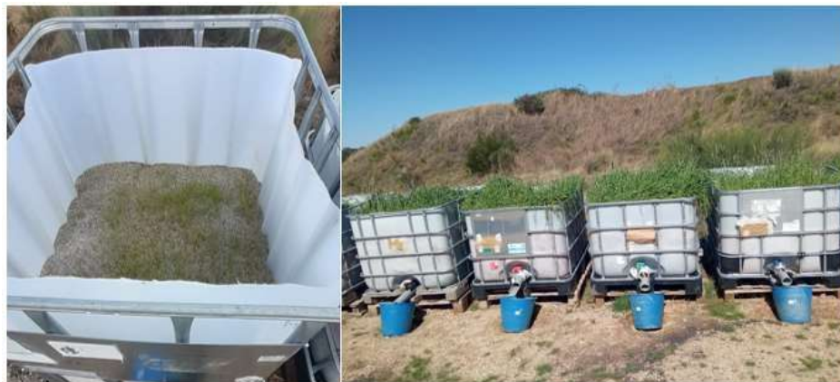
Figura 10 Crecimiento vegetal pasado 2 meses. Izquierda mezcla M1, derecha varias mezclas.

Pasados dos meses desde la plantación se observó un gran crecimiento en todas las mezclas con excepción de la muestra control M1, como se muestra a continuación.