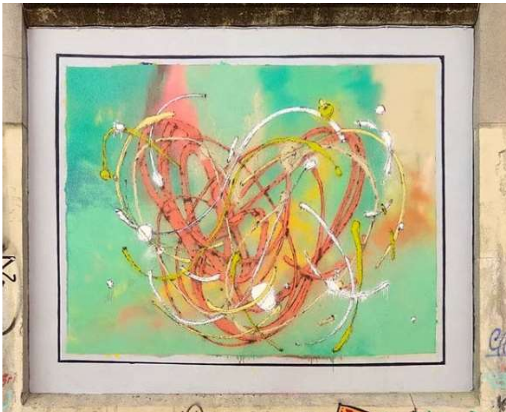
IMAGEN 5. Son3k. Lavapiés, Madrid. 2019.

La abstracción es otra de las corrientes artísticas que ha tenido presencia en la ciudad desde los inicios de este fenómeno. Eltono hizo mutar el diapasón que utilizaba como icono identitario hasta transformarlo en unas bellas geometrías herederas de la abstracción geométrica de Piet Mondrian. Por su parte, Nuria Mora combinaba la pureza de la geometría con decoraciones florales.