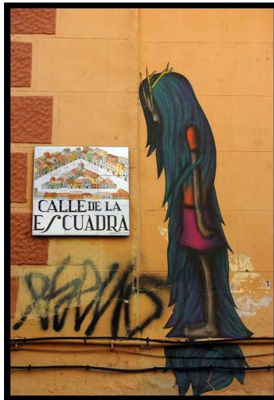
IMAGEN 8. Chylo. Lavapiés, Madrid. 2011

Otros artistas han preferido la estética del Surrealismo, recreando lugares de seres extraños en atmósferas oníricas. El ejemplo mas conocido es el caso de Okuda que, como se mencionaba en este artículo, combina su estética Pop con mundos mágicos extraídos del subconsciente. A destacar también el caso de Chylo, que, en una entrevista con la revista DUENDEMAD, describió de la siguiente manera lo que desea transmitir con sus obras: