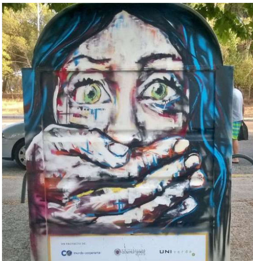
IMAGEN 4. Trata de blancas. Ze Carrion. Madrid. 2015.

El Expresionismo figurativo sigue una de las principales corrientes artísticas del arte contemporáneo. Además de a Suso33, se podrían encuadrar en esta línea los artistas: C215, Borondo, Jimena AT, Casasola, Ze Carrion y Taquen. No es de extrañar que esta corriente tenga una especial relevancia ya que, por un lado, sigue una de las principales tendencias del arte más actual (indagación por el cuerpo humano) y, por otro, responde a una de las principales preocupaciones del arte urbano desde su origen: la presencia humana en la ciudad.