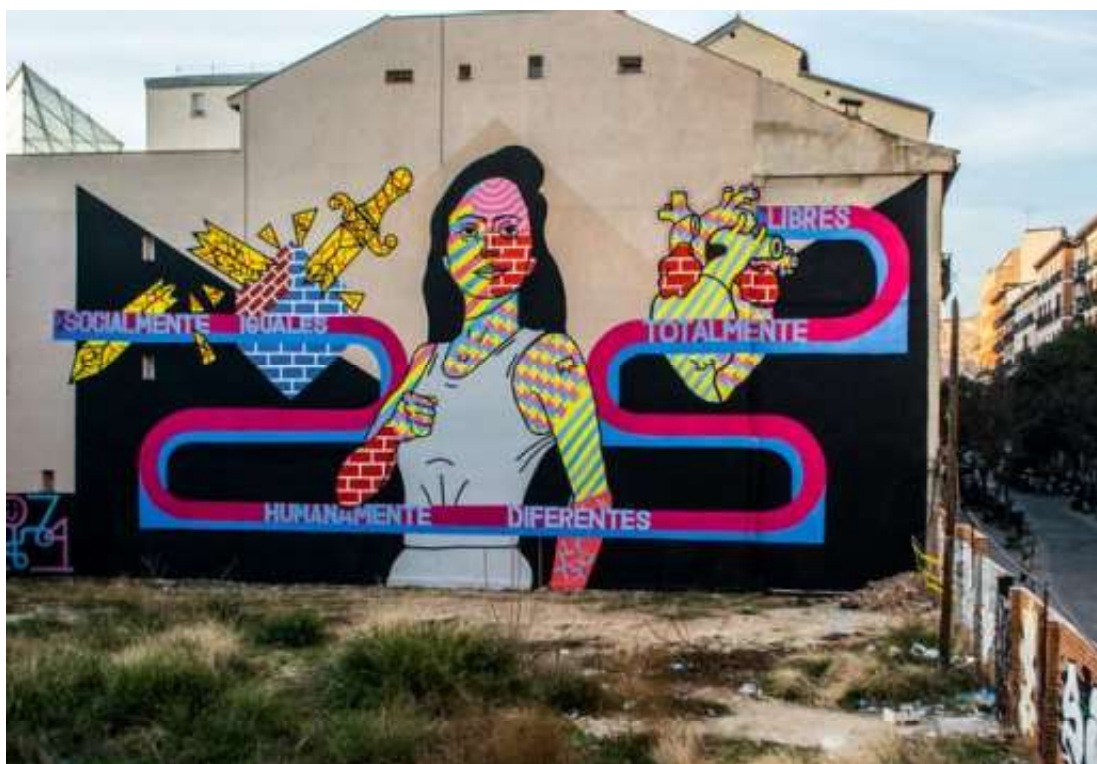
IMAGEN 7. El Rey de la Ruina. Lavapiés, Madrid. 2015.

Son numerosas las intervenciones de Ruina que reivindican la igualdad entre hombres y mujeres, pero la más conocida de la ciudad es un enorme mural del barrio de Lavapiés, realizada con su inconfundible estilo Pop ácido. En diciembre de 2015, Madrid Street Art Project comisarió un proyecto patrocinado por el Ayuntamiento de Madrid como apoyo a las ideas de igualdad de género, en el que participó, entre otros, el Rey de la Ruina. Este eligió como lema para su obra un mensaje de una frase de la pensadora, escritora y política Rosa de Luxemburgo: “Socialmente iguales. Humanamente diferentes. Totalmente libres”.