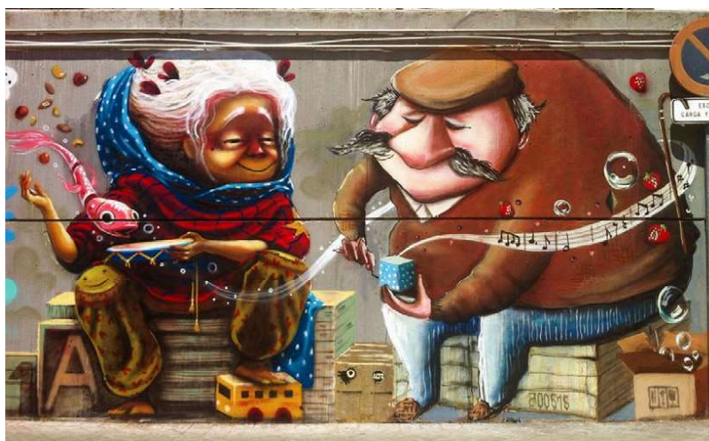
IMAGEN 9. Animalitoland. Moratalaz, Madrid. 2015

En esa línea de recreación de mundos mágicos, son varios los creadores que utilizan un estilo cercano a la ilustración de libros, centrada en la línea de dibujo, como Alice Pasquini, o con marcadas áreas de color, como Sabek. Destacan artistas como Julieta XLF o Animalitoland, que han desarrollado una carrera en la ilustración de literatura infantil. Sus personajes de aire naif se mueven en mundos alegres e inspiradores, puede apreciarse en el mural que Animalitoland (Buenos Aires, 1984), pintó en 2015 en la iniciativa MM15, un proyecto colaborativo organizado por la asociación de comerciantes del Mercado de Moratalaz para promover el embellecimiento del lugar convocando a diversos artistas urbanos para pintar los muros exteriores. Aquí la artista argentina pintó dos bellas criaturas, que, en vez de tener aspecto infantil como la mayoría de sus personajes, eran de avanzada edad y conversaban compartiendo música y recuerdos, acompañados de detalles mágicos como un pez que parece flotar en el aire. La dulzura de los rasgos de los personajes y la alegría del color muestran, como es característico de esta artista, su deseo de sacar una sonrisa al espectador.