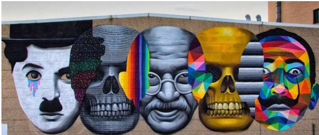
IMAGEN 6. Okuda. Movember . Villaverde, Madrid.

En el año 2013 realizó un mural de apoyo al proyecto Movember en el que se aprecian todas las singularidades de su estilo. Hizo esta intervención (IMAGEN 6) en Villaverde, sobre la fachada de una nave industrial que pertenece a Palibex, empresa de mensajería. Movember es una iniciativa en la que se animó a los hombres a dejarse crecer el bigote durante el mes de noviembre de 2013 con el objetivo de concienciar a la población sobre las enfermedades masculinas y la importancia de la prevención. Para esta intervención, el artista recurre a la imagen de tres de los bigotes más conocidos de la historia. Así reproduce los rostros de Charles Chaplin, Gandhi y Salvador Dalí en grandes dimensiones ( Palibex cede un muro de su nave a Okuda para apoyar «Movember» - Palibex, 2013 ).