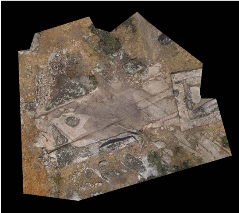
Fig. 8. Ortofotografía del Área Septentrional una vez concluida la campaña a de 2022, en la que se aprecia el alineamiento de los afloramientos graníticos retallados W-E, cuyo alineamiento continúa al otro lado de los muros aparecidos durante la campaña de AUDEMA S.L. en 2018, ya restaurados en la actualidad.

ella se detectó un relleno de regularización para mantener la misma cota y un pavimento superficial de tierra batida y apisonada, de color ocre-amarillento. Tanto en el lateral norte, como en el sur se detectaron indicios de muros de sillarejo granítico, con restos de teja y piedra menuda, que se apoyaba sobre la roca madre, completamente arrasados. En el lateral meridional se detectaron las marcas sobre la roca madre de la posición del muro. Se localizaron incluso pequeños canales de drenaje que aprovechaban las diaclasas naturales del granito y conducían la humedad bajo el pavimento de tierra apisonada en dirección este. Hacia el oeste, claramente al exterior ya del edificio, la canalización se hacía más ancha y profunda