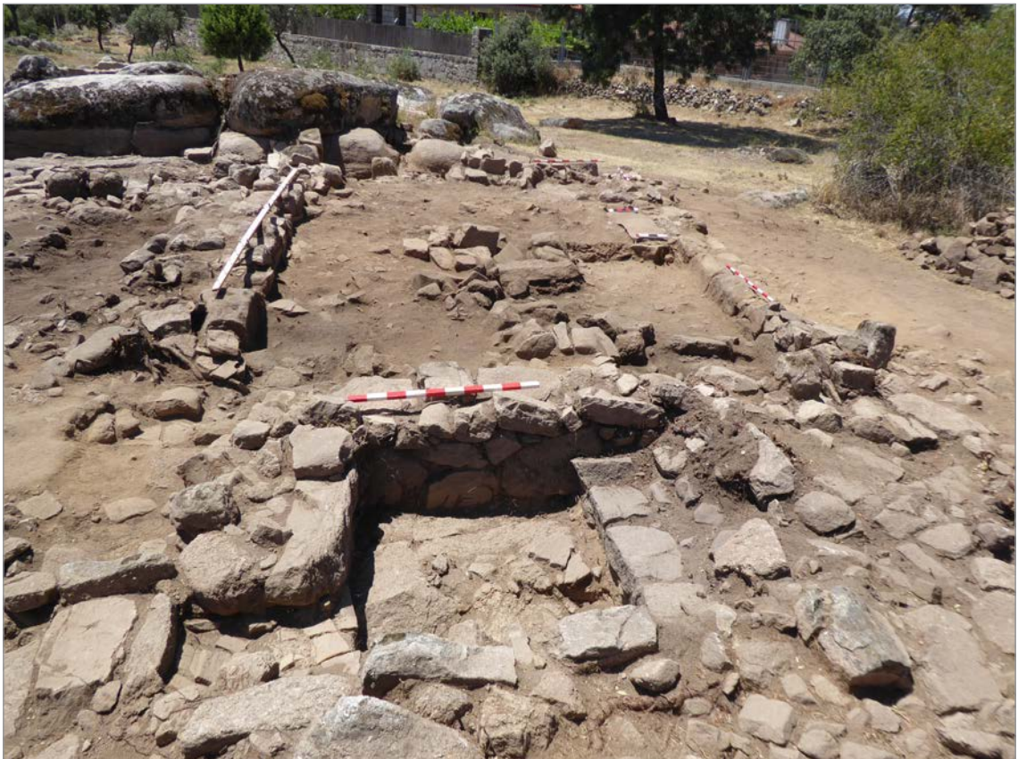
Fig. 3. Panorámica general de los Ámbitos 10 y 11 del Área Central de La Cabilda desde el este al comienzo de la campaña de 2022. Se aprecian los cimientos de dos muros emirales paralelos NE-SW a ambos lados del depósito de agua (Ámbito 11), reutilizándolo parcialmente y amortizándolo, uno de ellos desmantelado parcialmente para excavar en conducto de llenado o aliviadero.

donde no se había intervenido durante la campaña anterior. El nivel inferior de dicha estancia, bajo el que aparecía ya la roca natural, estaba constituido por un sedimento poco compacto de composición cenicienta y orgánica, de color gris oscuro, con abundantes materiales metálicos y cerámicos de cronología visigoda (Fig. 2). Dicho nivel buzaba suavemente en dirección norte, donde seguía apareciendo algún material aislado, con ceniza cada vez más escasa. Todo apunta a que este nivel corresponde a un vertedero de residuos de carácter primario, basura o limpiezas de hogares corres-