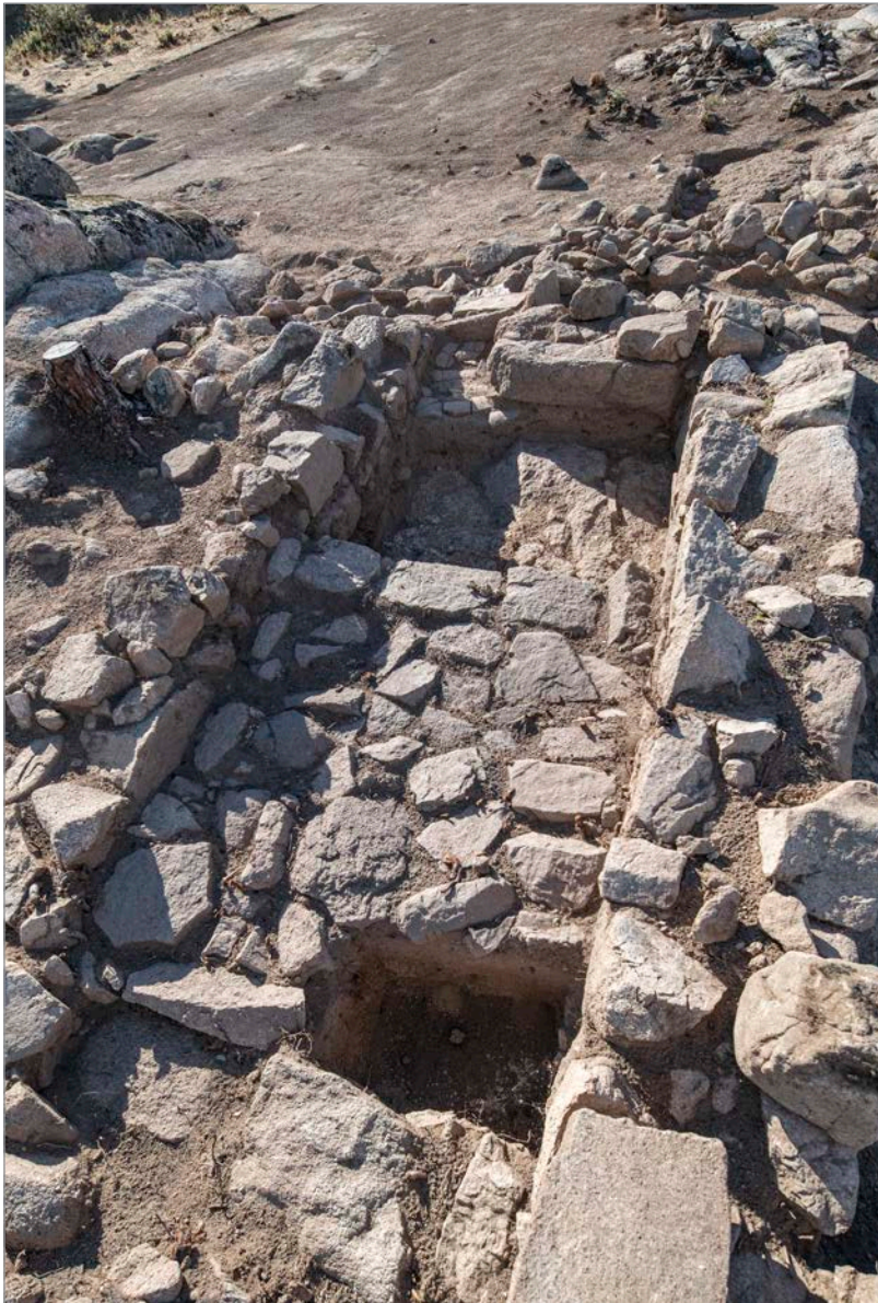
Fig. 4. Ámbito 11 del Área Central al final de la intervención de 2022. Se aprecia la plataforma de piedras emiral que sella en la mitad septentrional del depósito de un segundo momento visigodo, perforada intencionadamente durante las excavaciones para documentar su sistema constructivo su datación.

En la esquina sureste del Ámbito 10 parece existir un acceso al patio central en torno al cual se desarrolla el conjunto doméstico. Sin embargo, la zona está tan alterada que no permite concluir dicho extremo. Adosadas interiormente, a lo largo del muro sur de esta gran estancia, se localizan nuevas zonas de trabajo, configuradas por losas de piedra dispuestas verticalmente, muy semejantes a las localizadas en los muros oeste y noroeste durante la campaña anterior.