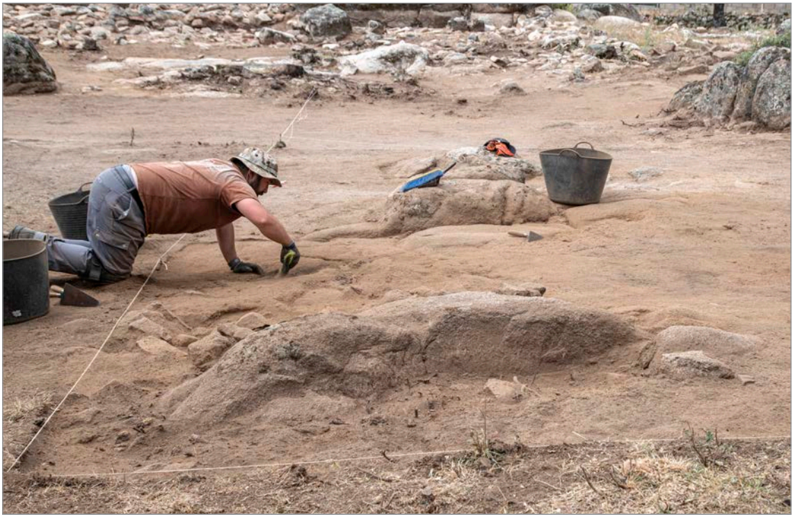
Fig. 6. Intervenciones en el sector septentrional del paleocamino situado al este del Área Central, que lo delimita por este flanco. Se aprecia la superficie horizontalizada y las capas de arena apisonada de coloración ocre que constituía la superficie de paso.

yacimiento, delimitándolo por este lateral. Se identificó la superficie de rodadura de un camino, compuesta por arena muy compacta sobre un nivel de tierra arcillosa de preparación y nivelación del terreno. Algunos afloramientos rocosos en la parte central del camino fueron tallados para enrasarlos con la superficie de circulación, conservando incluso huellas de rodadura sobre el granito. Por encima de la primera superficie de rodadura se aprecian, a escasos centímetros, indicios de una segunda superficie de rodadura de características similares, pero la presencia de arcilla de color ocre amarillento permite relacionar este segundo nivel con las estructuras constructivas y los pavimentos de las estancias del periodo emiral (Fig. 6).