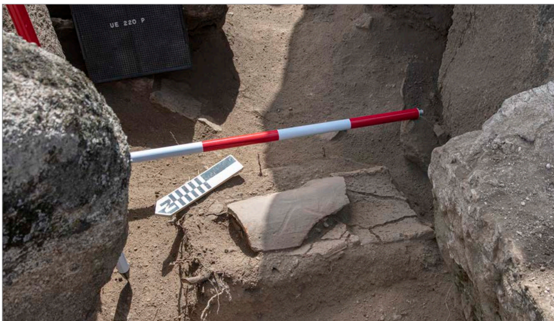
Fig. 7. Conducción cerámica formada por ímbrices que constituía el desagüero de la red de canales tallados en roca que corren bajo la plataforma de piedras para drenaje (Ámbito 6), en dirección al Ámbito 2, un primitivo depósito de agua más tarde sellado.