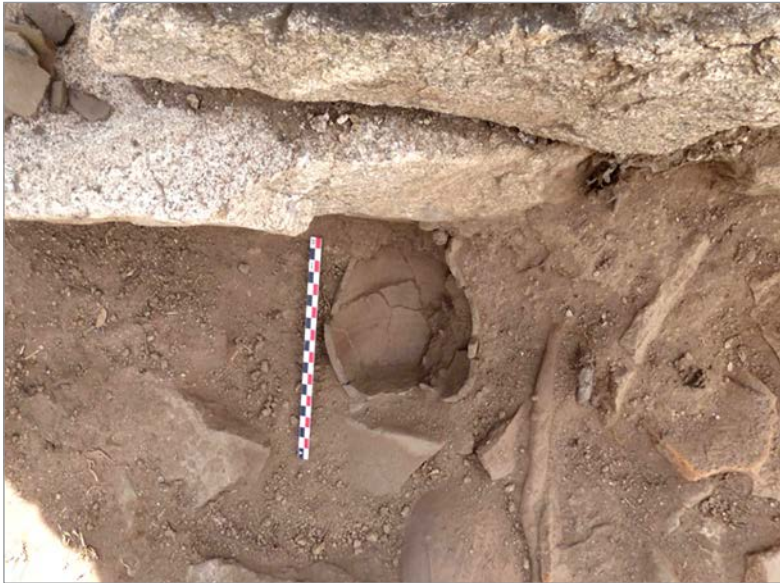
Fig. 2. Detalle de la excavación del Ámbito 10 (UE 383) del Área Central de La Cabilda junto al muro meridional, con los restos del vertedero de la primera fase visigoda. Campaña de 2022 (Fotografía: Ernesto Hidalgo Membiela).

donde no se había intervenido durante la campaña anterior. El nivel inferior de dicha estancia, bajo el que aparecía ya la roca natural, estaba constituido por un sedimento poco compacto de composición cenicienta y orgánica, de color gris oscuro, con abundantes materiales metálicos y cerámicos de cronología visigoda (Fig. 2). Dicho nivel buzaba suavemente en dirección norte, donde seguía apareciendo algún material aislado, con ceniza cada vez más escasa. Todo apunta a que este nivel corresponde a un vertedero de residuos de carácter primario, basura o limpiezas de hogares corres-