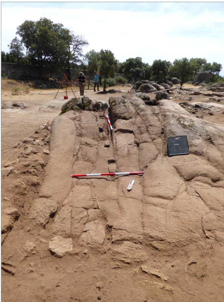
Fig. 5. Excavación del afloramiento granítico del Área exterior 12 (Estructura UE 400), donde se aprecia el retallado en pendiente S-N y los huecos cuadrados por pares y a distancias regulares a lo largo de esta superficie, correspondientes sin duda a una estructura en madera (Fotografía: Ángel Morillo, Rosalía Durán y Jesús Salas).

En esta misma Área exterior 12 (v. Fig. 1), se buscó delimitar por el este la parte correspondiente al conjunto doméstico del Sector Central que estaba al aire libre (patio y estancias abiertas) y su posición respecto a un posible camino, del que existían diversos indicios a simple vista. Con esta finalidad se delimitaron dos franjas de 4 m de anchura y 15 y 13 m de longitud al norte y sur respectivamente. Los resultados en ambos casos resultaron satisfactorios, pudiendo comprobar la existencia de un paleocamino que con dirección aproximada norte-sur recorre el flanco oriental del