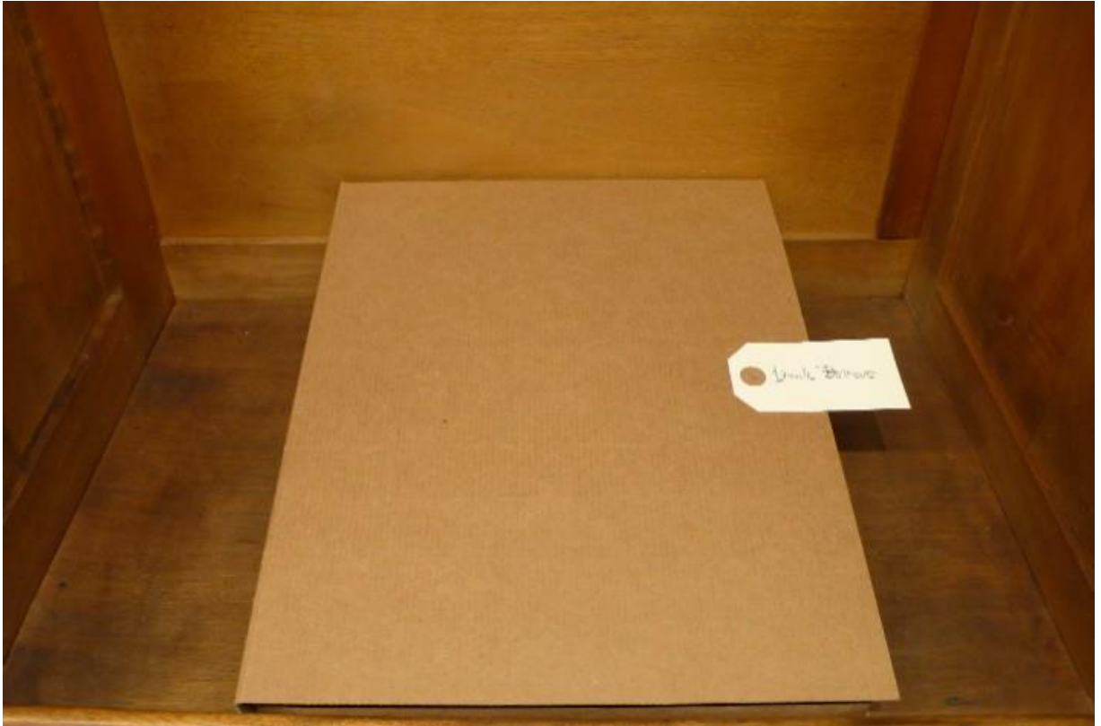
Déjà vu Émile Boirac