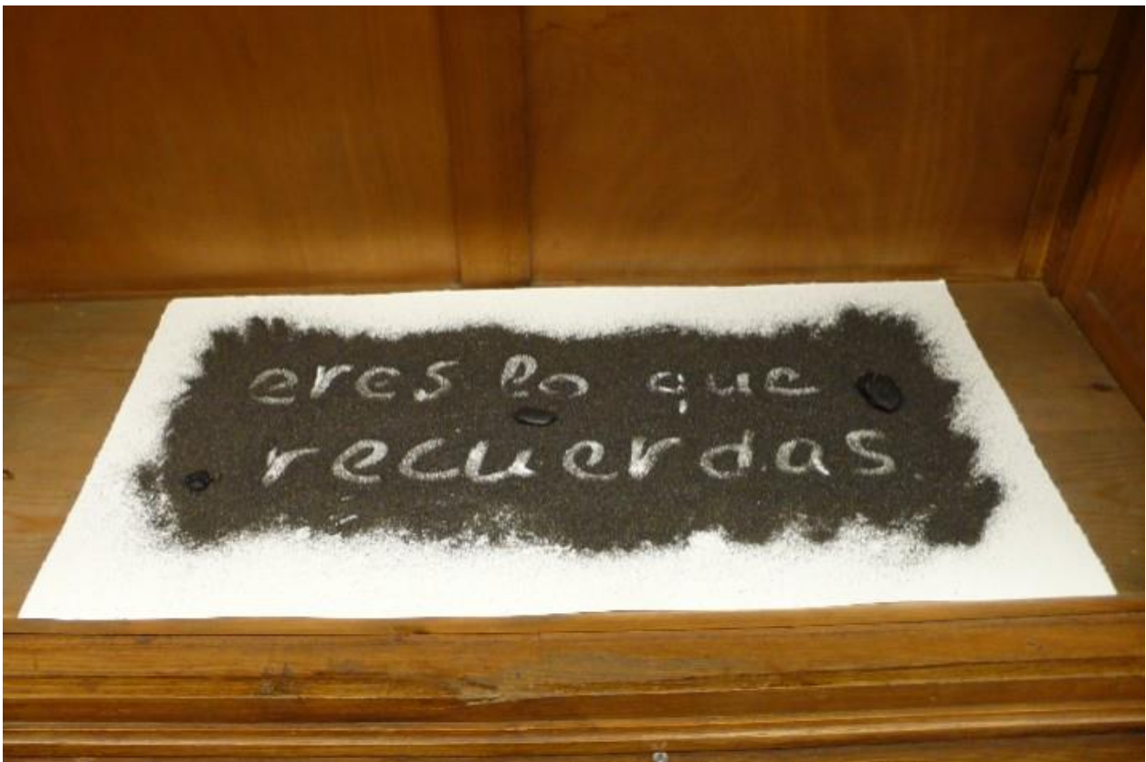
Eres lo que recuerdas