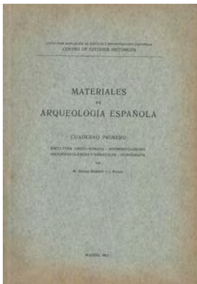
Fig. 3. Portada de la obra de M. Gómez-Moreno y J. Pijoan (1912).

José Ramón Mélida poco a poco fue realizando algunas monografías destinadas a la docencia universitaria, como fue el caso de Monumentos Romanos de España (1925). El libro contenía amplias descripciones de los monumentos romanos, algunos de los cuales había excavado él mismo, como el Teatro de Mérida, e introducía como novedad en la arqueología hispanorromana, estudios sobre la urbanística de las ciudades romanas de España, que hasta entonces nadie había abordado. El libro se acompañaba de una importante recopilación bibliográfica, dividida por yacimientos arqueológicos, que abarcaba desde las obras clásicas hasta las últimas memorias publicadas por la Junta Superior de Excavaciones Arqueológicas.