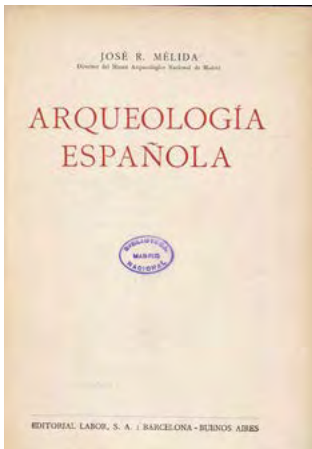
Fig. 5. Portada de Arqueología Española (1929).

En este capítulo, que tiene muchas similitudes con su obra Monumentos Romanos de España (1925), apenas existe interpretación o contextualización histórica alguna. A lo sumo una exigua introducción a la materia de este apartado, cuya importancia justificó de la siguiente forma: «de lo que fueron provincias romanas, España está reputada por ser la que conserva mayor número de monumentos arquitectónicos, algunos de importancia capital para la Historia del Arte Antiguo; y no hay duda de que muchos más han desaparecido» (Mélida, 1929: 262).