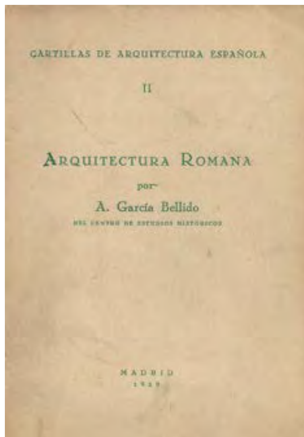
Fig. 4. Arquitectura Romana de Antonio García y Bellido (1929).

Cronológicamente la obra abarca desde el Paleolítico hasta época paleocristiana, y pretendió ser una actualización y puesta al día de la arqueología española, de ahí que algunos autores consideren que esta publicación formase parte de un proyecto para redactar una Historia de España, planteada por la Real Academia de la Historia desde época de Cánovas del Castillo, y que fue abandonado por dicha institución en 1927 (Díaz-Andreu, 2004: CXLII, Casado, 2006: 380).