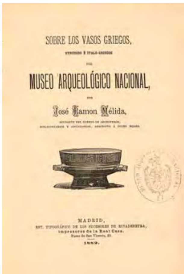
Fig. 2. Publicación de José Ramón Mélida Alinari sobre los vasos griegos de la colección del Museo Arqueológico Nacional (1882).