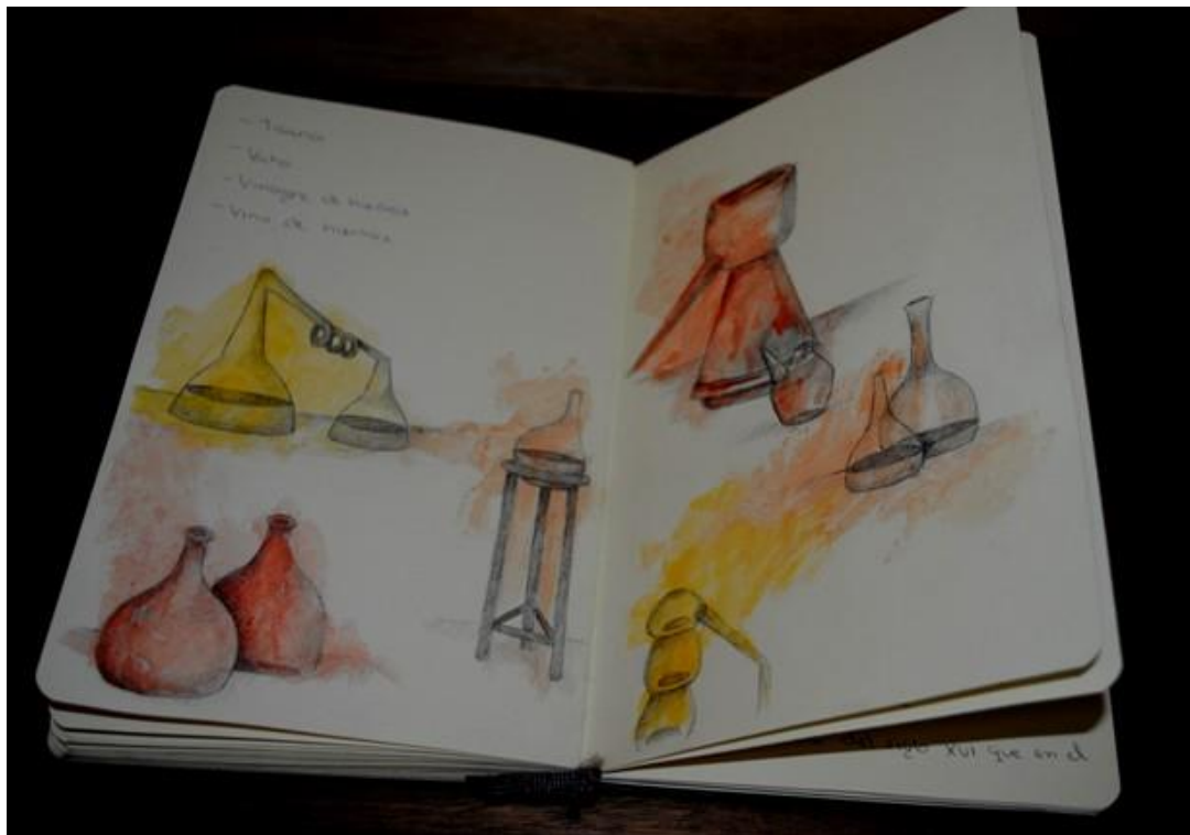
Casandra Carpintero. Libro de botánica . 2010 Aluminio, papel y acuarela. 23 x 15 x 3 cm.