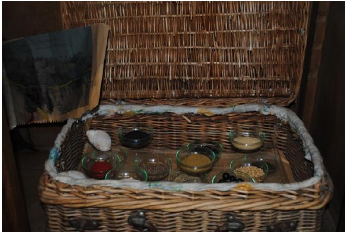
Irene Rodríguez Rodríguez. Lo que me llevé de El País: cuaderno de campo. 2011 Papel, látex, cuero y metal. 33 x 27 x 4 cm