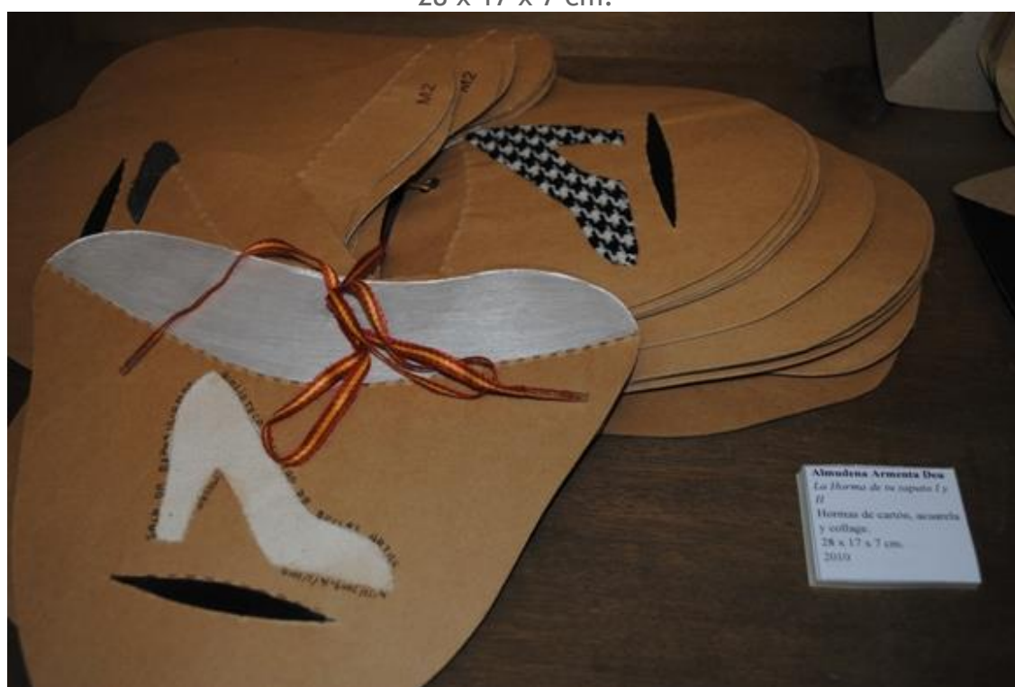
Almudena Armenta. La horma de tu zapato I y II . 2010 Hormas de cartón, acuarela y collage. 28 x 17 x 7 cm.