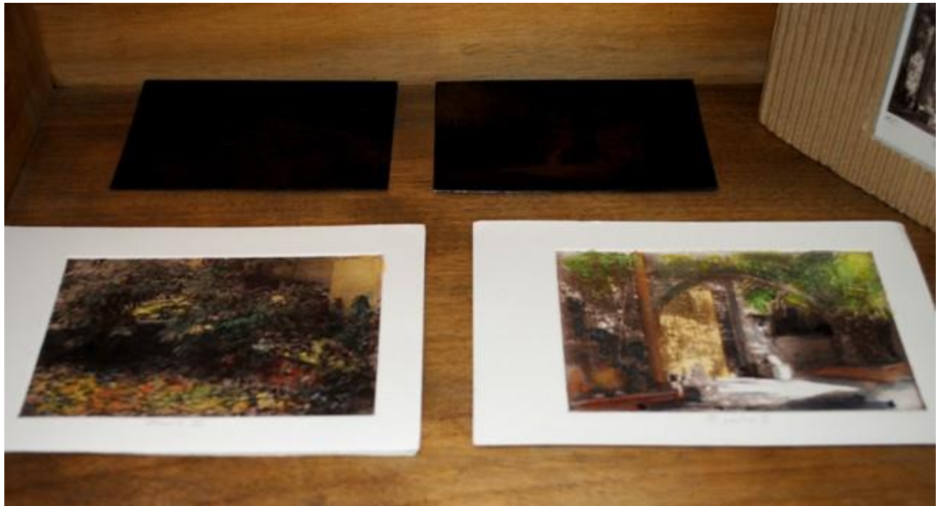
José Alberto de Santos Muñoz. El patio de mi casa . 2010 Fotograbado. 24 x 21 cm. Libro: 15 x 22 x 3 cm.