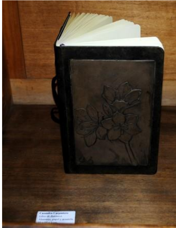
Casandra Carpintero. Libro de botánica . 2010 Aluminio, papel y acuarela. 23 x 15 x 3 cm.