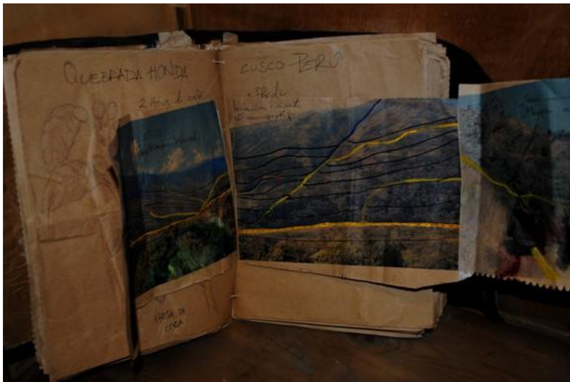
Irene Rodríguez Rodríguez. Lo que me llevé de El País: cuaderno de campo. 2011

Papel, látex, cuero y metal. 33 x 27 x 4 cm