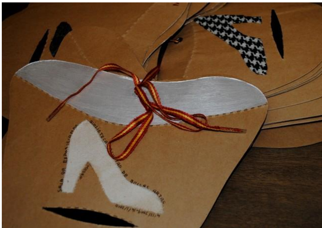
Almudena Armenta. La horma de tu zapato I y II . 2010 Hormas de cartón, acuarela y collage. 28 x 17 x 7 cm.