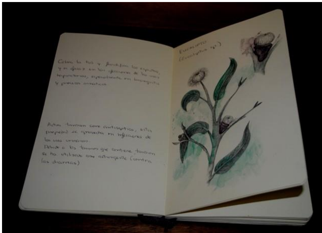
Casandra Carpintero. Libro de botánica . 2010 Aluminio, papel y acuarela. 23 x 15 x 3 cm.