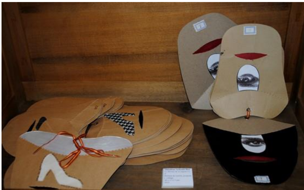
Almudena Armenta. La horma de tu zapato I y II . 2010 Hormas de cartón, acuarela y collage. 28 x 17 x 7 cm.