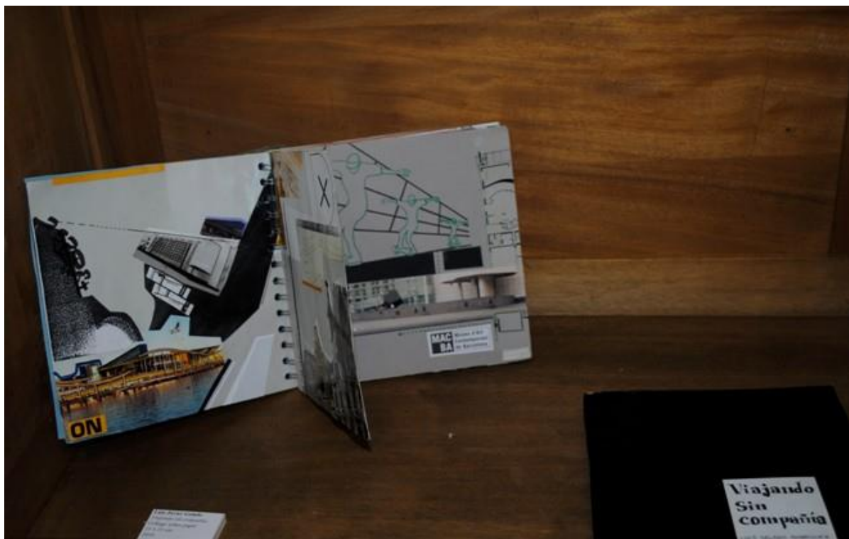
Luis Javier Gelado. Viajando sin compañía . 2010. Collage sobre papel. 21 x 21 cm