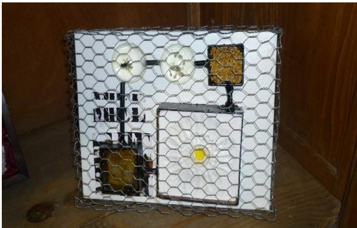
Alicia Calbet Díaz. Sistema de miel . 2010. Lienzo soporte, hierro, varilla, escayola, esmalte, resina de poliéster transparente, polen, miel y rejilla conejera. 23 x 16 x 5 cm.