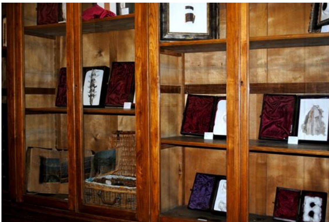
Vista general de la exposición