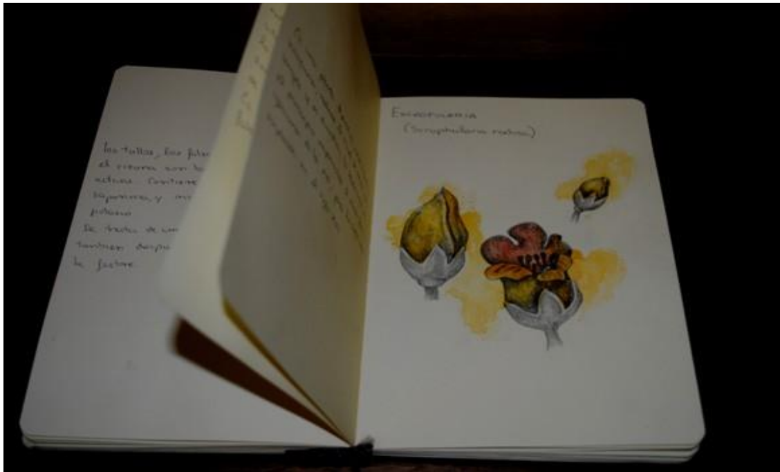
Casandra Carpintero. Libro de botánica . 2010 Aluminio, papel y acuarela. 23 x 15 x 3 cm.