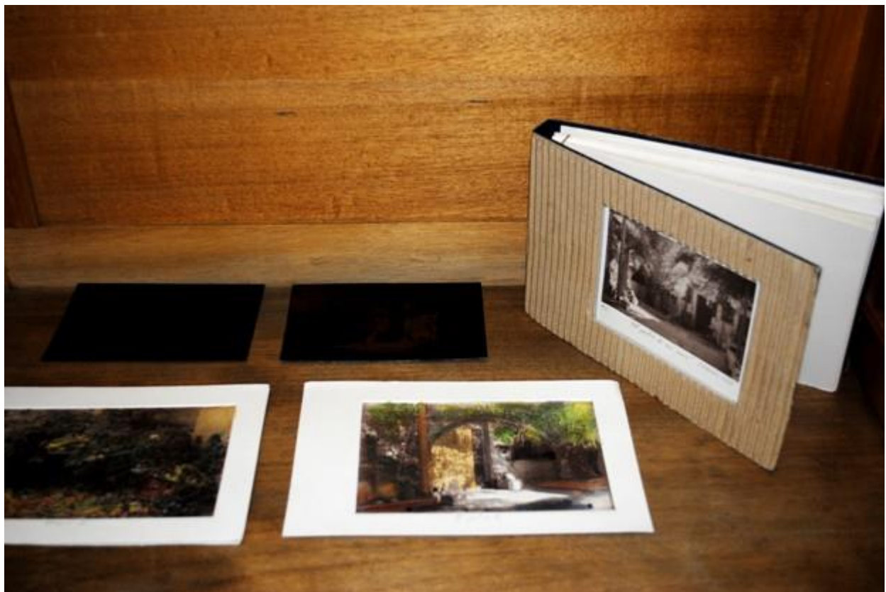
José Alberto de Santos Muñoz. El patio de mi casa . 2010. Fotograbado. 24 x 21 cm. Libro: 15 x 22 x 3 cm.