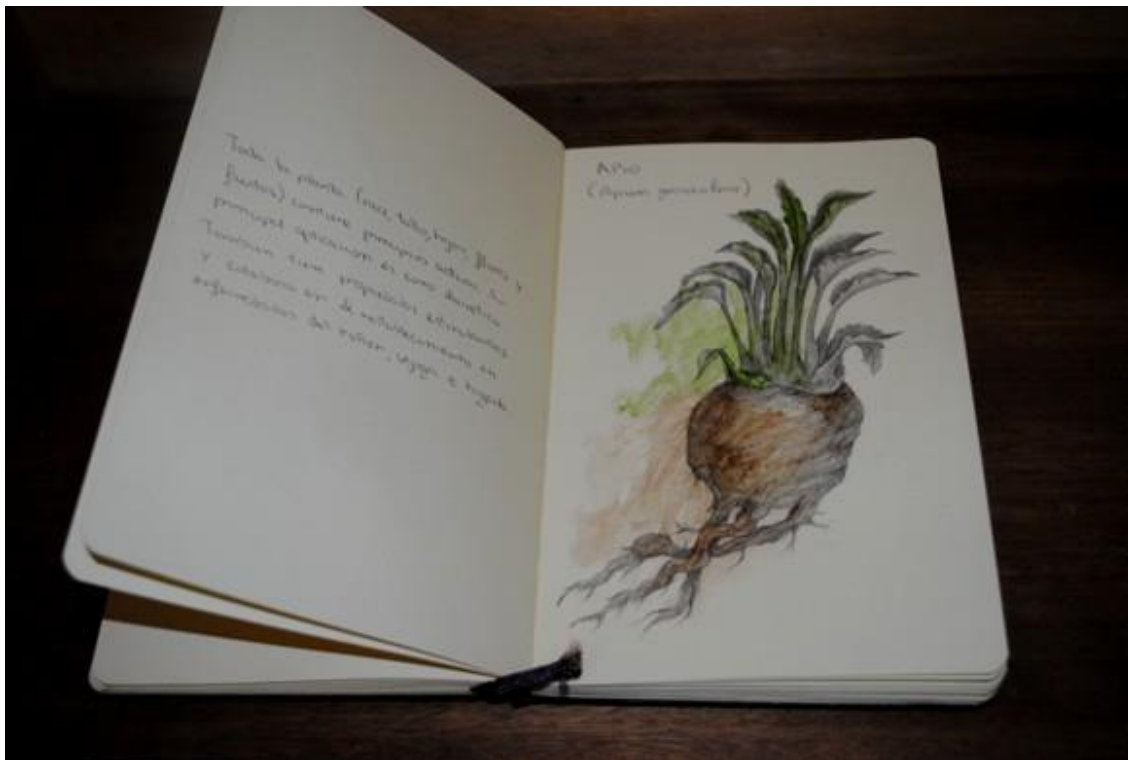
Casandra Carpintero. Libro de botánica . 2010 Aluminio, papel y acuarela. 23 x 15 x 3 cm.