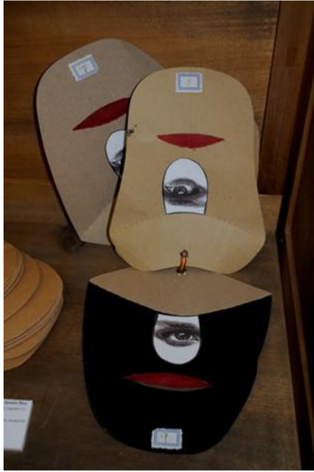
Almudena Armenta. La horma de tu zapato I y II . 2010 Hormas de cartón, acuarela y collage. 28 x 17 x 7 cm.