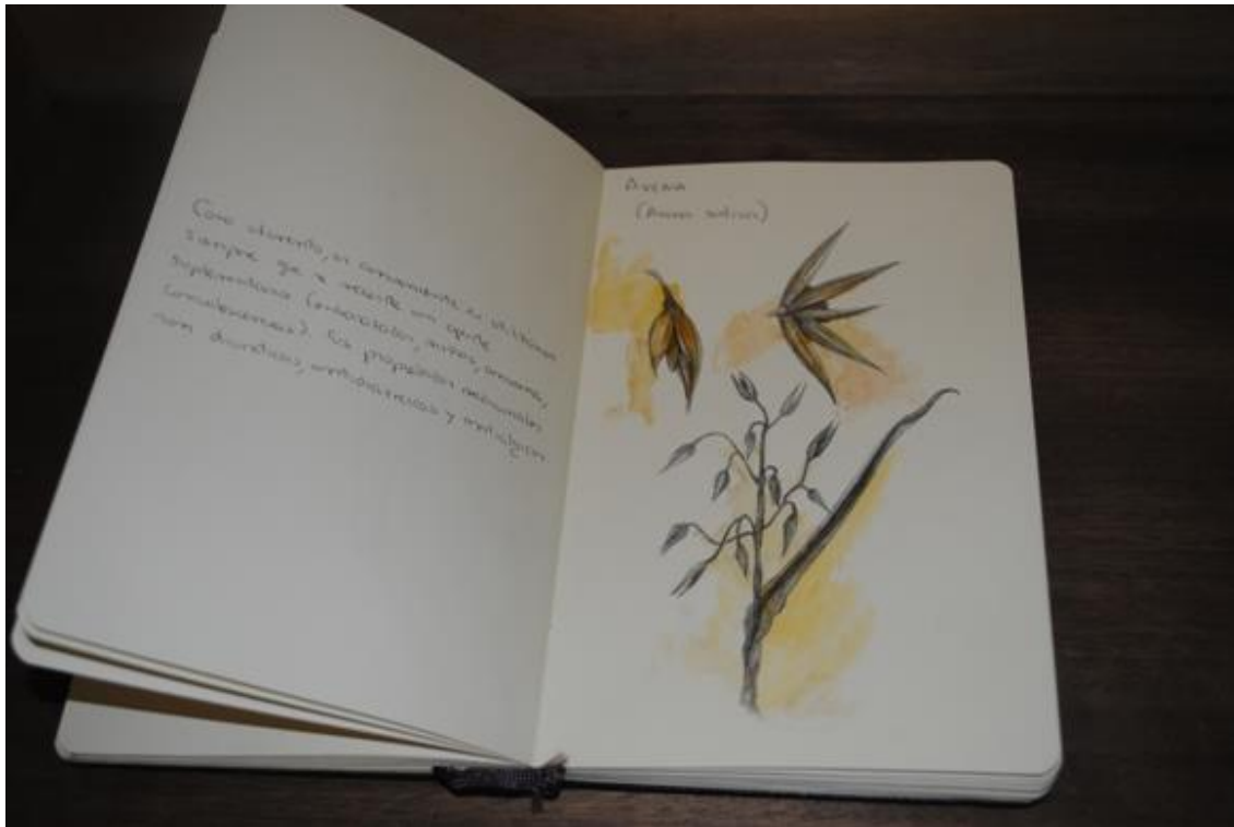
Casandra Carpintero. Libro de botánica . 2010 Aluminio, papel y acuarela. 23 x 15 x 3 cm.