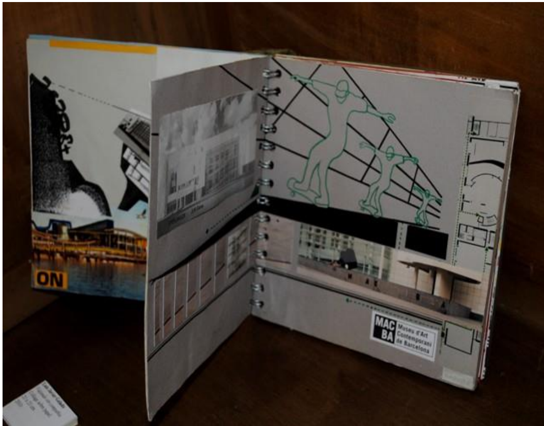
Luis Javier Gelado. Viajando sin compañía . 2010. Collage sobre papel. 21 x 21 cm.