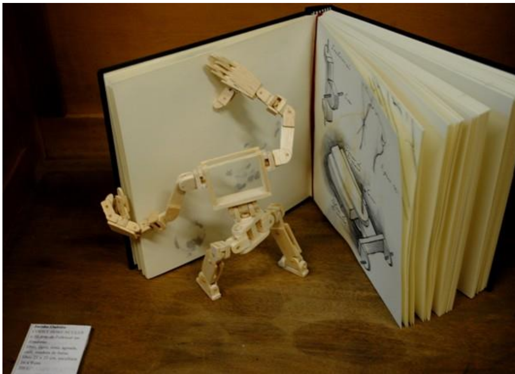
Jacobo Oubiña. Codex homunculus o El arte de fabricar un ayudante. 2011 Libro: lápiz, tintas, aguada, café, mader de balsa. Libro: 21 x 21 cm. Escultura: 16 x 9 cm.