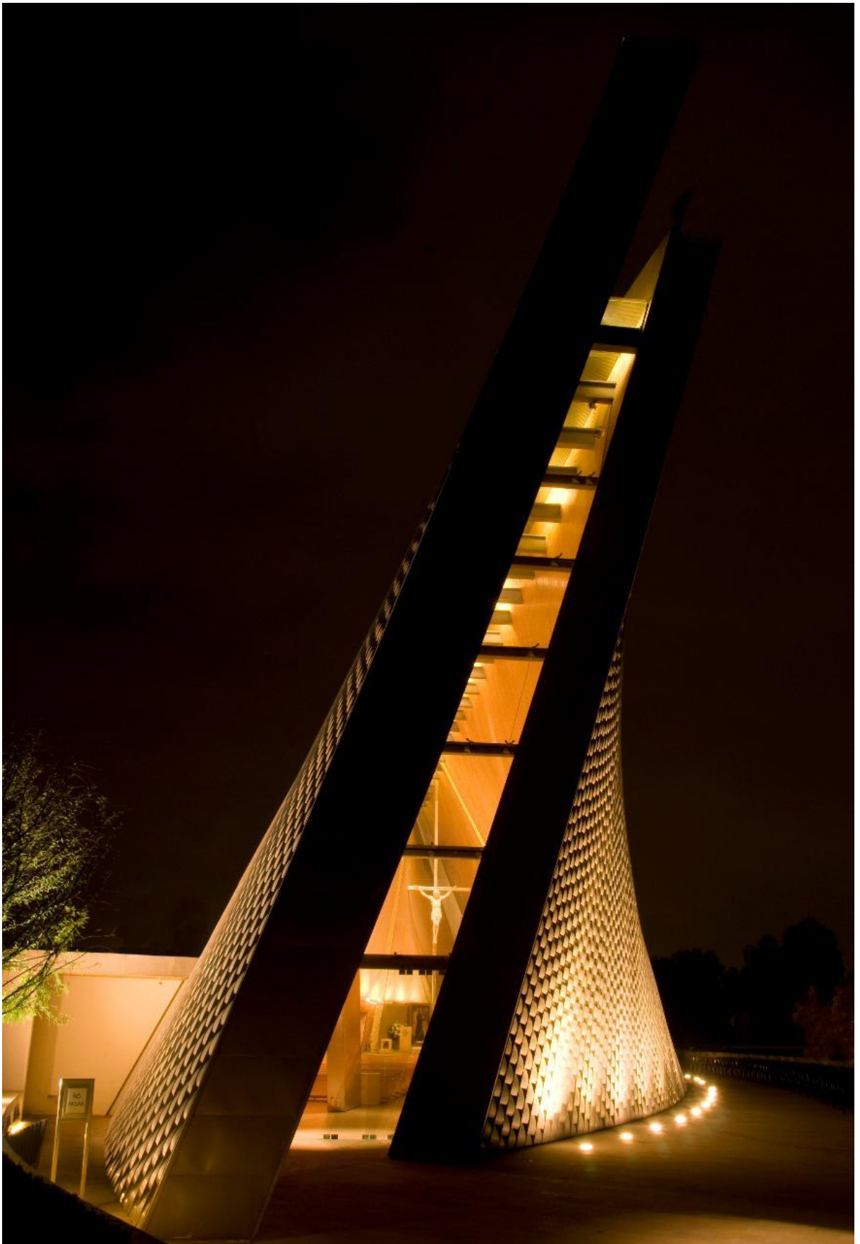
Vista general desde el exterior a través de cristaleras.