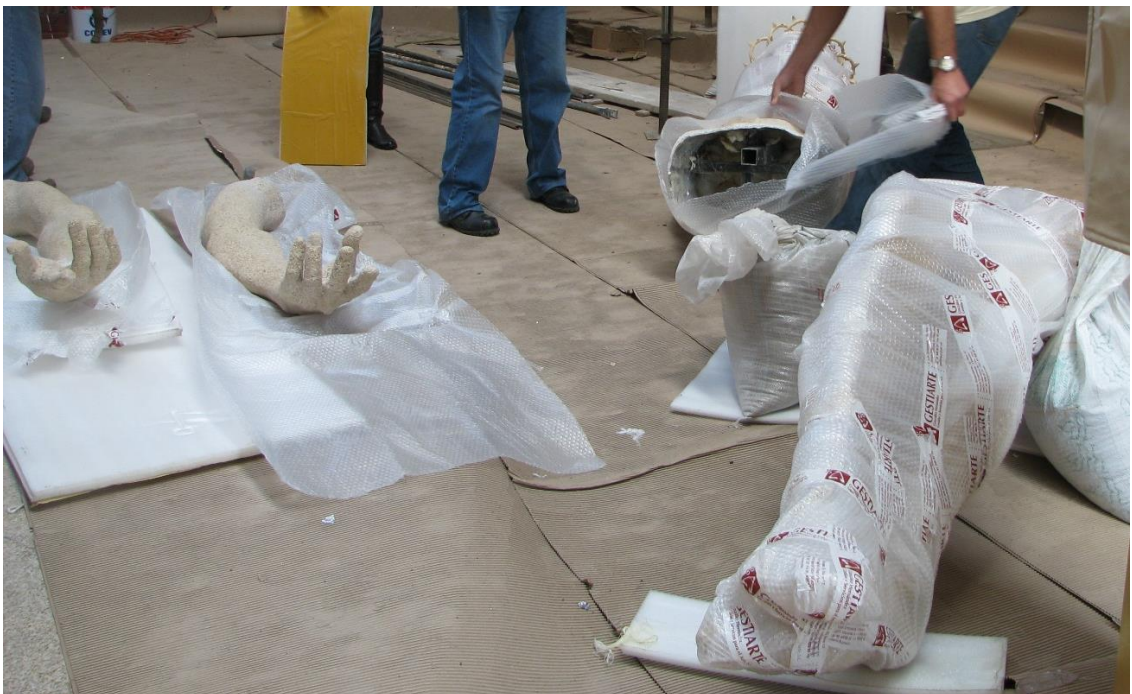
Desembalando para el ensamblaje