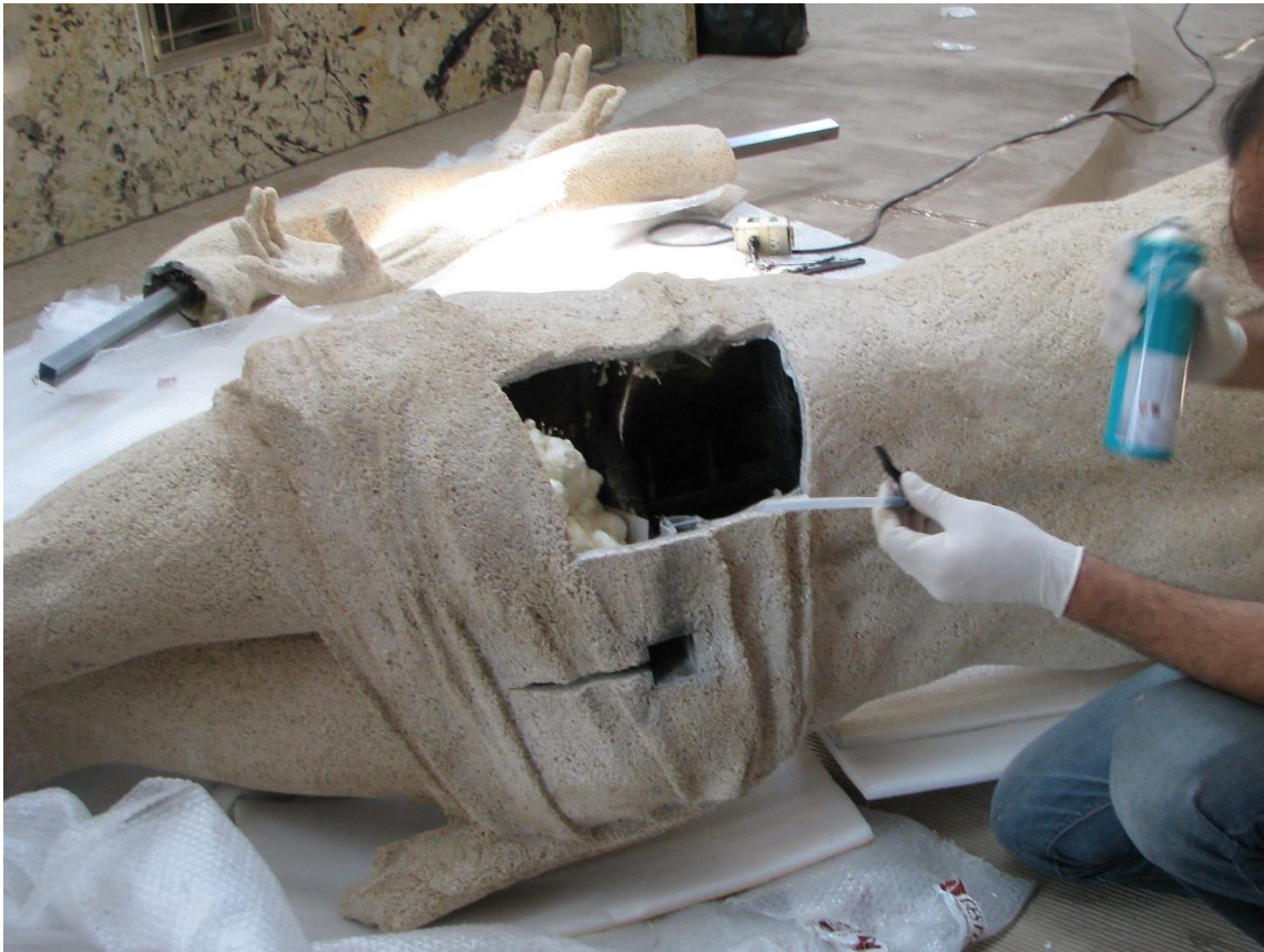
Proceso de ensamblaje