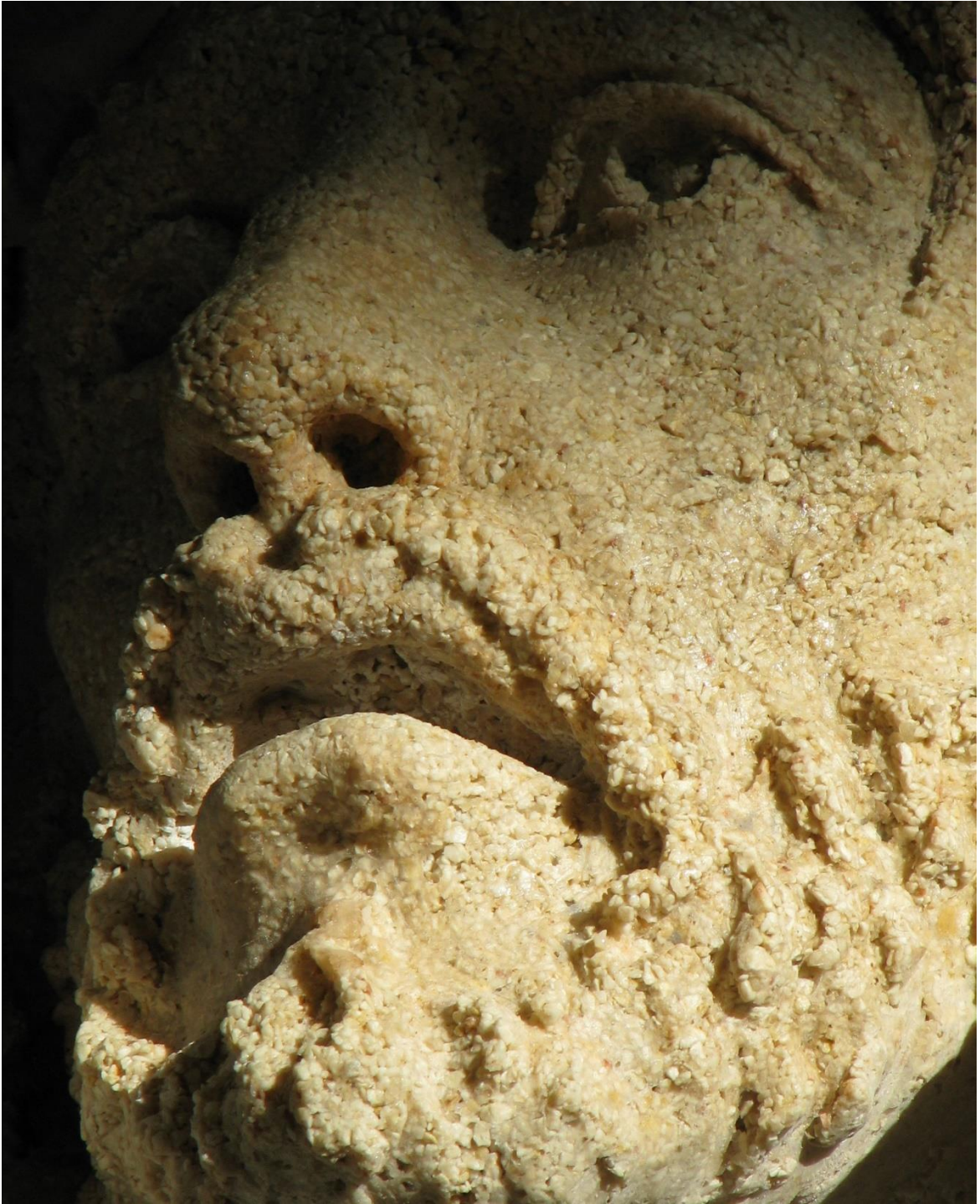
Detalle piedra caliza con resina