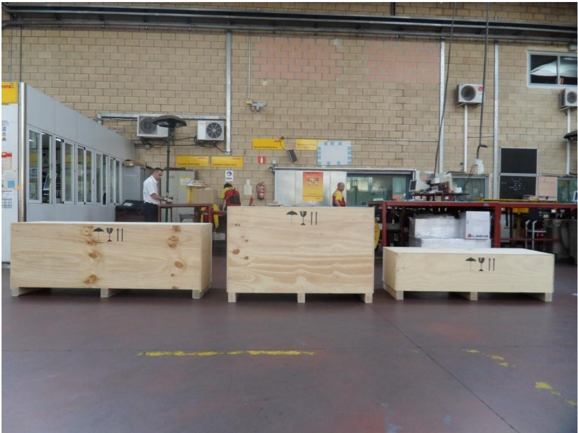
Cajas con las diferentes partes, en el aeropuerto