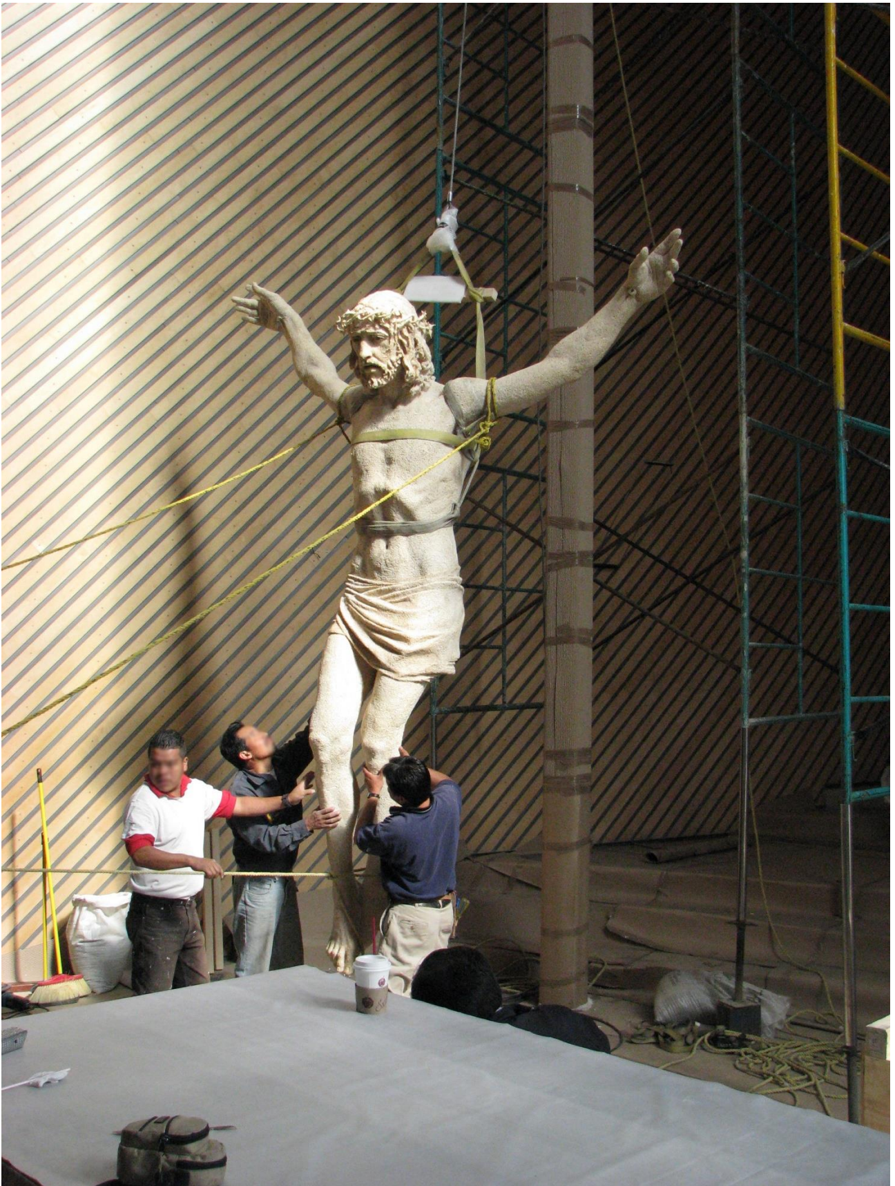
Proceso de instalación