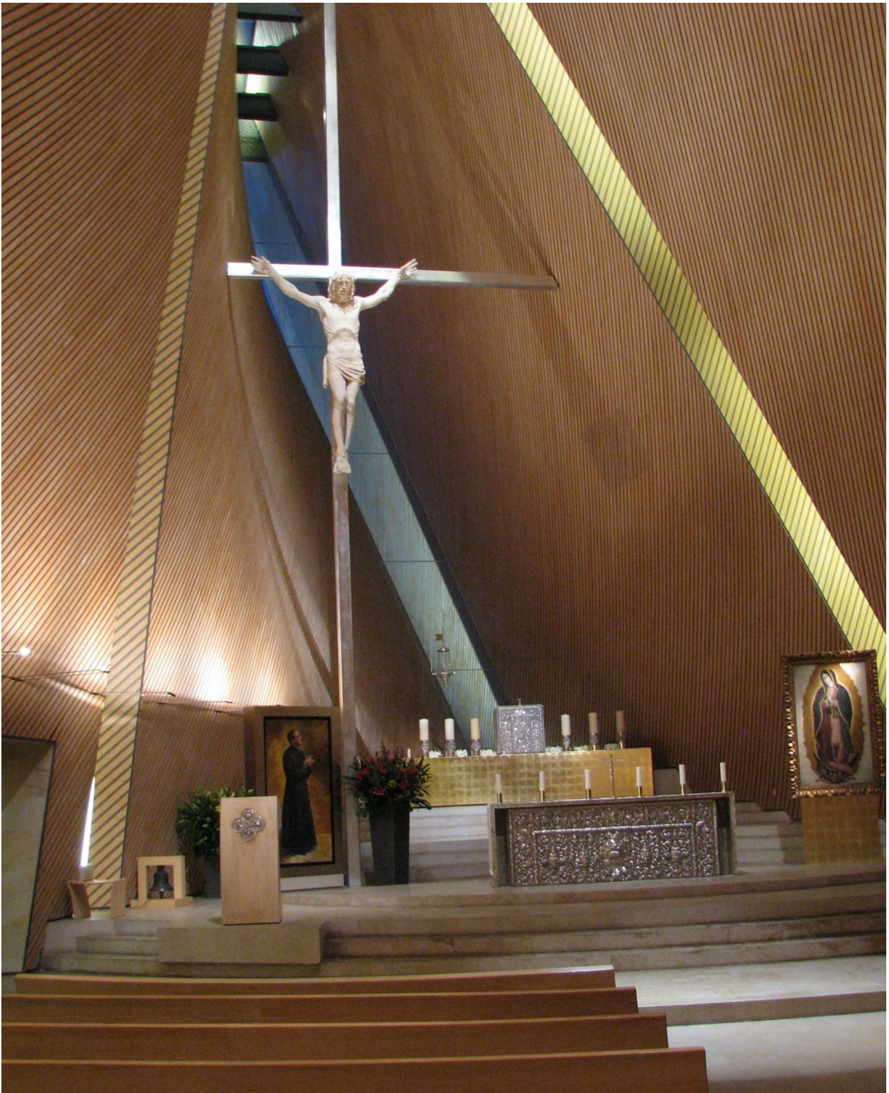
Vista general del presbiterio con la escultura instalada.