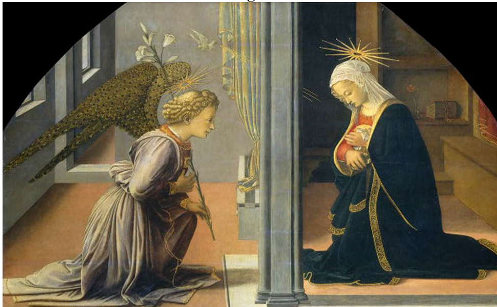
Fra Filippo Lippi, La Anunciación , 1435-1440. National Gallery of Art, Washington D.C.