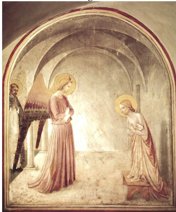
Fra Angelico, La Anunciación , 1440-41. Convento di San Marco, Florencia.