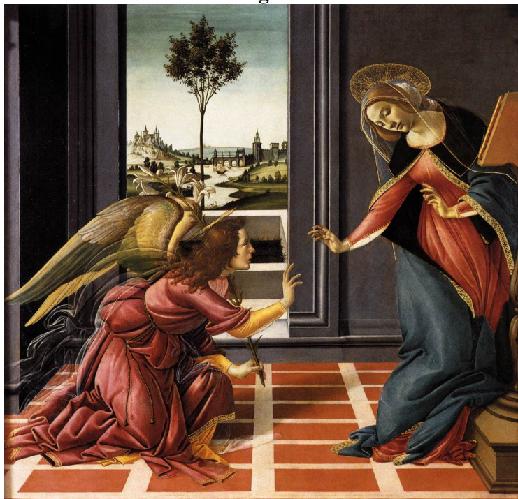
Sandro Botticelli, La Anunciación Cestello , 1489-90. Galleria degli Uffizi, Florencia.