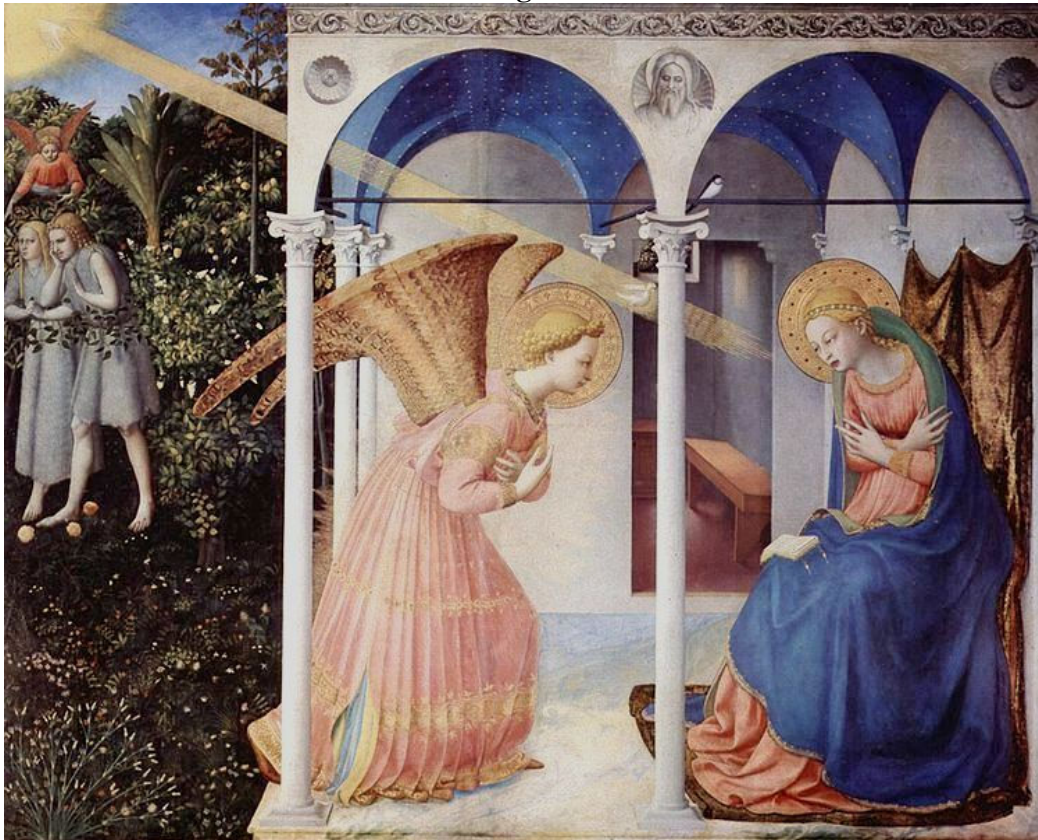
Fra Angelico, La Anunciación , 1430-1432. Museo del Prado, Madrid.

Al imaginar la intimidad de la residencia de la doncella nazarena en forma de pórtico sostenido por delgadas columnas clásicas, Fra Angélico “transparenta” y exterioriza sin restricciones todo cuanto sucede en su “interior”: el íntimo