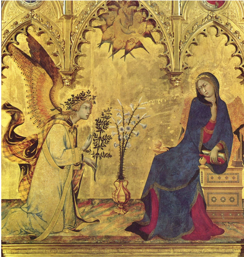
Simone Martini, La Anunciación , 1333. Galleria degli Uffizi, Florencia.

El mensaje del ángel, grabado en la inscripción epigráfica que emerge de su boca, se complementa con el gesto de tímido retraimiento de la Virgen, con su rostro girado hacia atrás y su brazo derecho protegiendo su pecho, doble gesto que sugiere cuatro significados complementarios: temor ante lo desconocido, recato como medida para salvaguardar su pureza, sorpresa ante el mensaje divino, y humildad ante el honor que se le asigna de ser elegida Madre de Dios.