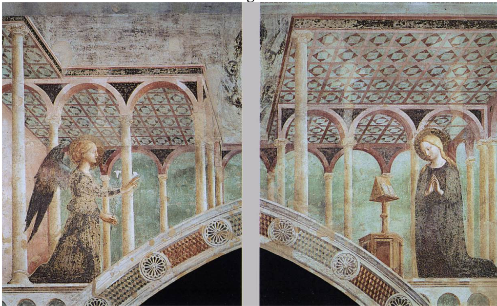
Masolino da Panicale, La Anunciación , c. 1428-1430. Cappella del Sacramento, iglesia de San Clemente, Roma.

Como lo hiciera también Giotto, Masolino busca unificar aquí esos dos distantes espacios mediante el recurso de una única escenografía arquitectónica, constituida por un monumental edificio porticado de arquerías clásicas, simétricas sólo en apariencia. 90