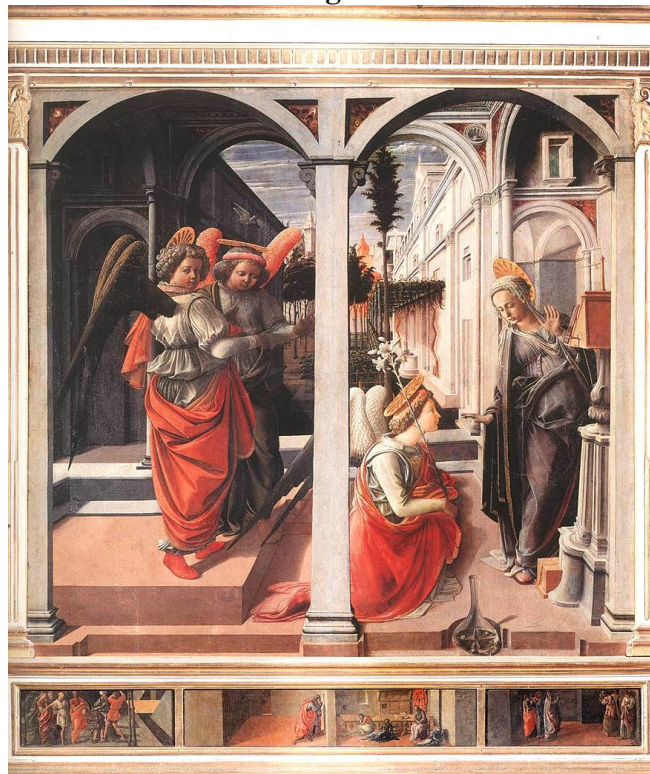
Fra Filippo Lippi, La Anunciación , c. 1445-1450. Iglesia de San Lorenzo, Florencia.