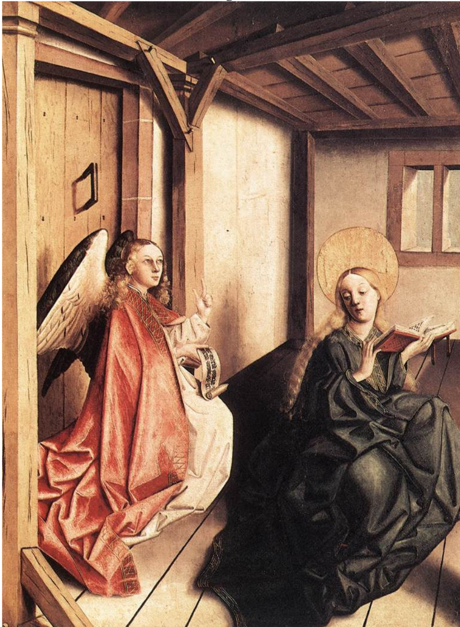
Konrad Witz, La Anunciación , c. 1440. Germanisches Nationalmuseum, Nürnberg.

El tratamiento de este tema iconográfico mariano en la pintura alemana, aun sin ser muy frecuente, no se distancia en exceso del enfoque emotivo-