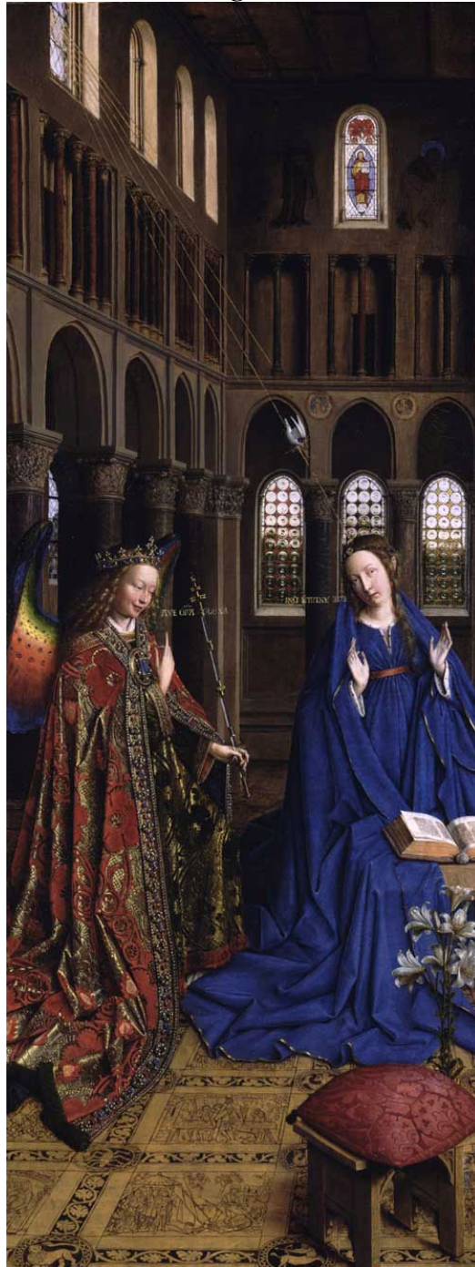
Jan van Eyck, La Anunciación en la iglesia , c. 1435. National Gallery of Art, Washington D.C.