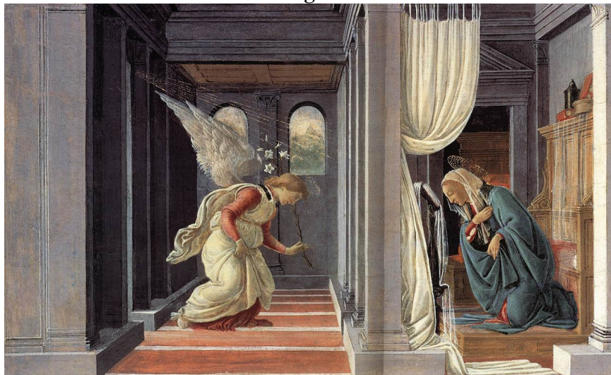
Sandro Botticelli, La Anunciación , c. 1485. Metropolitan Museum of Art, Nueva York.