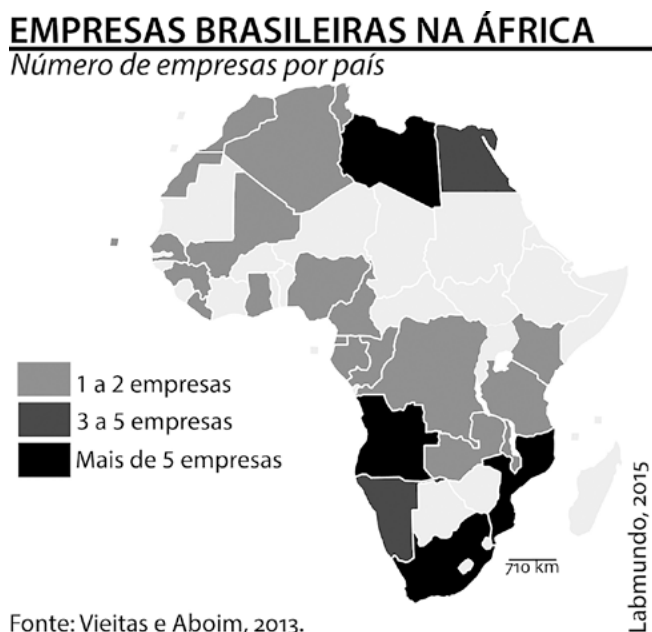
Mapa 3. Empresas Brasileiras na África.

Muitos desses investimentos são incentivados e contam com apoios públicos, sendo o BNDES um ator chave no processo de internacionalização de empresas