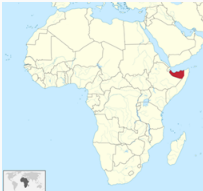
Somalilandia en África, Tubs, Wikimedia Commons (2023)

La Somalia Francesa logró su independencia en 1977, proclamándose como República de Yibuti. Mientras que la Somalia Británica se independizó el 26 de junio de 1960, bajo el nombre de República de Somalilandia. Es importante precisar la fecha concreta, pues 5 días más tarde, el 1 de julio de 1960, la Somalia Italiana consiguió su independencia a la vez que, ese mismo día, acordó su unión con la recién creada República de Somalilandia. Nació entonces el Estado de la República de Somalia.