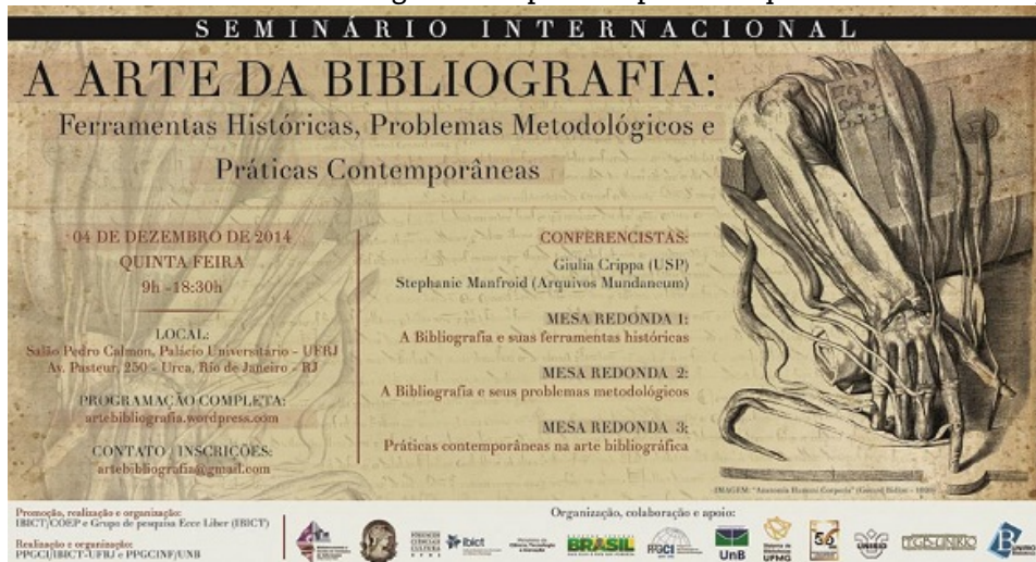
Figura 5. Seminário Internacional organizador pelo Grupo de Pesquisa Ecce Liber CNPq/Brasil

Enfatiza-se, nestes percursos eccliberianos, a procura pelo estímulo à criação cultural dos alunos e o desenvolvimento do espírito científico, envolvendo formação do sujeito cidadão a partir do sujeito pesquisador, fomentando a educação para ciência como espaço de educação para o social. Os eventos, gratuitos e abertos à comunidade em geral, e as intervenções do grupo para além da sala de aula, demonstram o foco na promoção da divulgação de saberes científicos, mas também a conjugação com saberes técnicos e culturais.