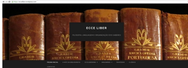
Figura 2. Página em linha do Grupo de Pesquisa Ecce Liber