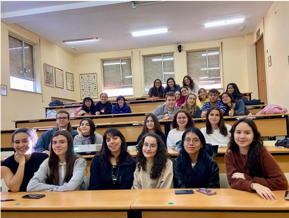
Figura 1. Imagen de los alumnos participantes en el proyecto que asistieron a la reunión presencial para la organización del mismo.