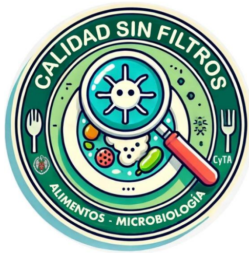
Figura 5. Logo final de la cuenta @CalidadSinFiltros creado por los alumnos participantes en el proyecto.