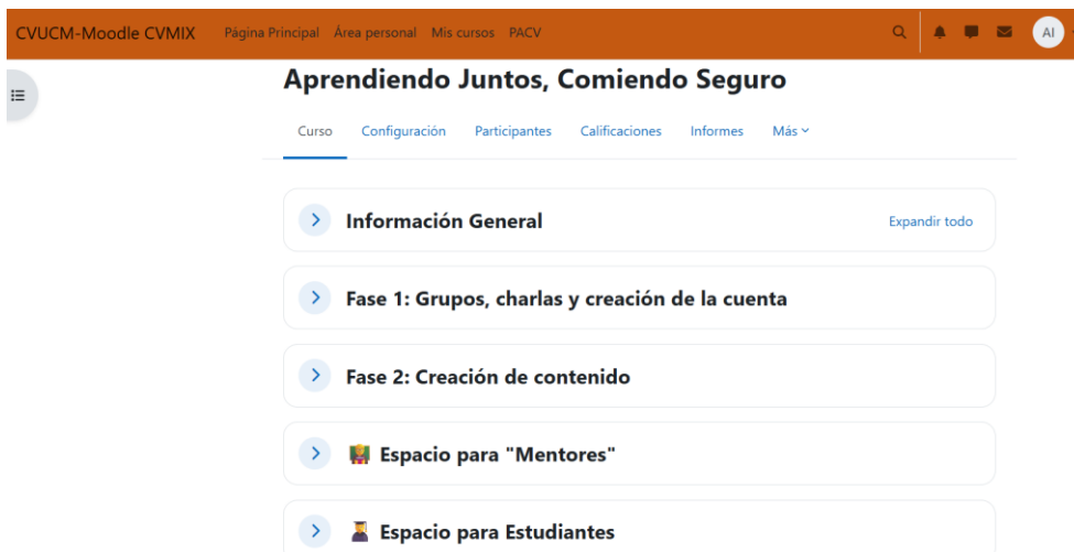
Figura 2. Espacio Moodle para Seminarios del Campus Virtual creado para el proyecto.