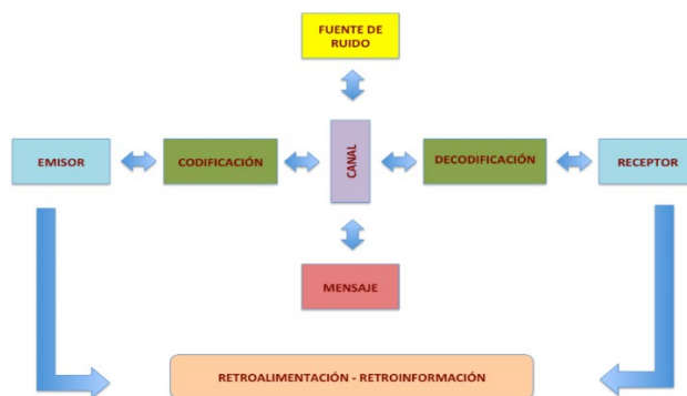
Gráfico 1. Elementos del esquema básico de los procesos comunicativos.

Los procesos comunicativos básicos comprenden una serie de elementos que también están presentes, con sus particularidades, cuando una agrupación del carnaval callejero transmite un mensaje cantado a una audiencia amplia. En el gráfico siguiente se muestra la relación entre los diversos elementos que constituyen la comunicación.