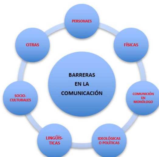
Gráfico 3. Esquema de barreras en los procesos de comunicación.

A continuación, se presenta un diagrama que ilustra gráficamente los diferentes grupos de barreras.