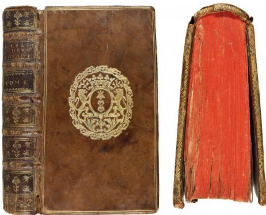
FIG. 5. – Tapa anterior, lomo con superlibro de Paulin Prondre de Guermantes y corte superior coloreado

15En los siguientes dos volúmenes 30 , encuadernados en el primer tercio del siglo XVIII, encontramos el superlibro de con las armas de la familia Prondre 31 , con unos leones de tenantes, surmontado por Corona y todo dentro de un óvalo floral, siendo el propietario Paulin Prondre de Guermantes (1650-1723), señor de Guermantes y de Bussy. Fue consejero real, secretario del rey y sus finanzas (1702), recibidor general de finanzas en Lyon, Grand Audiencier de France (primer oficial de la Gran Cancillería de Francia, encargado de registrar y sellar todas las mercedes, prebendas, indultos, etc. acordados por el rey, además de los privilegios y permisos de impresión), y Presidente de la Cámara de Cuentas de París (1713), que fue quien compró el dominio de Guermantes (1698), donde hizo numerosas obras, teniendo como modelo a Versalles, unos años después de su muerte un incendio destruyó gran parte de la biblioteca que había reunido (1756). En la parte trasera de la guarda se aprecia una inscripción manuscrita que contiene «Aux armes de Prondre de Guermantes Guigart II. 406».