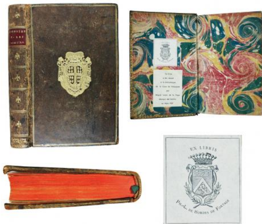
FIG. 9. – Tapa y lomo con el superlibro de Anne-León de Montmorency, guarda anterior marmoleada con exlibris de Philippe Louis de Bordes de Fortage y corte interior coloreado