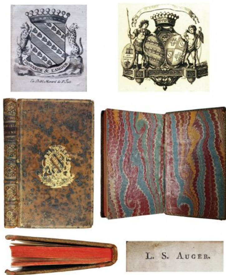
FIG. 10. – Exlibris y escudo de armas la familia Mérard de Saint Just, tapa anterior y lomo con superlibro de las armas de los Feillens y los Remigny, guarda marmoleada, corte inferior coloreado y el exlibris de Louis Simon Auger