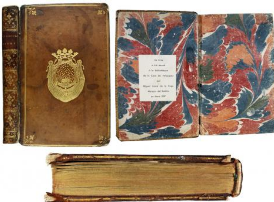
FIG. 8. – Tapa anterior y lomo con el superlibro del Marqués de Ossun (probable), guarda marmoleada y corte superior dorado