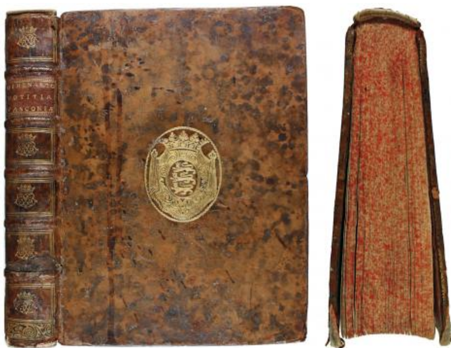
FIG. 4. – Tapa anterior, lomo con superlibro de Henri Jacques Nompár de Caumont y corte superior salpicado