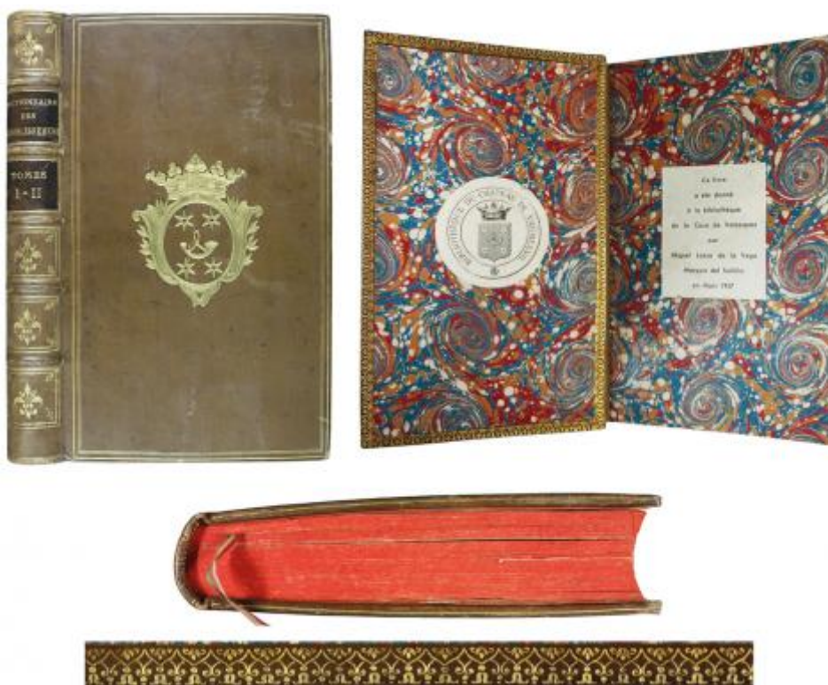
FIG. 12. – Tapa anterior, lomo, superlibro de la familia Vatimesnil, Corte inferior coloreado, guarda anterior con papel marmoleado y rueda del contracanto