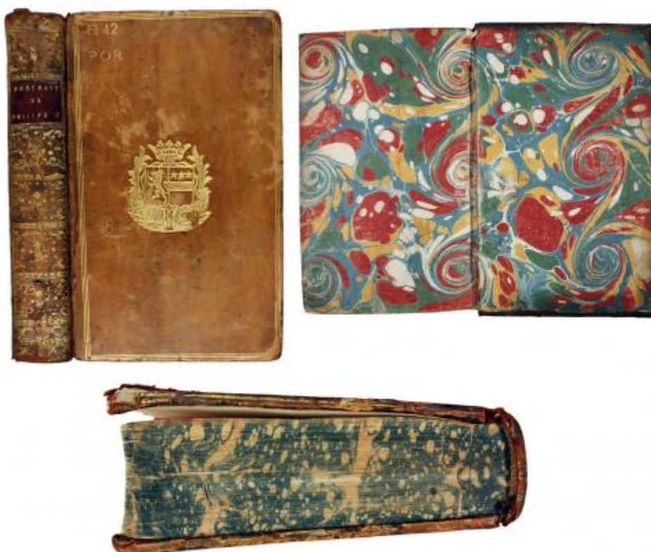
FIG. 11. – Tapa anterior y lomo con superlibro de las armas de los Feillens y los Remigny y guarda marmoleada