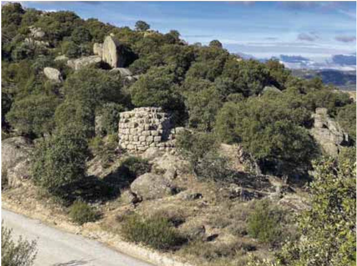
Vista de la Atalaya de la Torrecilla (Hoyo de Manzanares) donde se puede observar la tipología característica de las torres defensivas de la Marca Media en nuestra región, que fueron erigidas entre los reinados de Muhammad I y Abd-al-Rahman III

Entre estas dos atalayas, dependientes de sus respectivos ḥuṣūn , aparecían otras cuantas más jalonando este sendero. Casi todas ellas se ubican a una altura que oscila entre los 800-1.000 m. sobre el nivel del mar, lo que posibilita su visualización con sistema de humo, fuego y destellos. Estas intermedias son: El Molar, El Vellón, Venturada, Torrelaguna (también conocida como Arrebatacapas). En los terrenos de la Academia de Ingenieros de Hoyo de Manzanares, cerca del campo de tiro del Palancar, con un amplio dominio visual de los accesos a Madrid desde La Pedriza a través de todo el valle alto del Manzanares, se encuentra la Atalaya del Collado de la Torrecilla.