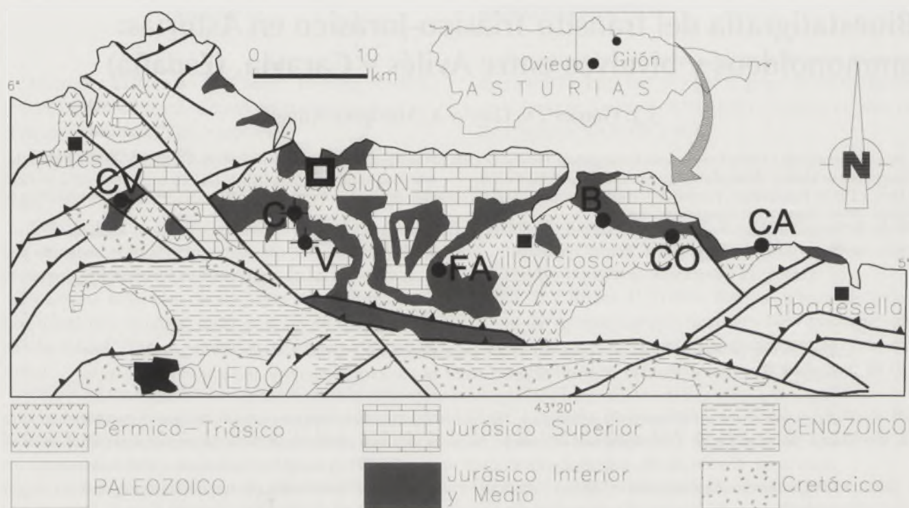
FIGURA 1. Mapa geológico esquemático de la zona central de Asturias, con la situación de las secciones y sondeos estudiados. CV. Sección de Corvera. C. Sondeo Cantavieyo. V. Sondeo Vilorteo. FA. Sección de Fabares. B. Sección de Bárzana. CO. Sección de Colunga. CA. Caravia.

romya (?) e Isocyprina (?) ligeramente por encima del último registro de Ovalipollis pseudoalutis (Krutzs, 1955) (Barrón et al. en prensa), del Rhetiense.