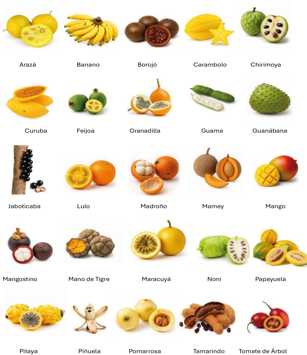
Figura 2.2 - Algunas frutas producidas en Colombia (Fuente: elaboración propia).

Colombia destaca como un importante productor de frutas y hortalizas procesadas de distinta tipología, como pulpa y extractos, vinagre y salsas, frutas deshidratadas, en conserva o congeladas, mermeladas, jaleas y compotas, jugos y concentrados, helados a base de frutas o especias y condimentos elaborados, que se exportan a países como Estados Unidos, Panamá, Reino Unido, España y México (Departamento de planeación nacional