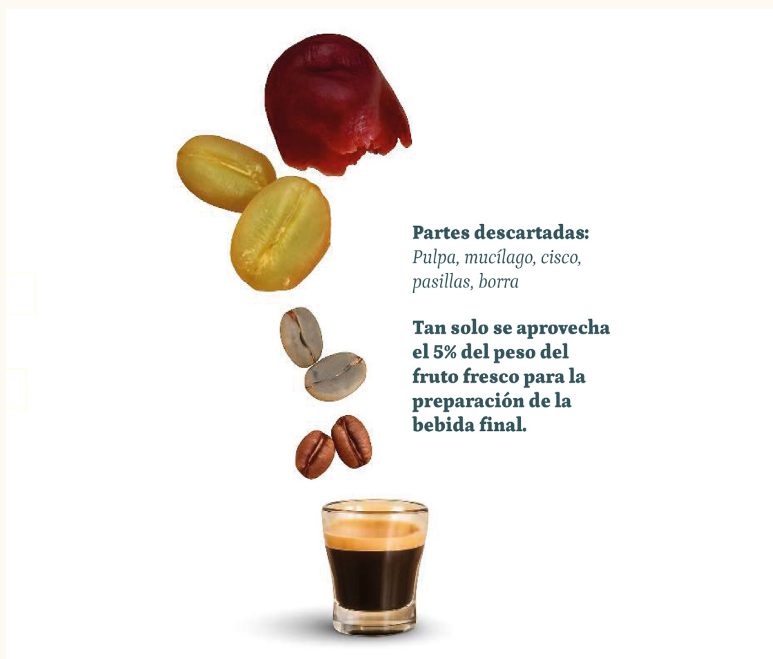
Figura 2.4. Partes del grano de café que son desperdicio (Adaptado de: https://sehablacafe.com/hablemos/anatomia-de-la-fruta-y-semilla-del-cafe/ y https://www.alimente.elconfidencial.com/nutricion/2022-02-09/cantidad-cafeina-cafe-forma-prepararlo_3366158/ ).

En lo referente a la cadena de frutales, se identifican diversas problemáticas según la Sociedad de Agricultores en 2022. Éstas, abarcan desde la carencia de escalas comerciales significativas, una marcada dispersión en la producción y un reducido nivel de asociatividad entre los productores, hasta la falta de una cultura agroempresarial que limita el acceso a créditos y asistencia técnica. Además, se observa una integración insuficiente entre la industria y la agricultura, una escasez de investigación y transferencia de tecnología en las fases agrícola y agroindustrial, así como la necesidad imperante de implementar medidas para la prevención de plagas y enfermedades. Otros desafíos incluyen el elevado costo interno de las materias primas, la ausencia de infraestructura de frío, los altos costos de energía, coeficientes técnicos de transformación bajos, la falta de programación de cosechas y una asistencia técnica insuficiente (Sociedad de Agricultores, 2022). Específicamente, en los cultivos de banano y plátanos, surgen problemáticas asociadas al uso de plásticos. Se utilizan sogas de polipropileno no biodegradable para