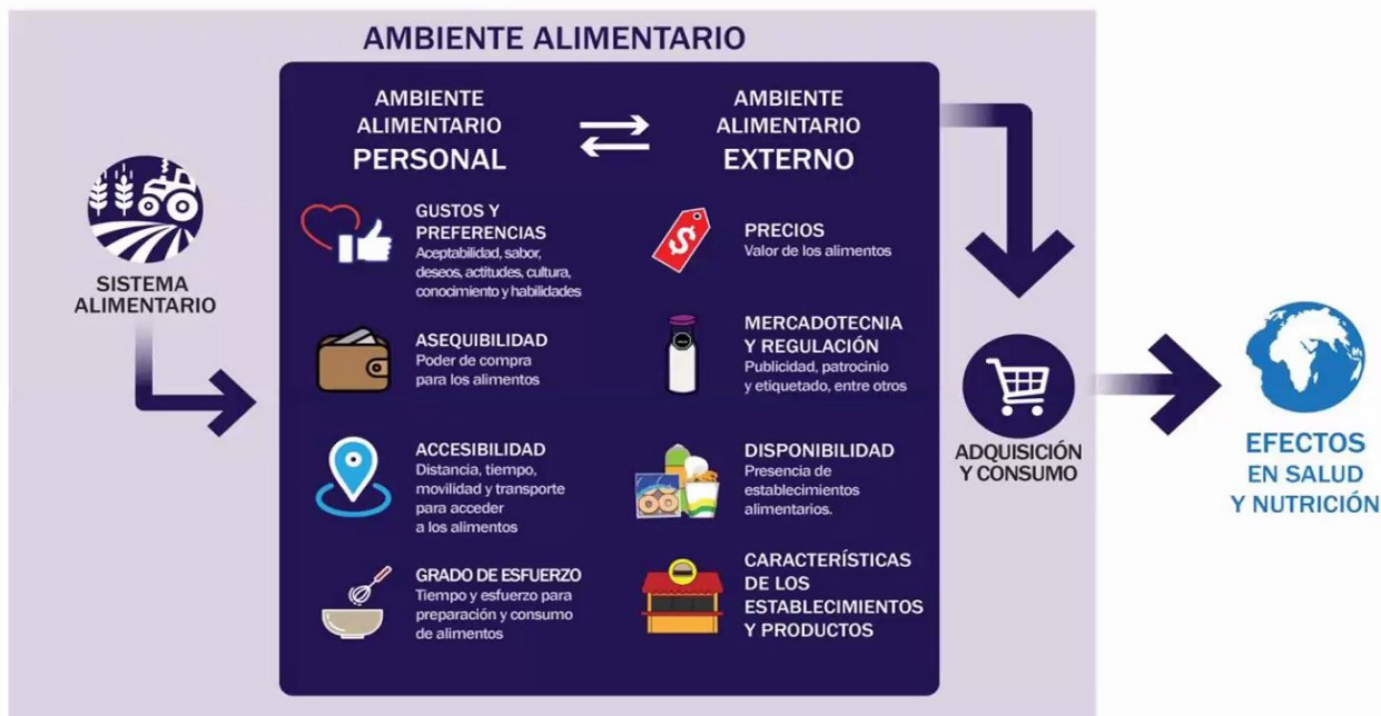
Figura 2.6. Ambiente alimentario.

El entorno alimentario, en el cual los consumidores interactúan con el sistema alimentario para adquirir, preparar y consumir alimentos, abarca elementos físicos, económicos, políticos y socioculturales. Este entorno comprende los lugares físicos de obtención de alimentos, las estructuras que facilitan el acceso, factores personales como ingresos, educación, valores y habilidades, así como las normas políticas, sociales y culturales que respaldan estas interacciones. Aspectos cruciales de este entorno, como el acceso físico y económico a los alimentos (proximidad y precio asequible), la promoción y publicidad alimentaria, la información disponible y la calidad e inocuidad de los alimentos, influyen en las elecciones de alimentos, su aceptabilidad y las dietas (figura 2.6).