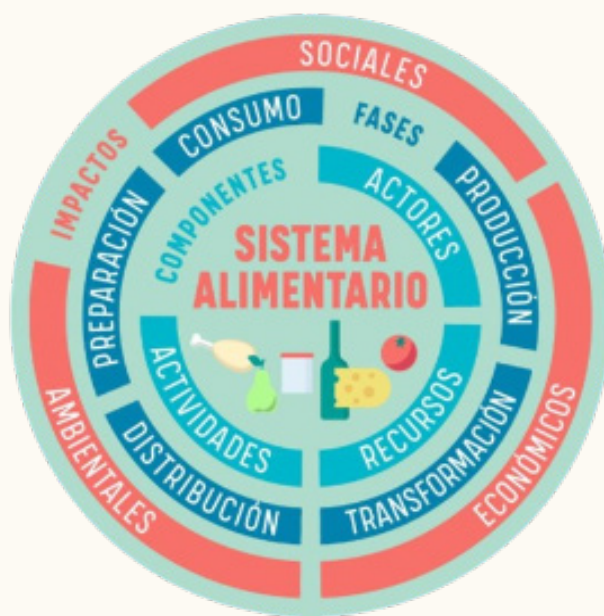
Figura 2.5. Infografía sobre sistemas alimentarios sostenibles.

Los sistemas alimentarios, definidos como la suma de elementos, actividades y actores que facilitan la producción, distribución y consumo de alimentos (Balmaceda, 2023), juegan un papel crucial en diversos aspectos de la vida, como la salud, el medio ambiente, la economía, el entorno social, cultural y político, y deben garantizar la seguridad alimentaria y nutricional de la población (figura 2.5). Esto implica asegurar que todas las personas tengan acceso, tanto físico como económico, a alimentos suficientes, seguros y nutritivos para satisfacer sus necesidades alimentarias y mantener un adecuado estado nutricional (Salazar y Muñoz, 2019).