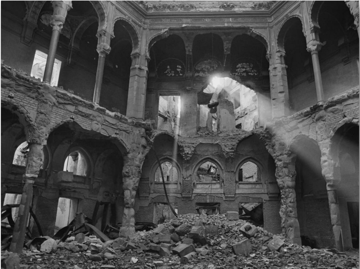
Ilustración 11. La biblioteca de Sarajevo, destruida en 1992, durante la guerra de Bosnia-Herzegovina

Para entender cómo se llegó a esta situación es necesario retrotraernos al 1 de diciembre de 1918, cuando se creaba la antigua Yugoslavia. Fue un Estado multinacional creado por la Europa de Versalles, vencedora en la Primera Guerra Mundial, contraviniendo los famosos «Catorce Puntos» de Wilson. No obstante, fue una nación en la que nunca existió una igualdad y una solidaridad multiétnica, pues los serbios, parte integrante del nuevo país, sólo querían ver en Yugoslavia una Serbia más grande. Tras la Segunda Guerra Mundial, la Yugoslavia de Tito (1945-1980) trató de evitar, mediante su régimen autoritario y personal, la preponderancia de una etnia sobre las demás (especialmente la serbia) suprimiendo así la libre autodeterminación de los pueblos. Pero tras la muerte del Mariscal, la autoridad central se fue relajando y resurgió, lentamente, el renacer étnico. Este contexto interno unido a factores externos, como el fin de la Guerra Fría y la incapacidad de la comunidad internacional por afrontar la crisis yugoslava con éxito, conformaron los fundamentos del derrumbamiento