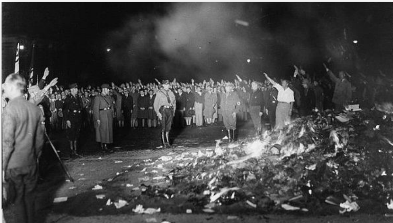
Ilustración 4. Quema de libros realizada por los nazis el 10 de mayo de 1933.

El 10 de mayo de 1933 una enorme pira de libros ardía en la Plaza de la Ópera de Berlín ( Opernplatz ) ( Ilustración 4 ). Miles de ejemplares fueron pasto de las llamas. La operación se repitió simultáneamente en otras 22 ciudades alemanas como Bonn, Bremen, Breslau, Dortmund, Dresden o Hannover. Los días posteriores las quemas se siguieron sucediendo en otras partes del país.