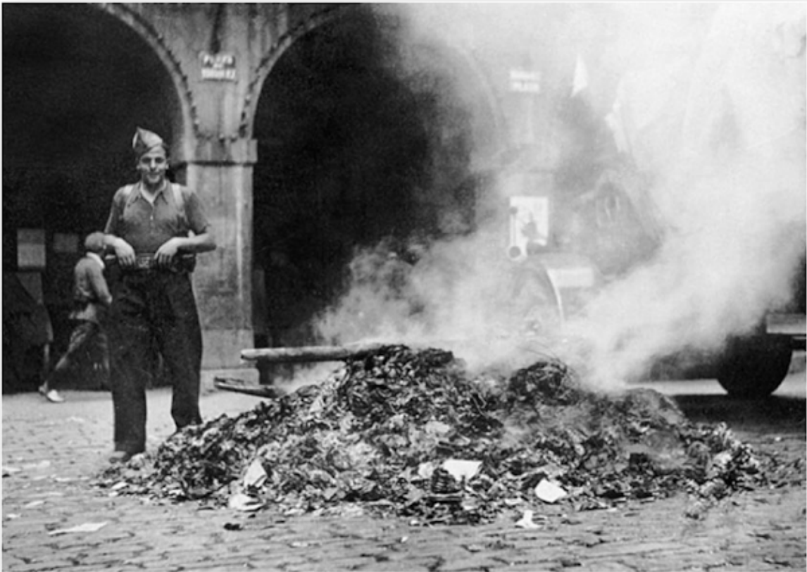
Ilustración 6. Quema de libros en Tolosa (Guipúzcoa), 11 de agosto de 1936