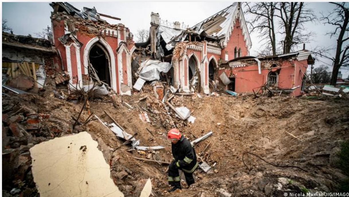
Ilustración 13. Dstrucción de la biblioteca juvenil de Chernigov (Ucrania) bombardeada por Rusia el 11 de marzo de 2022.

En el artículo titulado How Ukraine's librarians mobilised to fight the Russian culture war 32 , Jane Bradley, enviada especial a Ucrania, señala que desde que comenzó la invasión 60 bibliotecas ucranianas han sido destruidas, mientras que más de 230 han resultado dañadas por los bombardeos y los combates ( Ilustración 13 ). Las cifras oficiales no incluyen las bibliotecas situadas en ciudades que han sido destruidas casi por completo bajo la ocupación rusa, como Mariupol, ya que las autoridades ucranianas no han podido acceder a ellas para evaluar los daños. Sin embargo, es probable que también hayan sido destruidas.