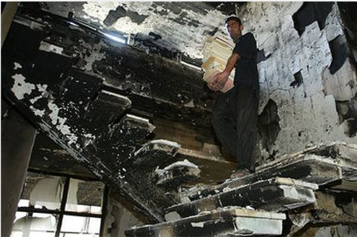
Ilustración 12. Un hombre rescata libros de la destruida biblioteca de Bagdad en abril de 2003.

La Biblioteca Nacional de Bagdad no fue destruida por los bombardeos norteamericanos sino por los mismos iraquíes ( Ilustración 12 ). En un par de horas, los 20.000 volúmenes, los microfilms, la colección de diarios y revistas y algunos incunables fueron devorados por el odio (Febbro, 2003). La Biblioteca albergaba tesoros árabes tales como los originales de Averroes y del matemático y astrónomo persa Omar Khayyam, las primeras traducciones al árabe de los trabajos de Aristóteles y los testimonios de la vida iraquí bajo el dominio Otomano. Conservaba poemas sufíes, literatura y mapas persas y centenares de novelas. En total se quemaron un millón de libros, además de las milenarias tabletas de arcilla robadas del Museo, los millones de documentos perdidos en el archivo, los 700 manuscritos destruidos y los 1.500 desaparecidos.