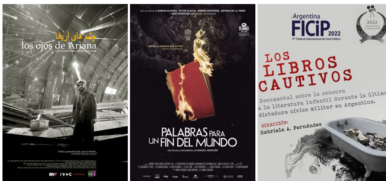
Ilustración 2. Carátulas de los documentales Los ojos de Ariana , Palabras para un fin del mundo y Los libros cautivos .