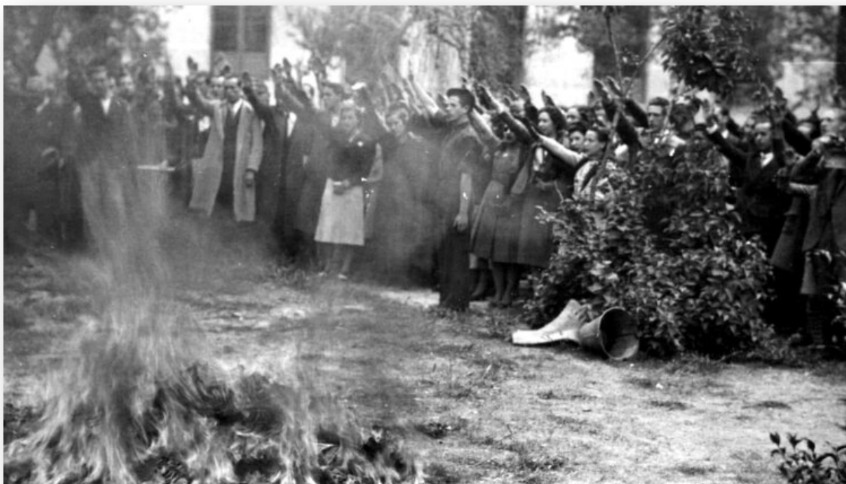
Ilustración 8. Quema de libros en Madrid, 28 de marzo de 1939

Las bibliotecas escolares tampoco se salvaron de la purga. La Orden del 4 de septiembre de 1936 acusaba al gobierno republicano de difundir en las aulas obras marxistas o comunistas por lo que muchas bibliotecas académicas fueron totalmente arrasadas. Fueron objeto de persecución o pasto de las llamas ejemplares de literatura infantil y juvenil como El Corsario negro , de Emilio Salgari, Los tres mosqueteros , de Alejandro Dumas, Platero y yo , de Juan Ramón Jiménez, Los cuentos de Andersen , Los viajes de Gulliver , o Caperucita roja , de Perrault.