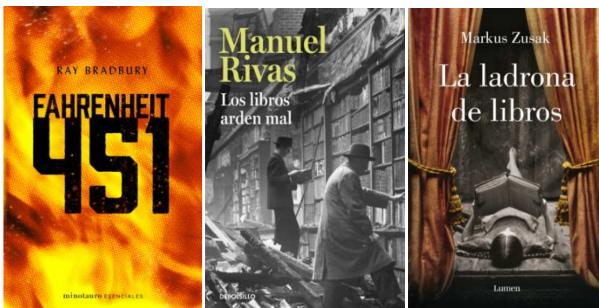
Ilustración 1. Portadas de las novelas Fahrenheit 451 , Los libros arden mal y La ladrona de libros .

de Elías Canetti, se termina inmolando en su propia biblioteca. También se incendia una biblioteca en la novela Titus Groan (1946) de Mervyn Peake, autor poco conocido, contemporáneo de Tolkien, con el que suele compararse, aunque más surrealista. Incluso si nos remontamos todavía más lejos en el pasado podemos encontrar un antecedente en el relato «Earth's Holocaust» que Nathaniel Hawthorne publica dentro de su libro Mosses from an Old Manse (1846). Es curioso que el último libro que se queme en él sea la Biblia . Christopher Marlowe ya había quemado una copia del Corán en su drama Tamerlán el Grande (1587) (Gamero, 2013).