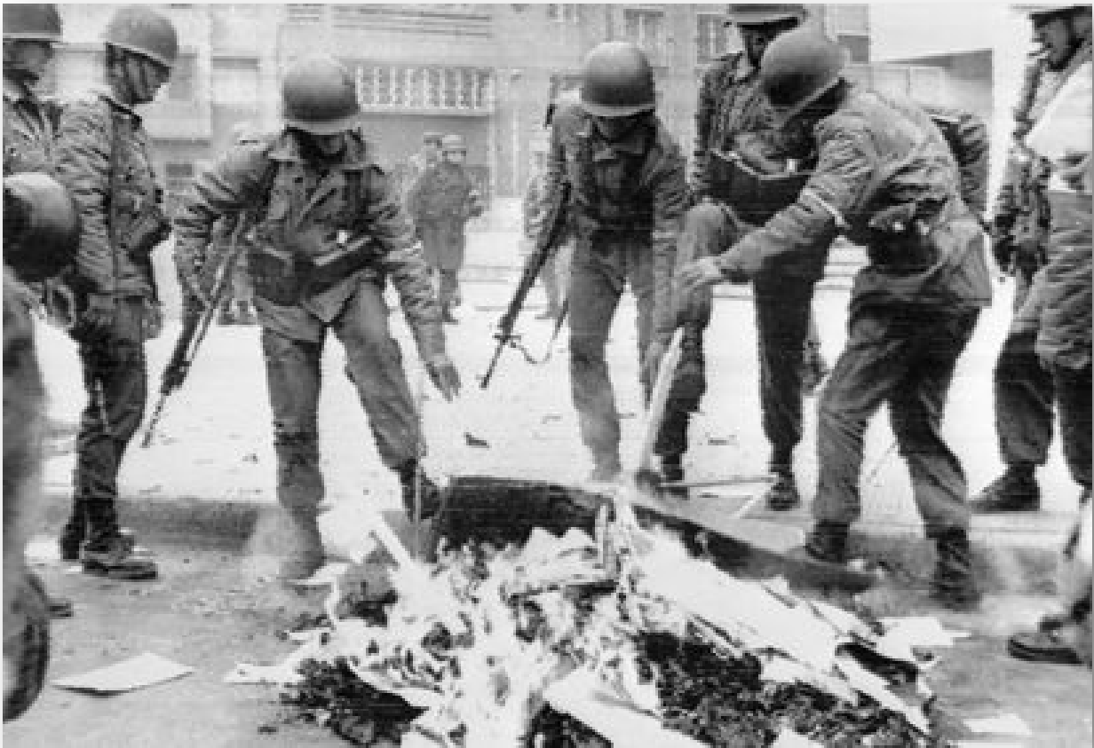
Ilustración 9. Quema de libros en Torres San Borja, 23 de septiembre de 1973

que la hoguera se mantuvo encendida «durante las 14 horas que duró el procedimiento» 27 (Donoso Fritz, 2013). Otra de las quemas más masivas ocurrió en la Facultad de Medicina de la Universidad una vez que los militares tomaron el control de las instalaciones (López, 2019).