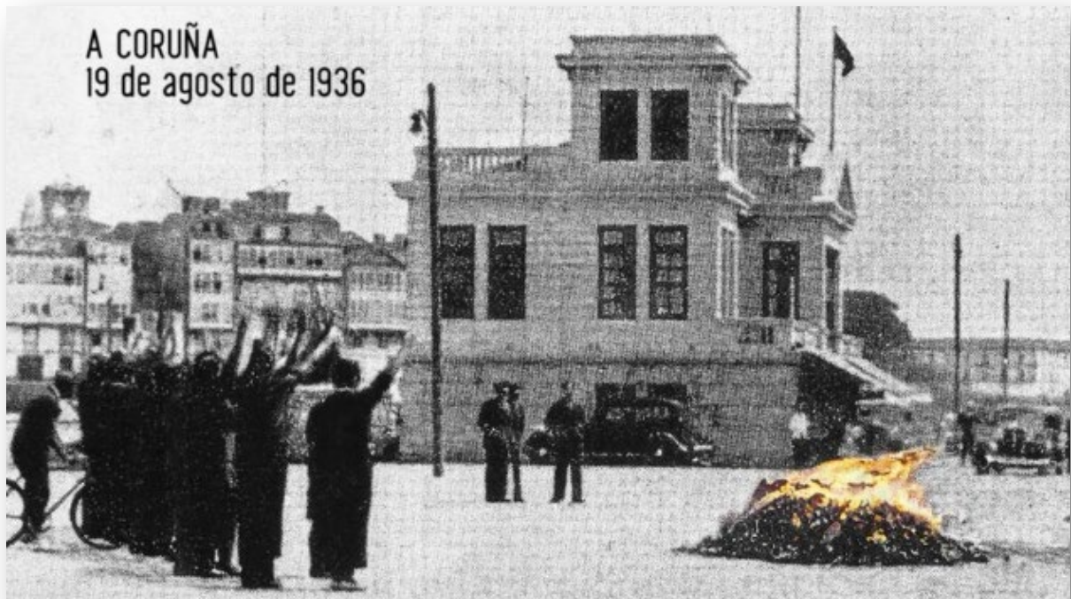
Ilustración 7. Quema de libros en La Coruña, 19 de agosto de 1936