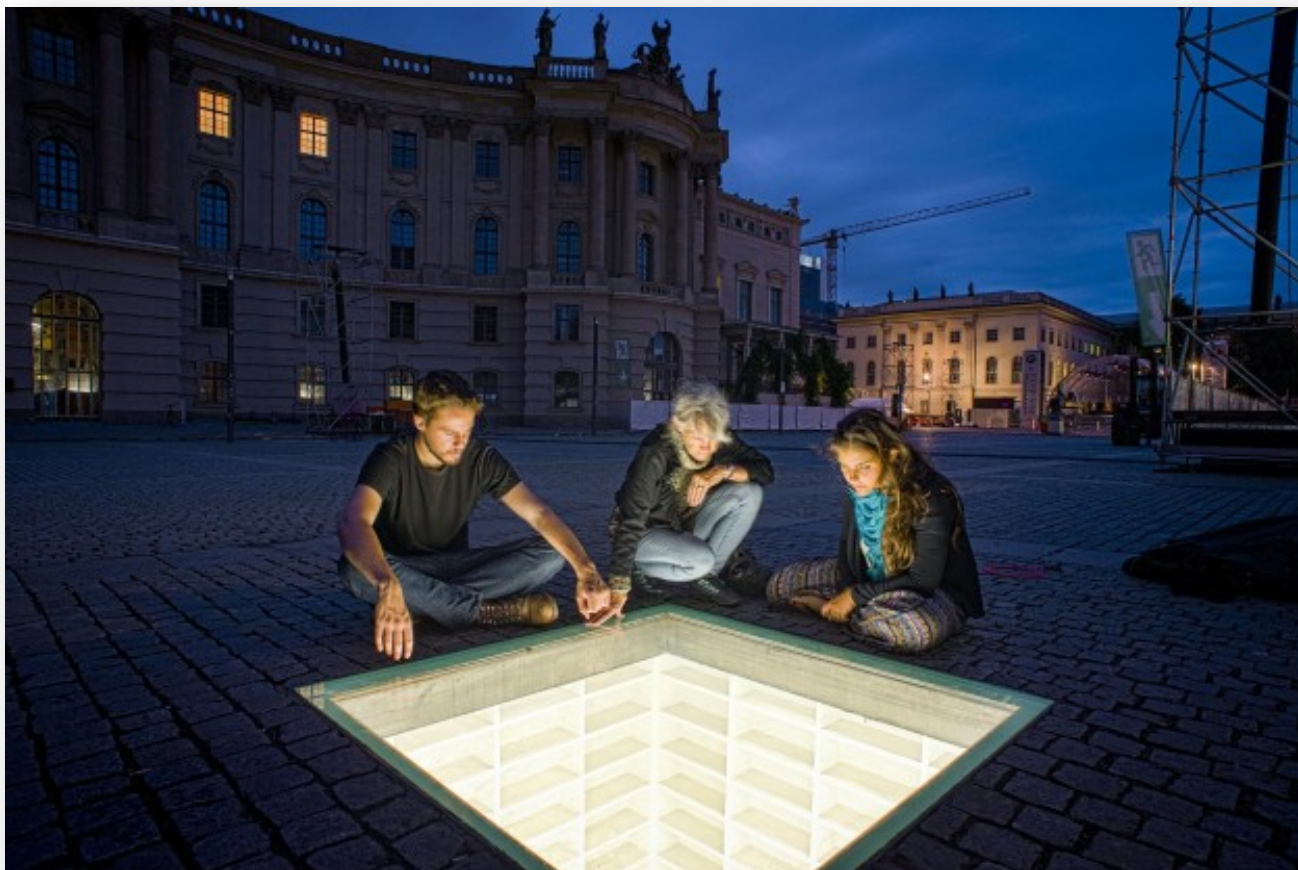
Ilustración 5. Monumento a la quema de libros en Bebelplatz.

En la actualidad, si visitamos la ciudad de Berlín, en la plaza de Bebelplatz, podremos contemplar un monumento conmemorativo que recuerda esta barbarie. Fue realizado por el artista israelí Micha Ullman e inaugurado el 20 de marzo de 1995. Se trata de una ventana de plástico que está en suelo a través de la cual se observa un cuarto de biblioteca subterránea que tiene varios estantes de color blanco completamente desocupados. Simbólicamente, las estanterías subterráneas tienen espacio para unos 20.000 libros, como recuerdo de los 20.000 ejemplares que ardieron en llamas en Berlín el 10 de mayo de 1933 ( Ilustración 5 ).