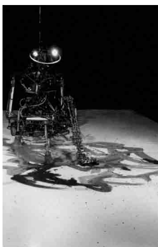
Figura 1 · Carlos Corpa. A.P.M. Another Painting Machine (1999). Fuente: web del artista.