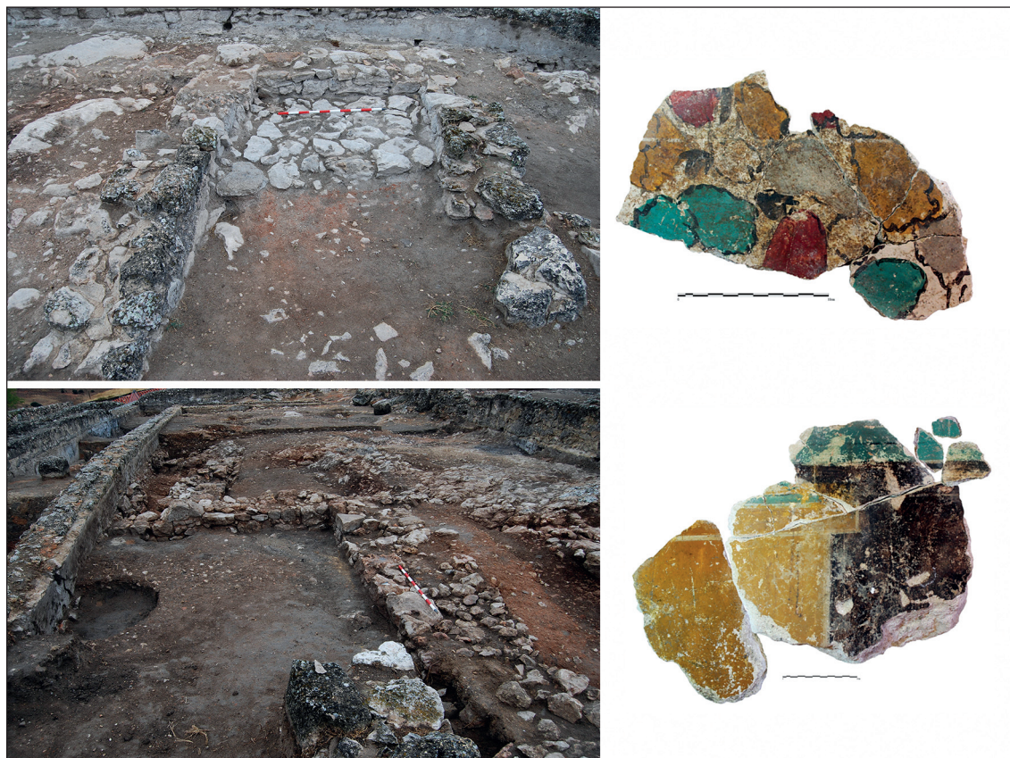
Fig. 2. Restos de las estructuras domésticas documentadas en la ladera norte del cerro (imágenes de R. Cebrián) y de la pintura mural del segundo estilo pompeyano adscritos a época cesariana (imágenes A. Fernández-Díaz).

Las estructuras documentadas junto a la muralla norte constituyen un conjunto de pequeñas edificaciones que se asentaron de forma aterrazada en la ladera del cerro al amparo de la cerca defensiva. Se separaron de esta definiendo una franja diáfana a modo de ronda intramuros. Su planta no ofrece una lectura clara, distinguiéndose dos conjuntos de alineaciones con anchuras diferentes que podrían responder a dos momentos sucesivos. Las mejor conservadas son las que, con una orientación este-oeste y paralelas a las curvas de nivel, quedaron preservadas en el criptopórtico y bajo el terraplenado de la plaza monumental. Configuraron una crujía alargada que, en su costado occidental, se prolongó en escuadra hacia el sur. Una estancia menor, de planta prácticamente cuadrada, se situó al sur de esta segunda nave, comunicada hacia el este con un área que, aparentemente, pudo permanecer libre de construcciones. Otras estructuras de una envergadura algo mayor podrían haberse adosado a este conjunto inicial, definiendo algunos nuevos ámbitos de planta rectangular hacia su extremo oriental.