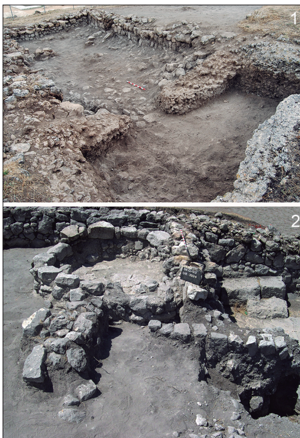
Fig. 6. Evidencias de viviendas emirales en Segobriga . 1. Ámbito doméstico de época emiral que reaprovecha en su estructura la cisterna de una casa altoimperial. 2. El horno del recinto 1 de época andalusí.