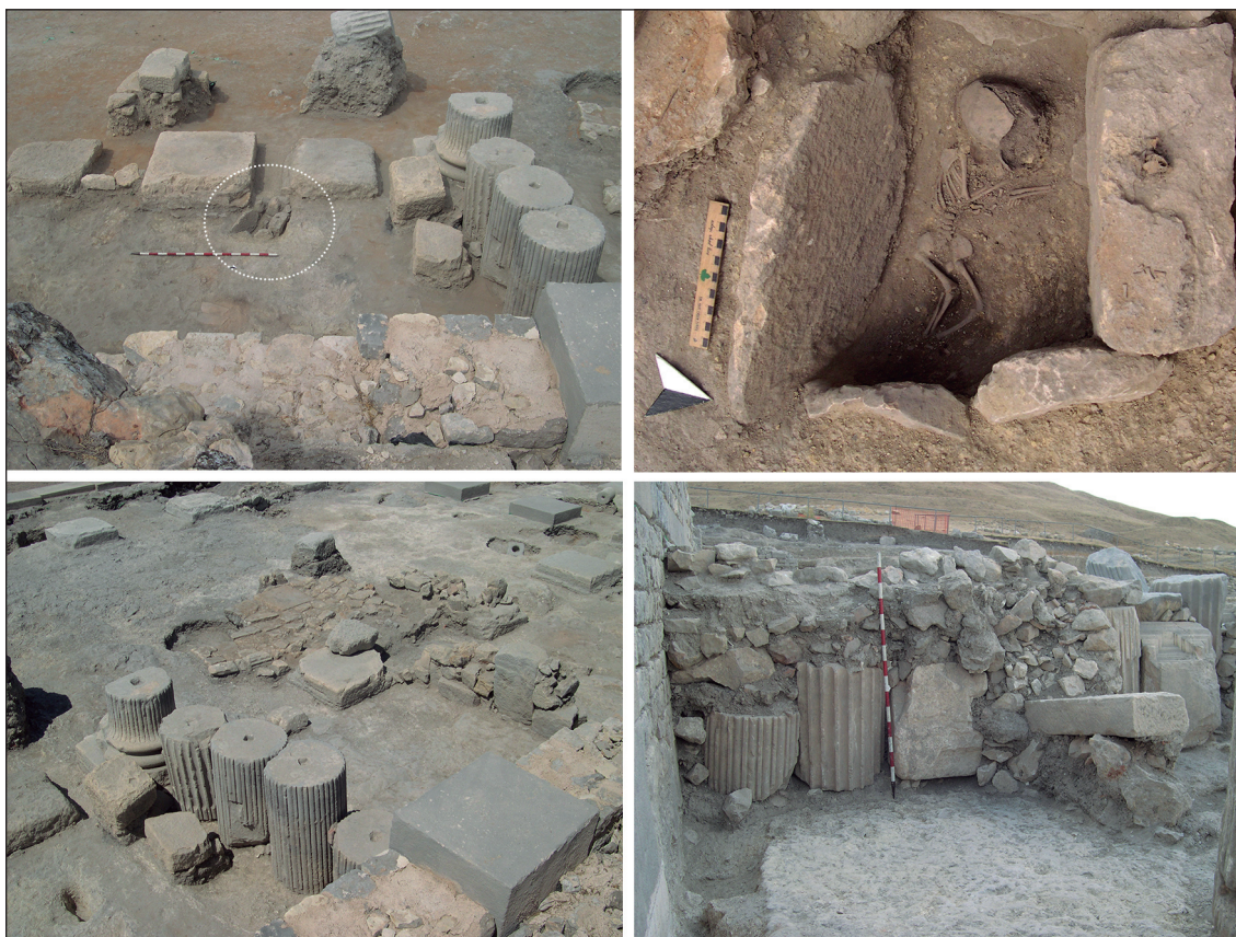
Fig. 4. Reocupación habitacional de la nave oriental de la basílica del foro y detalle de uno de los enterramientos infantiles hallados en su excavación.

Mientras tanto, la basílica permaneció libre de construcciones hasta su total desmantelamiento, cuando su solar pasó a ser aprovechado para el establecimiento de un conjunto de pequeños departamentos habitacionales que ocuparon su franja oriental y ambas aedes (Fig. 4). Sus estructuras aprovecharon los lienzos inferiores del edificio altoimperial, que en estos sectores no habían sido demolidos por constituir los muros de contención de las plataformas anexas. Para su construcción se reempló todo tipo de material