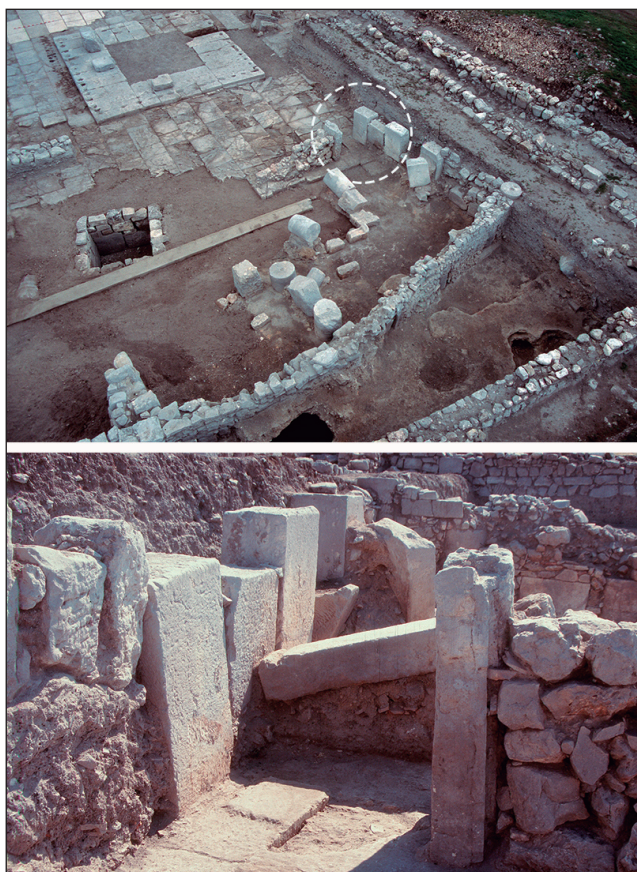
Fig. 5. Vivienda singular de época visigoda en el solar del foro (imágenes de J. M. Abascal).

Muy próximo a ella, el solar de lo que fuera la basilica quedó libre de construcciones excepto en su extremo meridional, donde, sobre las ruinas de la reocupación tardorromana de la aedes sur, se levantó una única estructura doméstica con piso de ladrillos y tierra apisonada. Un nivel de relleno de unos 70 cm de espesor colmató de manera generalizada todo este sector y, sobre él, se excavó un auténtico campo de silos perfectamente estructurado. Se desarrolló a lo largo de su franja occidental y se extendió hacia la antigua plaza del foro, alcanzando su área central. También por la terraza superior a la basilica, donde algunos de estos graneros quedaron al amparo de cobertizos techados con teja curva y, otros, dentro de cercados de planta poco definida. Junto a ellos se inhumaron un neonato y un individuo infantil.