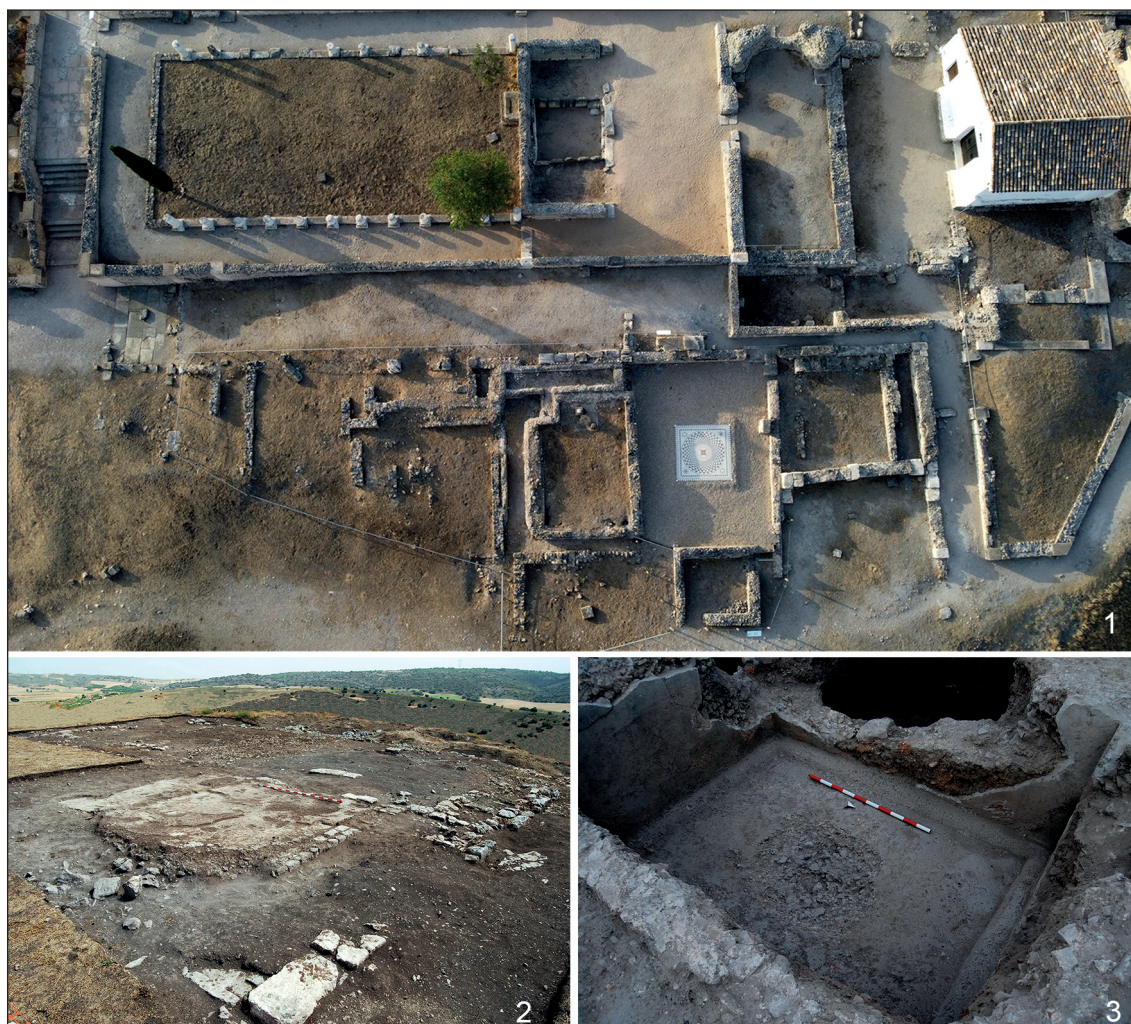
Fig. 3. Viviendas de época altoimperial de Segobriga. 1. La denominada casa de Silvano. 2. Vivienda de peristilo al este de la basílica forense. 3. Cisterna de una casa excavada en la terraza superior a la basílica del foro.

En las insulae situadas inmediatamente al oeste (III-E – IV-E/III-S – IV-N) y al noroeste (II-E – III-E/II-N – III-N) los restos remiten a otras dos viviendas cuyas estructuras se encontraron profundamente alteradas por las intensas reocupaciones posteriores. Ambas dispusieron de cisternas para el almacenamiento de las aguas pluviales, excavadas en el terreno natural aprovechando la topografía inclinada de la ladera. De la primera solo se conoce su depósito abovedado, de opus caementicum revestido interiormente con signinum , y un grueso pavimento de mortero de cal asociado a dos muros de mampostería (Fig. 3.3). Podría corresponder al atrio de la casa, al que se vinculan diversos elementos arquitectónicos como fragmentos de columnas y pilastras de fuste liso. La segunda se estableció, a mediados del siglo II, sobre el solar de las dos casas con patio tardo-republicanas, que permanecía, terraplenado y sin edificar desde la demolición de los inmuebles en época de Tiberio. Dispuso igualmente de un depósito de aguas en opus caementicum circundado por un atrio pavimentado en opus signinum .