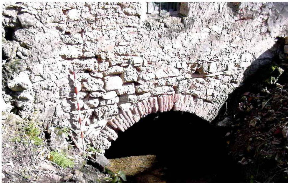
Arcos de desagüe en los molinos del Batán

11. Molino del Santo . Situado junto a la carretera que se dirige de Villanueva de los Infantes a Cózar. Es un edificio de planta rectangular con un pequeño habitáculo adosado al muro oeste. Todo el edificio está construido con mampostería y tapial, revocado en algunos casos con yeso. En el interior se observan tres dependencias: una de ellas corresponde al habitáculo adosado y las otras dos a la nave central, separadas todas por un muro de tapial.