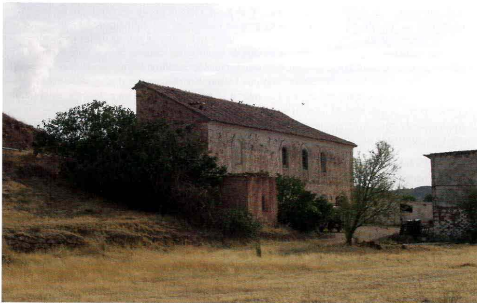
Vista general del molino Nuevo

5. Molino Nuevo . Situado junto a la carretera anteriormente citada, a unos 2,5 kilómetros del casco urbano de Montiel. Es el mejor conservado de todos los estudiados, ya que estuvo en uso hasta mediados de los años cincuenta. Es un edificio de dos plantas construido con mampostería de arenisca reforzada mediante sillares esquineros del mismo material. El agua llega por un canal hasta un cubo que vuelca en el rodezno, partiendo varios canales desde el canal de salida para el riego de las huertas cercanas. El edificio molinar posee todas las dependencias propias de este tipo de edificios: cuadras, sala de molienda con parte de la maquinaria, almacén y vivienda del molinero.