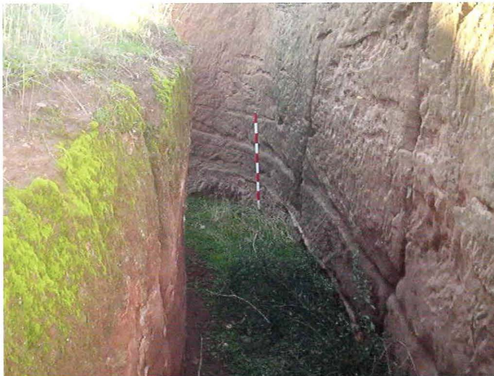
Caz rupestre en el molino de Vicario

Sin embargo, es en las Relaciones Topográficas de Felipe II donde se mencionan un gran número de molinos situados sobre el río que nos ocupa: "...con el agua del río muele una piedra de molino ordinariamente aunque del pueblo abajo hasta media legua en tiempo de agosto muelen a represa...". Esta cita hace referencia a que en la zona de Valverde había un molino, que bien podría relacionarse con el edificio antiguo denominado "Molino Nuevo". Además, se indica que hay un molino que pertenece a la Vicaría de la Orden, el cual puede ser puesto en relación con el denominado "Molino del Vicario". Por último, en Alcubillas se menciona que hay un molino "a tiro de ballesta", que muy posiblemente tenga relación con el estudiado en esta localidad. Aún sin certeza de que los edificios que se conservan hoy sean los existentes ya en el siglo XVI, es probable que sí tengan su origen en éstos, habiéndose remodelado o reconstruido con el paso de los siglos.