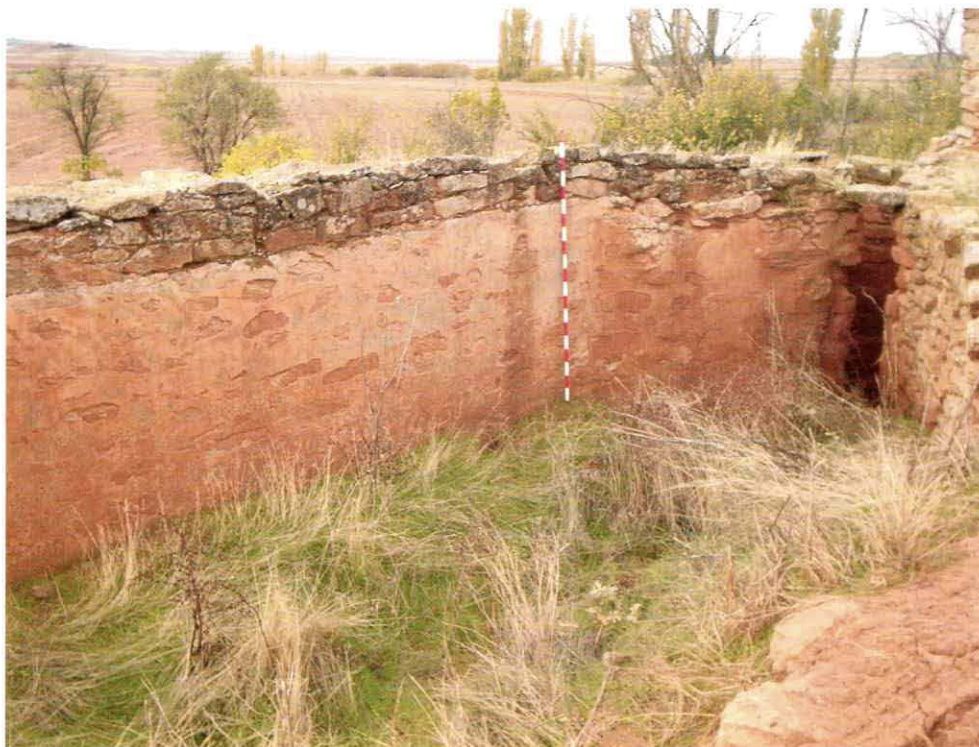
Balsa del molino del Montón de Tierra

El agua que entra al molino procede de una presa cuyo muro frontal es de sillería y tiene planta en forma de embudo.