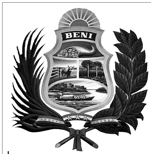
Figura 1 – Escudo actual del Beni

Así, si en el cuartel central derecho se describía el bosque tropical con árboles de goma y en el cuartel central izquierdo aparecía la pampa ocupada con una res bovina y un corral; el cuartel superior lo ocupaba un cornucopia que, si bien en el escudo original de 1889 derramaba distintos frutos, el auge de la goma elástica haría que, posteriormente, vertiera libras esterlinas. A pesar de ello, nos interesa señalar el cuartel inferior donde fue representado un paisaje beniano singularizado por un caudaloso río a orillas del cual se alzaba una intrincada selva. Este río era surcado por una embarcación en el que, originalmente se destacaba una gran bandera boliviana en la popa que, años después, quedaría en un segundo plano al modificar la imagen para incluir una tripulación formada por nativos benianos caracterizados por sus camisas y sombreros de paja, cuatro de ellos remando y uno ejerciendo de timonel desde la popa (Céspedes, 1942; Becerra Casanovas, 1992; Dávalos Mendoza, 2006).