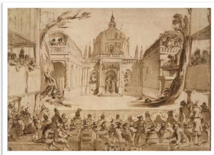
Fig.2. G. F. Barbieri (1591-1666) Il Guercino, Una scena teatrale all'aperto vista dall'uditorio , The