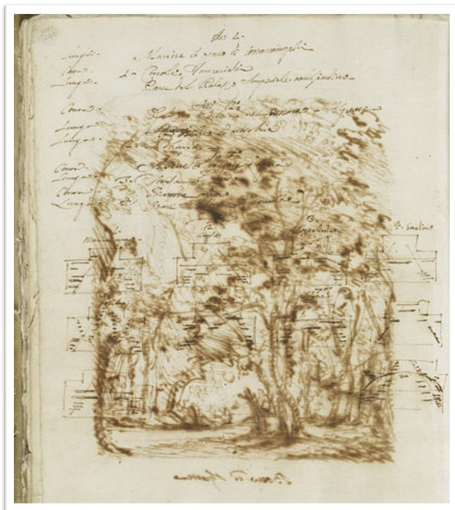
Fig. 1. Filippo Juvarra, Diseño Teatral (17081712).

Con numerosas anotaciones que se pueden considerar como estudios preparatorios de los grabados definitivos para el montaje final de Il Ciro , Victoria & Albert Museum.