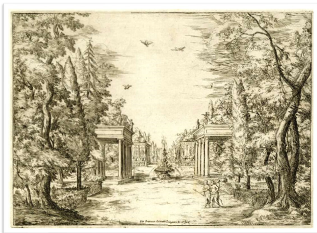
Fig. 3. G. Fco. Grimaldi, Hércules y Iole en un jardín, La sincerità trionfante , 1639. The British Museum.

ad hoc , que ya se estaba larvando en los espectáculos romanos vinculados con la aristocracia pontificia, en torno a mediados del 1600, incluso antes de que falleciera la reina Cristina de Suecia, que había patrocinado muchos de ellos y en los cuales la Naturaleza empezaba a cobrar protagonismo hegemónico.