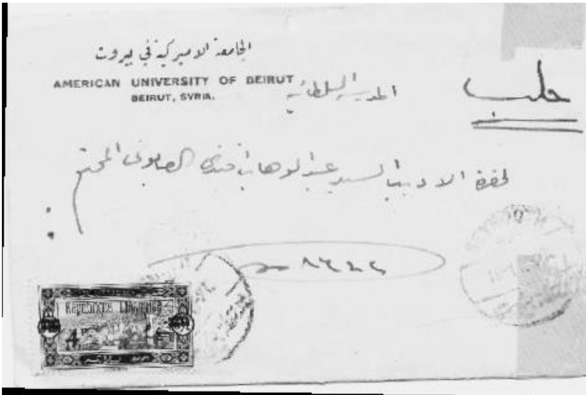
Figura nº. 3.: Carta enviada desde Alepo por 'Omar Abū Rīša a su amigo 'Abd al-Wahhāb al-Ṣābūnī, Beirut 1927.