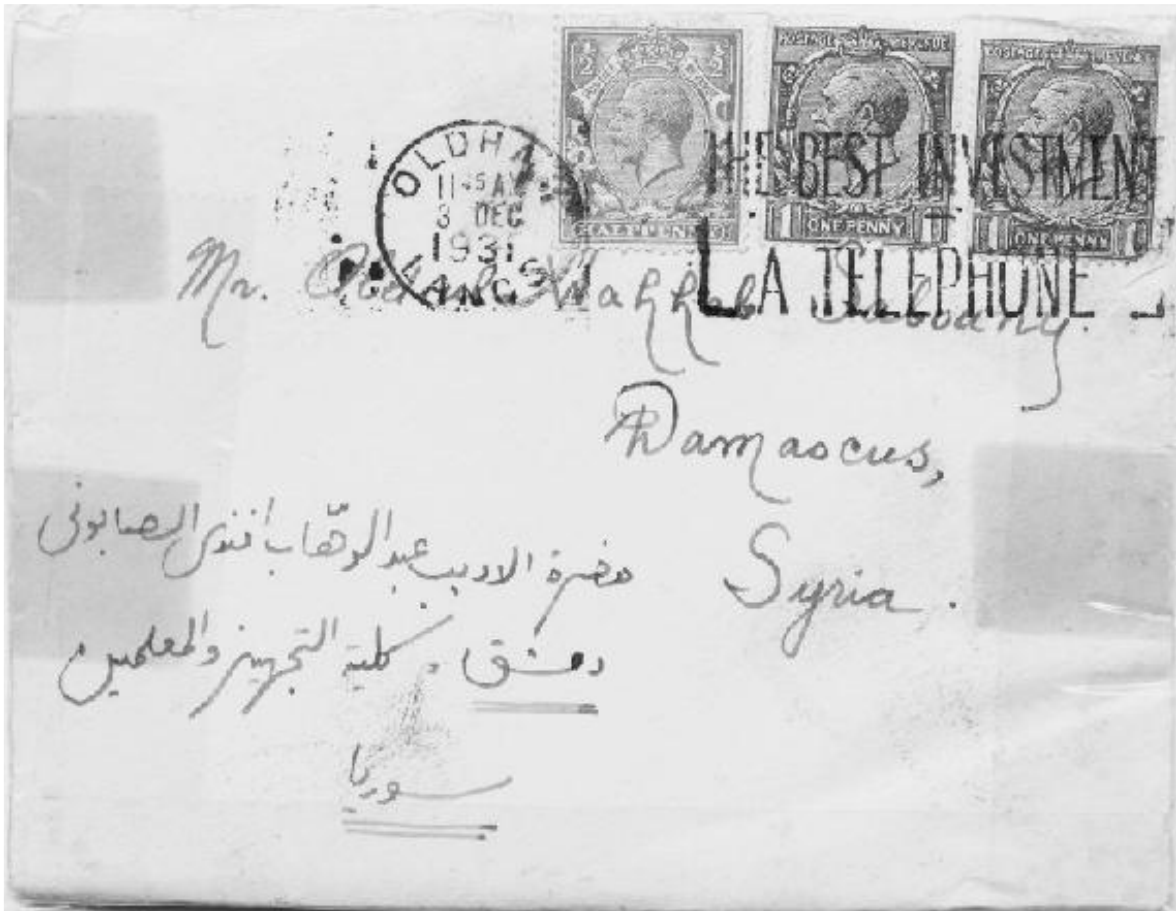
Figura nº. 2.: Carta enviada por 'Omar Abū Rīša a su amigo 'Abd al-Wahhāb al-Ṣābūnī, Beirut 1927.