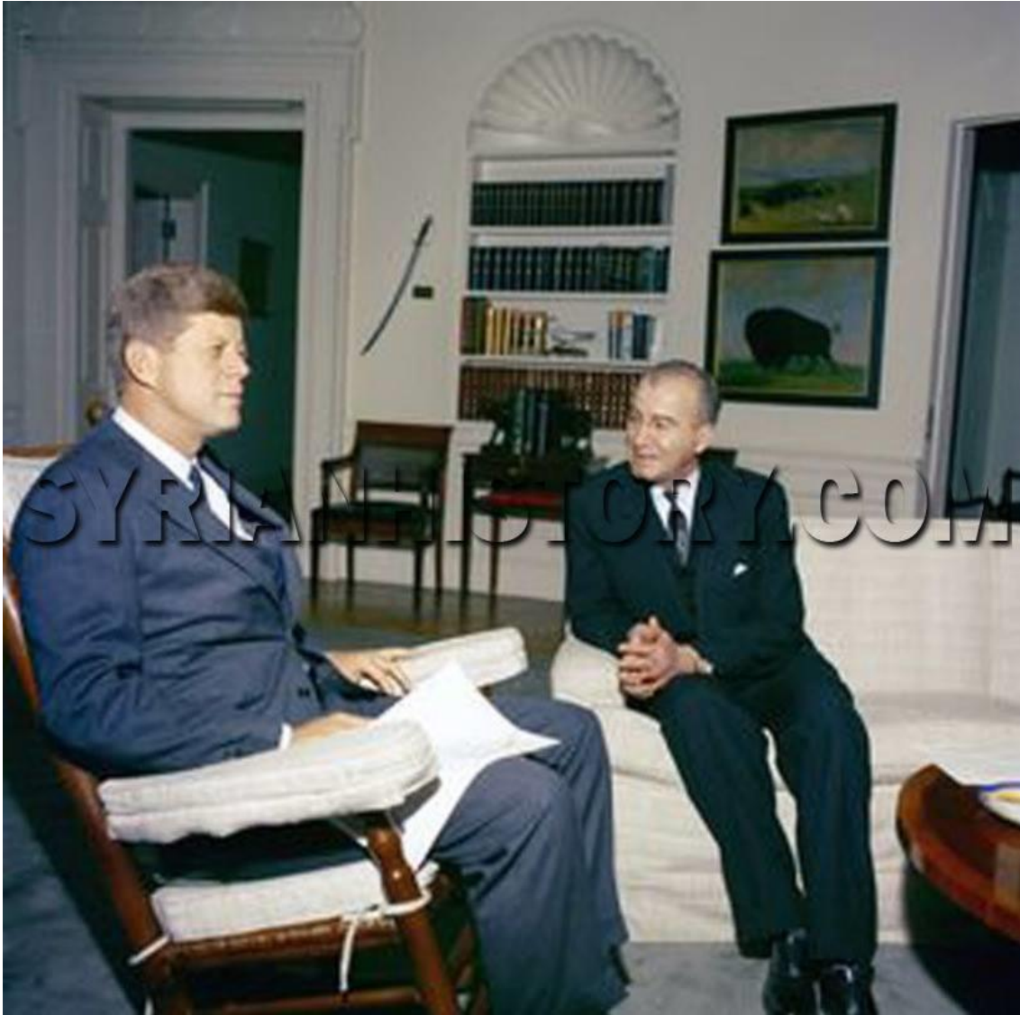
Figura nº. 8.: Imagen que reúne a ‘Omar Abū Rīša embajador de Siria en los Estados Unidos de América con el presidente de los Estados Unidos John F. Kennedy, 1962.

En 1962 fue elegido el gran poeta sirio ‘Omar Abū Rīša embajador de Siria – En los tiempos de separación entre Siria y Egipto - en los Estados Unidos de América. En un tiempo récord, Abū Rīša se convirtió en el amigo personal del presidente de los Estados Unidos John F. Kennedy. Abū Rīša graduado en Manchester y la Universidad Americana de Beirut, dominaba el inglés con fluidez.