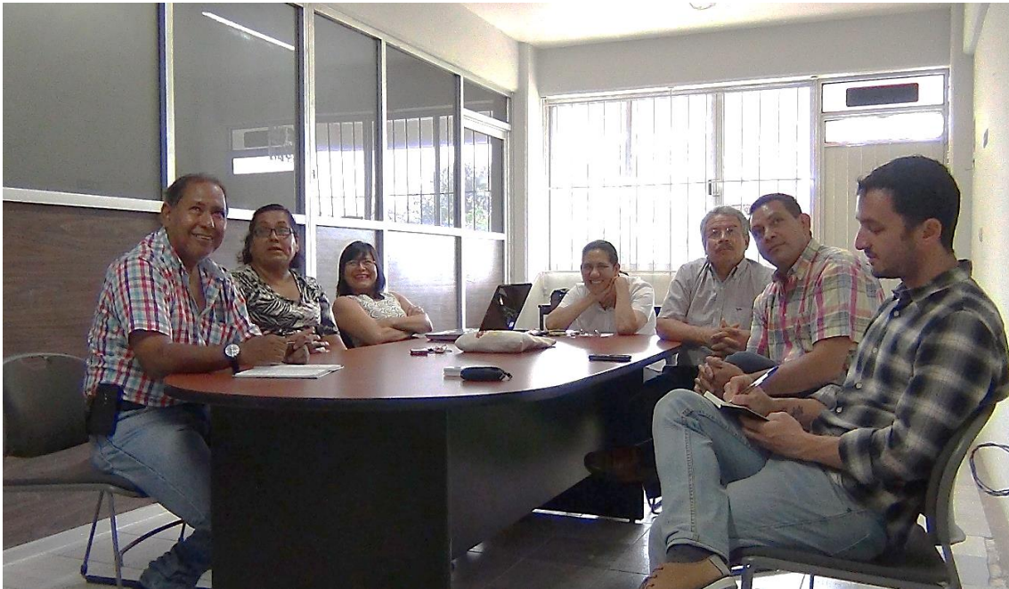
Imagen 2: Sesión de foto-elicitación

A continuación, se ofrecen, a modo de ejemplo, dos fotografías que fueron trabajadas en dos sesiones diferentes. En primer lugar, se muestra la fotografía que fue trabajada en la segunda sesión de trabajo del curso, el martes, 19 de abril de 2015. En la Imagen 3 se ven dos plantas de maíz en bolsas de plástico, en primer término, frente a un grupo de plantas de maíz que se encuentran al lado de una casa blanca: