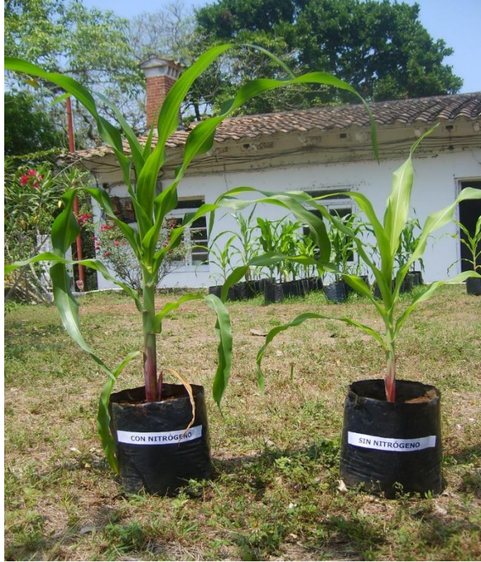
Imagen 3: Las plantas de Cuauhtémoc

La anterior fotografía fue tomada, según nos contó su protagonista, durante uno de los experimentos que este realizó durante su doctorado en el que investigaba con plantas de maíz. A continuación se muestra un fragmento de la transcripción de uno de los momentos de la sesión de ese día: