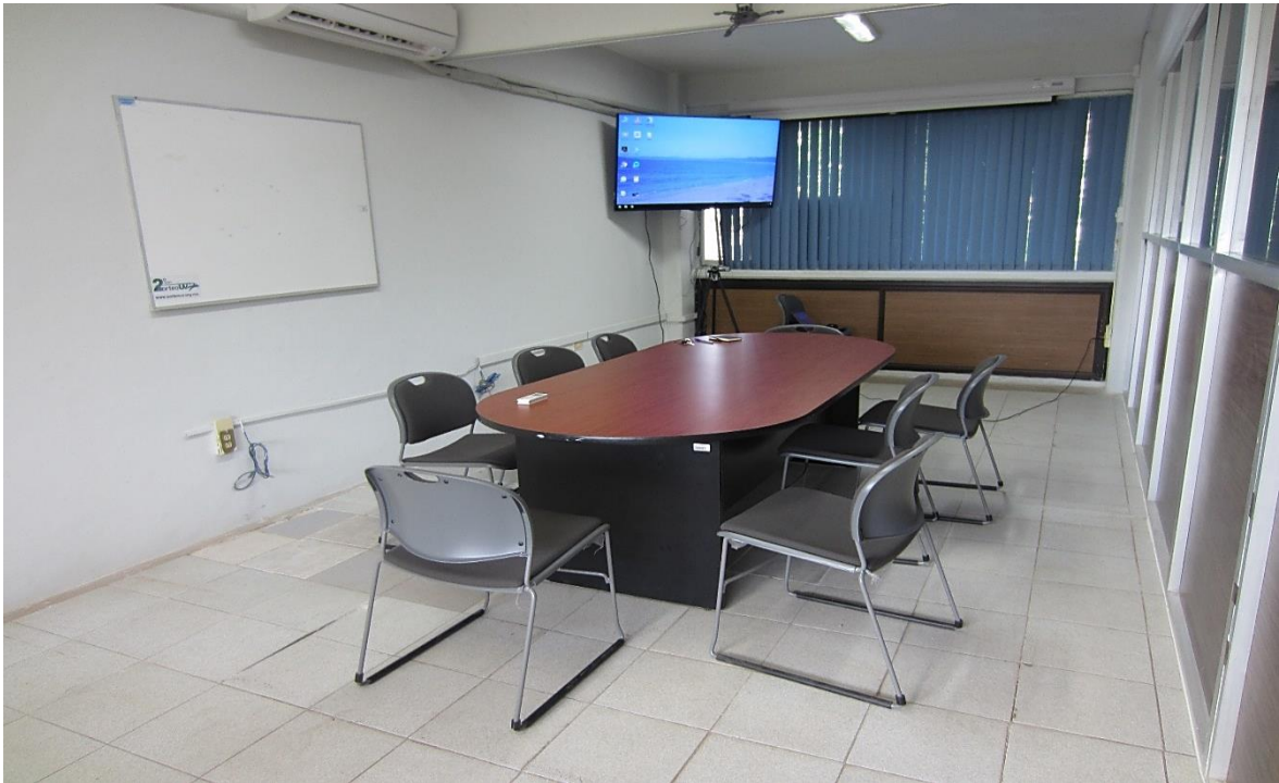
Imagen 1: El aula de trabajo

Todas menos la primera sesión, del lunes 18 de abril, fueron grabadas en vídeo 25 . Además, tal y como se explicaba en el apartado sobre metodología, todos los días se escribía el diario de campo, tanto antes de empezar las sesiones, recogiendo, por ejemplo, posibles problemas que pudieran surgir, como, sobre todo, después de las sesiones, donde se desarrollaban las notas de campo que había ido tomando en el transcurso de la sesión de trabajo. La cámara de vídeo se localizaba justo debajo del televisor, tal y como se puede observar en la Imagen 2. Además, el contenido de cada uno de los siete vídeos fue visualizado y transcrito (Anexo 3). La Imagen 2 muestra una fotografía tomada durante una de las sesiones de trabajo con el profesorado FISPA, concretamente, la cuarta sesión del 21 de abril de 2016. En ella se puede observar cómo los participantes están atentos mirando a la pantalla de televisión donde se proyecta la fotografía que se está trabajando, observando y hablando, mientras el investigador anota en el cuaderno de campo: