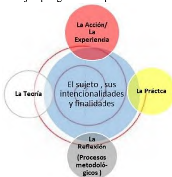
Figura 2. Ejemplo gráfico del proceso circular-espiral

Esta metodología describe el proceso de enseñanza-aprendizaje como un proceso iniciado y gestionado por el propio estudiantado y supervisado por el profesorado, “agente” facilitador de la realidad profesional, más allá de las aulas, como se observa en la figura 2.