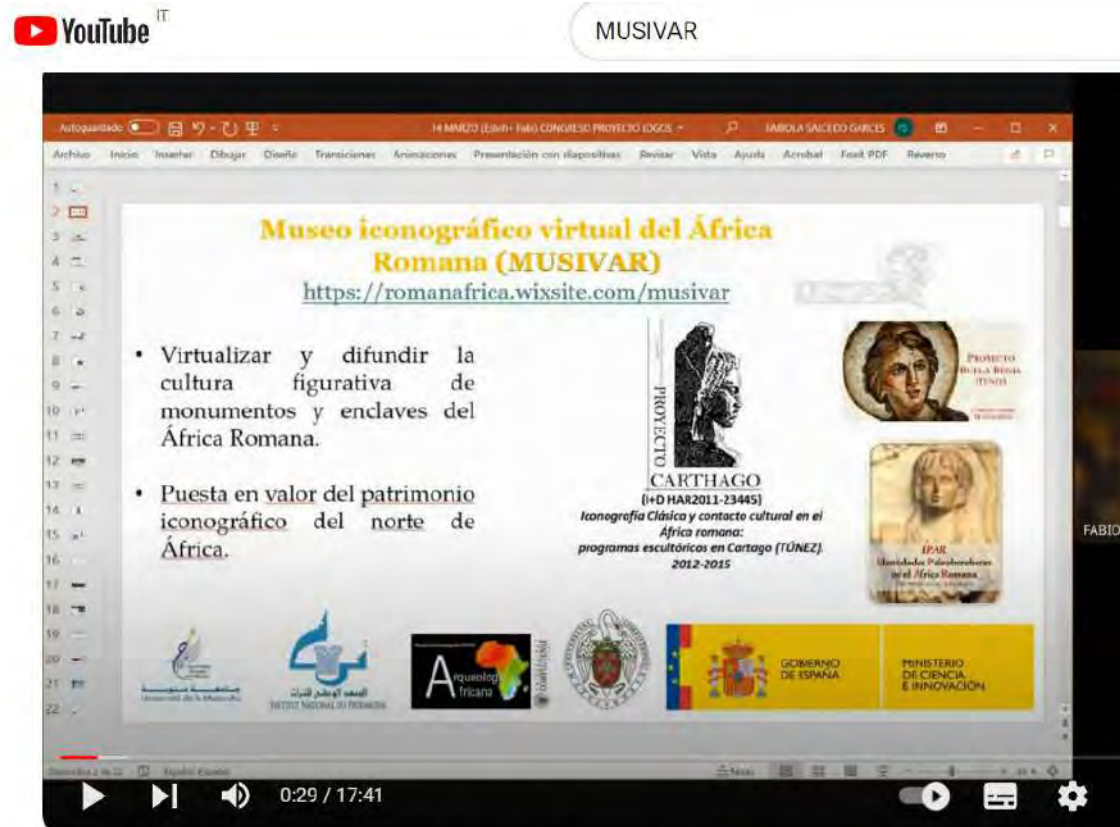
MUSIVAR: una herramienta de difusión científica y patrimonial

https://www.youtube.com/watch?v=1yTh0AYhbYQ&t=33s