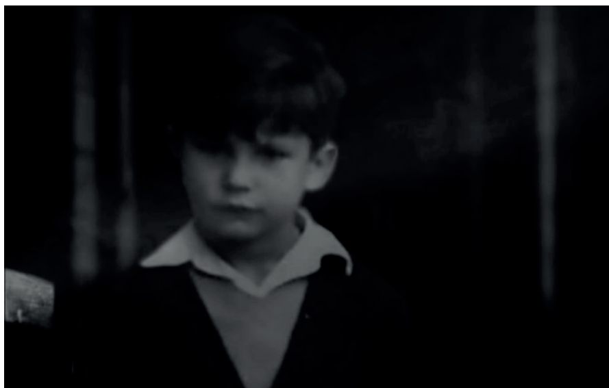
[Fotograma de La Morte Rouge (Soliloquio) (Víctor Erice, 2006)]

La Morte Rouge (Soliloquio) se acompañó de otro proyecto breve y de carácter de no ficción: la correspondencia fílmica entre Víctor Erice y Abbas Kiarostami. Este carteo se produjo gracias a la intervención de los comisarios Alan Bergala y Jordi Balló que invitaron a ambos cineastas a mandarse cartas audiovisuales. Aunque existían correspondencias fílmicas previas esta supuso una increíble ruptura pues no se presentaban como fragmentos de una película conjunta, sino como piezas individuales que se enlazaban una tras otra, para luego ser contempladas en una exposición museística.