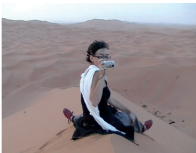
[Fotograma de Límites: 1ª Persona (Elías León Siminiani, 2005)]

El corto anterior y su texto lo escribió con una única finalidad: recuperar a la mujer que salía en la película, juntos —ya como pareja— habían viajado a África, pero a su regreso a Madrid habían roto su relación. Él escribió y montó Zoom para recuperar el amor de la chica. Por ello, Siminiani revela que la voz de Luis Callejo solo refleja una mentira o ensoñación en el primer corto. Pero Límites: 1ª Persona no funciona como una mera confesión, sino que es en sí un nuevo ensayo sobre las imágenes. Zoom y Límites: 1ª Persona forman una meditación audiovisual compleja porque le muestra al espectador hasta qué punto ese largo plano que vimos en las dos películas puede ser visto, leído y entendido de forma opuesta 65 .