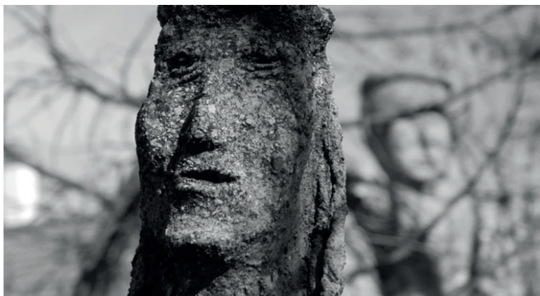
[Fotograma de El jardín imaginario (Guillermo Peydró, 2011)]

Así en El jardín imaginario la figura del escultor Máximo Rojo y las imágenes de sus obras no son en realidad el centro de la narración o los protagonistas de la trama, sino que más bien son el aliciente para comenzar a andar y divagar sobre el significado del arte, del cine y, por supuesto, del propio ensayo audiovisual.