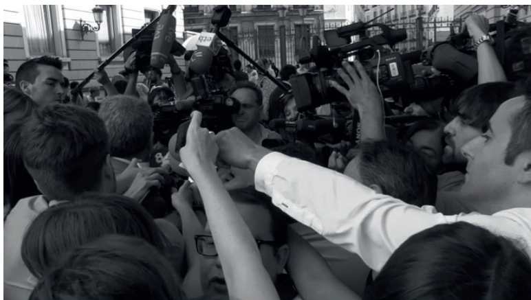
[Fotograma de Improvisaciones de una ardilla (Virginia García del Pino, (2017)]

También utilizando la sátira y los recursos digitales, el viñetista Aleix Saló presentó Españistán, de la burbuja inmobiliaria a la crisis (2011), se trataba de un cortometraje animado, que se publicó directamente en YouTube y que rápidamente se viralizó (en el momento de la escritura de este texto ya ha logrado más de 6.500.000 de visitas). El acierto de este formato se basa en el carácter explicativo, en el uso de la sorna y en el excelente diseño de los dibujos. El tremendo éxito de la obra demuestra cómo sin recurrir a los caminos tradicionales de distribución y exhibición un cortometraje documental, un filme puede convertirse en un fenómeno social. Hasta en la crisis, aparecían caminos fructíferos para expandir las obras.