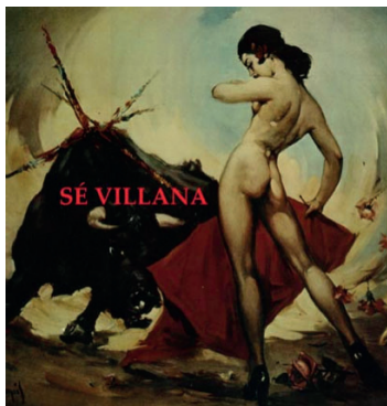
[Afiche de Sé villana (La Sevilla del Diablo) (María Cañas, 2012)]

También utilizando la sátira y los recursos digitales, el viñetista Aleix Saló presentó Españistán, de la burbuja inmobiliaria a la crisis (2011), se trataba de un cortometraje animado, que se publicó directamente en YouTube y que rápidamente se viralizó (en el momento de la escritura de este texto ya ha logrado más de 6.500.000 de visitas). El acierto de este formato se basa en el carácter explicativo, en el uso de la sorna y en el excelente diseño de los dibujos. El tremendo éxito de la obra demuestra cómo sin recurrir a los caminos tradicionales de distribución y exhibición un cortometraje documental, un filme puede convertirse en un fenómeno social. Hasta en la crisis, aparecían caminos fructíferos para expandir las obras.