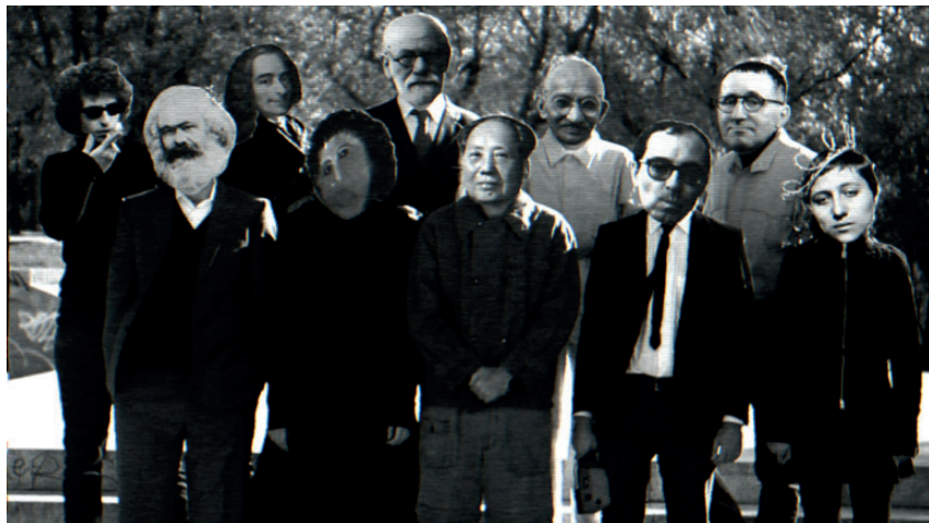
[Fotograma de Los artistas de todo a un euro (Terrorismo de Autor, 2015)]

Otra de las cineastas que lograron una crítica audaz y certera al sistema establecido fue María Cañas. Su obra no solo atacó el sistema del poder, sino que cuestionó el sistema cultural y artístico establecido. Su cine, que ella denomina «risastencia», «videoguerrilas» o «videodelirios», utiliza los recursos disponibles para zandarrear las propuestas más convencionales y evidenciar que la fractura de la crisis no solo era financiera sino, también, social y artística. Como en el trabajo de los dos colectivos anteriores, el humor en la filmografía de Cañas se usa como el arma más incisiva: