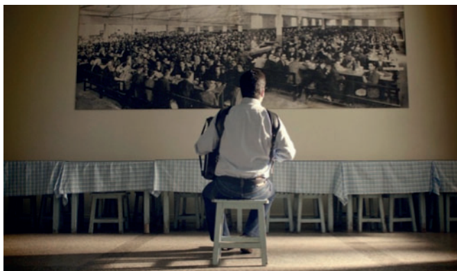
[Fotograma de «Cristales rotos» episodio dirigido por Víctor Erice en Centro histórico (2012)]

Cinco años después de las correspondencias, Erice presentó un nuevo cortometraje documental «Cristales rotos» («Vidrios partidos», 2012). Este trabajo surgía de un encargo colectivo para festejar la capital cultural de la ciudad portuguesa Guimarães y era uno de los episodios de la película Centro Histórico (2012) en la cual intervinieron los cineastas: Pedro Costa, Aki Kaurismäki, Manoel de Oliveira y el propio Víctor Erice. Los cuatro directores aceptaban esta sugerencia de la Fundación Ciudad de Guimarães para filmar alguna historia relacionada con el área urbana de esa población portuguesa.