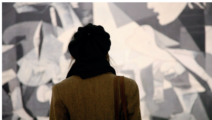
[Fotograma de Las variaciones Guernica (Guillermo Peydró, 2012)]

cuál debería ser su efecto en la actualidad. Así en Las variaciones Guernica , Peydró intercala conferencias de eruditos, fragmentos del lienzo con imágenes de televisión en la que se muestran manifestaciones, desahucios... El lienzo del pintor malagueño se ha transformado en un icono cultural y un reclamo turístico y de mercadeo, pero ha perdido todo su significado y toda su carga política.