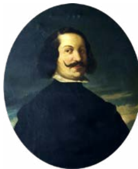
File:Juan de Valdés Leal by Manuel Cabral Aguado-Bejarano. png - Wikipedia