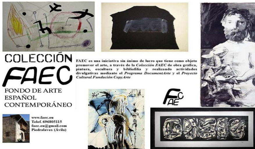
Fig. 1. Folleto informativo de la Colección FAEC editada por Alfonso Utrilla de la Hoz

Según consta en los folletos publicados por el propio Alfonso Utrilla de la Hoz 2 la Colección FAEC logró reunir: